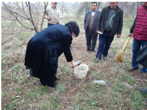
Обучения по применению биологических пестицидов