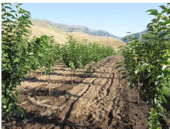
Экспериментальный участок Тюпского ЛХ