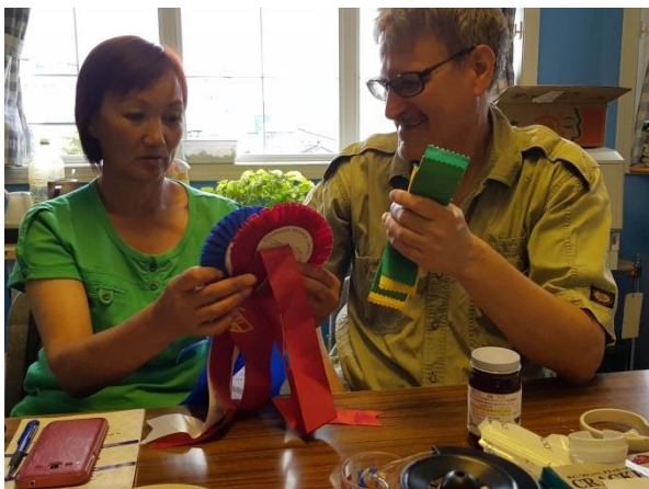
Обучение в Японии в 2018