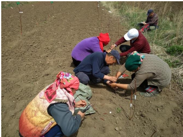
Ежемесячные посещения экспериментальных участков местным консультантом