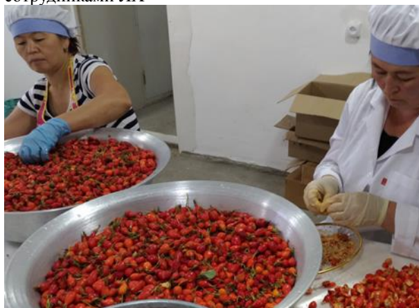
Переработка шиповника членами жамаата