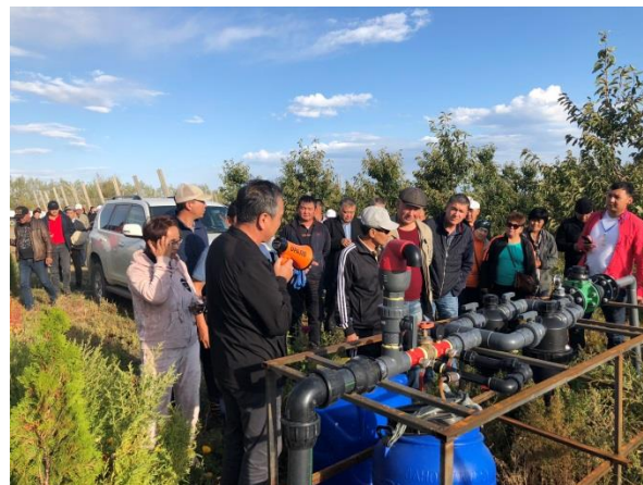
1й семинар и учебная поездка