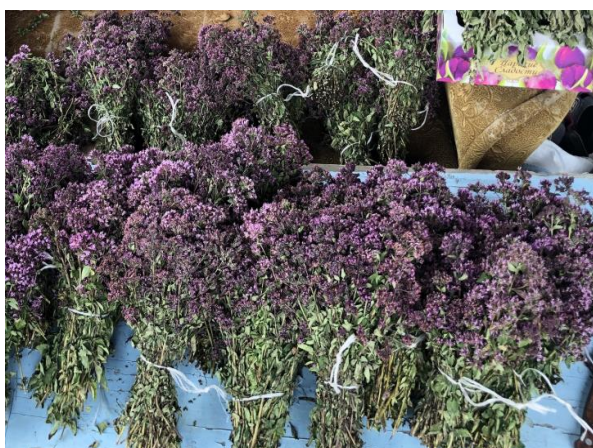
Сушеные лекарственные травы заготовленные лесопользователями для поставки ОсОО ЭкоФлорис