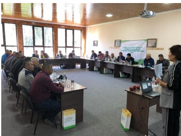
Национальный семинар в Нарынской области