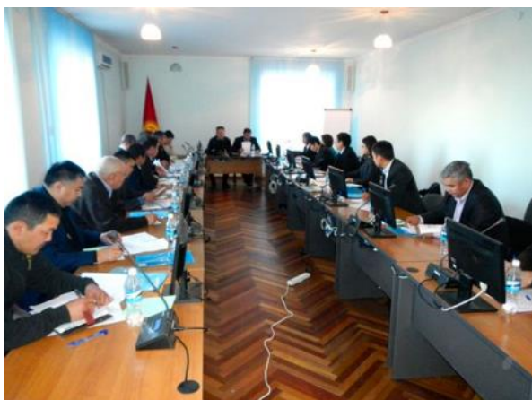
Встречи по подготовке предложений по бизнесу с лесной продукцией (Чуйская область)