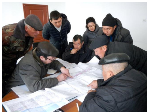
Определение целевых участков для инвестиционных конкурсов совместно с сотрудниками ЛХ