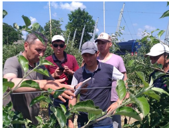
Обучение в третьей стране, Польша (управление садами карликовых яблонь)