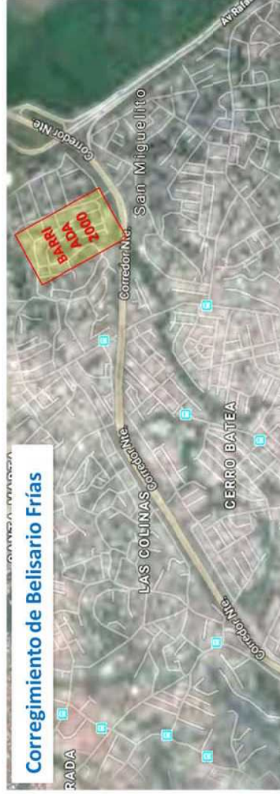
Corregimiento de Belisario Frías