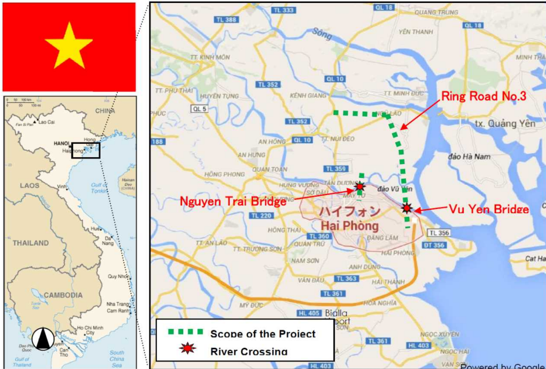
Hình 1.1-1 Vị trí Dự án

Báo cáo Kế hoạch hành động tái định cư này được lập cho Dự án xây dựng cầu Vũ Yên (sau đây gọi tắt là "Dự án"). Vị trí của Dự án được trình bày trong hình 1.1-1.