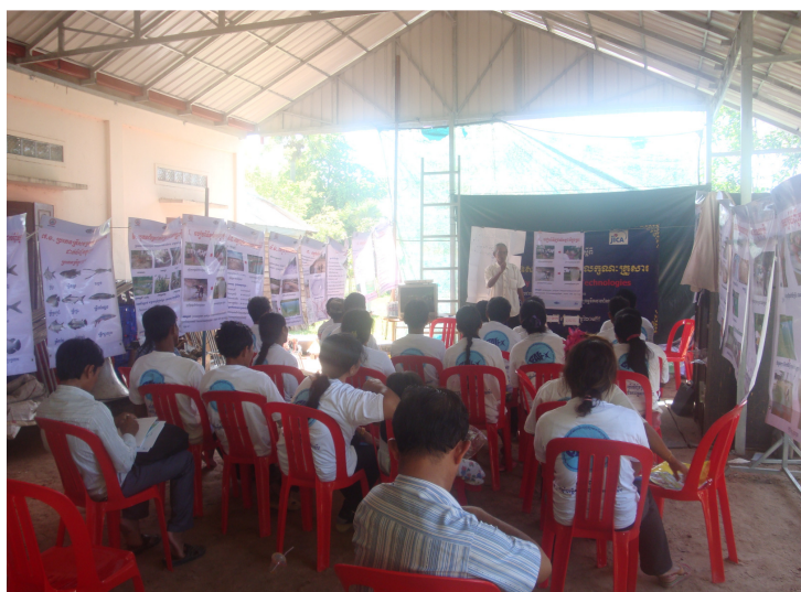
Figure 6. Formation d'pisciculture locaux (pour la production de poissons de taille commerciale) manipulé par un fermier qualifié de base (producteur d'alevins).