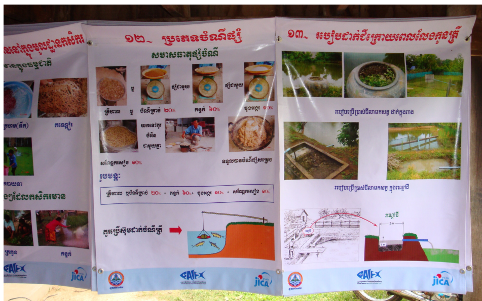
Figure 3. Affiches utilisant le dialecte local (le Khmer) qui sont utilisées pour la formation des fermiers locaux pendant les activités d'vulgarisation d'aquaculture.

humaines et dans la plupart des cas pour l'établissement d'infrastructure et de support technique appropriés. Le gouvernement a également un rôle principal dans le règlement d'autres questions importantes liées à la production d'aquaculture, y compris la santé et la sécurité alimentaire.