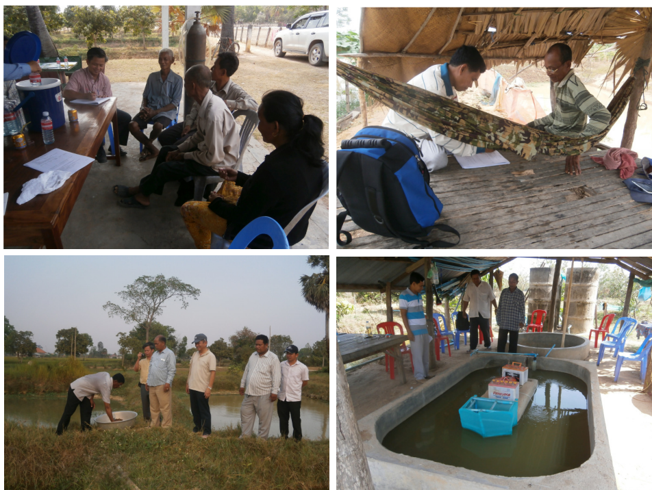
Figure 7. Surveillance et évaluation des PPA et de grossissement sont faites par le groupe (haut à gauche) ou par (à la droite) des entretiens faces à face et des visites régulières de ferme (les photos inférieures).

réponse des fermiers. Les dirigeants d' vulgarisation se concentreront alors sur les réponses des fermiers afin d'identifier les questions réelles concernant leurs activités d'aquaculture et de vie.