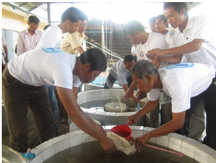
Figure 5. Formation pratique sur les qualifications et les techniques de base pour la production de graine est faite pendant les activités d'vulgarisation.