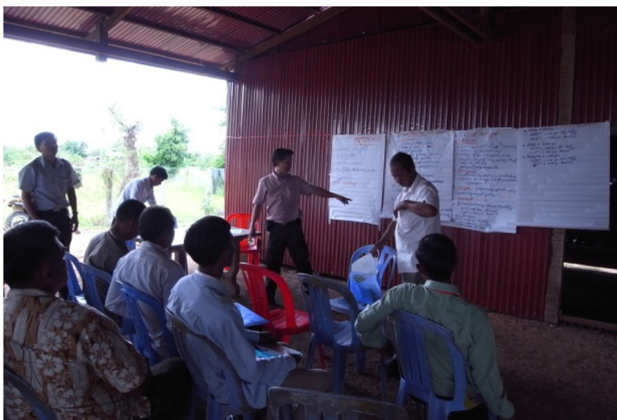
Figure 4. Les agents d' vulgarisation du gouvernement donnent conseil et facilite des fermiers de base en organisant leur groupe de réseau.

Le réseau, une fois établi, devrait également être pleinement approuvé par le représentant gouvernemental local et/ou national qui est responsable de la vulgarisation d'aquaculture. Il devrait élire ses membres du conseil d'administration (par exemple président, vice-président, secrétaire, trésorier) et formuler des règlements simples pour le fonctionnement harmonieux et soutenable du réseau.