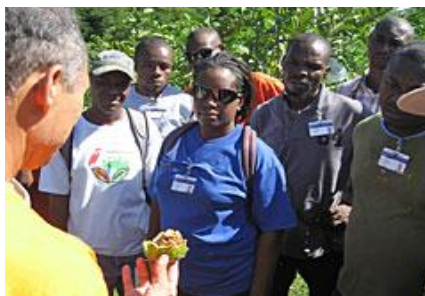
(Photo : formation technique aux stagiaires ayant terminé le programme PROAMOH)

L'Agence envisage d'accroître d'une manière durable et écologique la productivité agricole et d'améliorer le taux d'autosuffisance des couches pauvres ayant subi des catastrophes naturelles et la hausse des prix de denrées alimentaires au cours des dernières années.