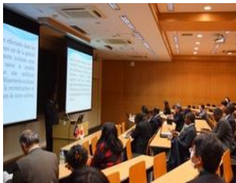
(Photo : Exposé présenté par chaque stagiaire haïtien)

La JICA envisage d'aménager les infrastructures scolaires en milieu rural, d'apporter une coopération technique ainsi que d'organiser des formations afin d'améliorer la qualité de l'enseignement. Pour la formation professionnelle, cette démarche vise également à contribuer à la formation des ressources humaines pour la reconstruction et le développement d'Haïti.