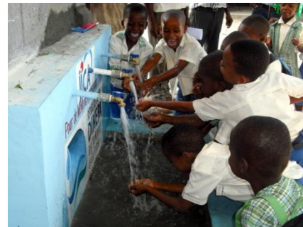
(Photo : Projet de rétablissement du système d'approvisionnement en eau pour la reconstruction de la ville de Léogane)

A la suite des dégâts causés par le grand séisme de 2010, l'hôpital de Jacmel du Département du Sud-Est poursuivait ses activités de soins sous des tentes ou d'autres installations provisoires. Ce projet consiste à construire un bloc central de soins en périnatalité faisant partie du noyau des services dudit hôpital, et à fournir le matériel médical nécessaire. Il vise à améliorer l'état insalubre de traitement et de services de soins de santé afin de mettre en place les services sociaux de base aux alentours de Jacmel. Cette réhabilitation de l'hôpital est réalisée en collaboration avec la Croix-Rouge Canadienne.