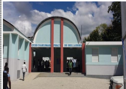
(Photo : Lycée de belladère construit avec les fonds de contrepartie d'aide alimentaire)

Haïti est le pays le moins avancé en matière d'éducation en Amérique latine. A l'occasion du séminaire organisé au Japon, les acteurs concernés par l'éducation d'Haïti ont été invités comme stagiaires à expérimenter et à comprendre l'éducation japonaise pour en faire profiter les activités et les services liés après leur retour au pays. Les stagiaires ont identifié les problèmes et les issues en matière de reconstruction et de développement de l'éducation de leur pays, puis examiné la possibilité de leur mise en valeur, et enfin formulé un plan vis-à-vis de ces thèmes. Dès le retour, chaque stagiaire participe de manière active sur son lieu de travail pour l'éducation dans tout le pays en vue de contribuer à la promotion de la reconstruction et du développement de l'éducation en Haïti.