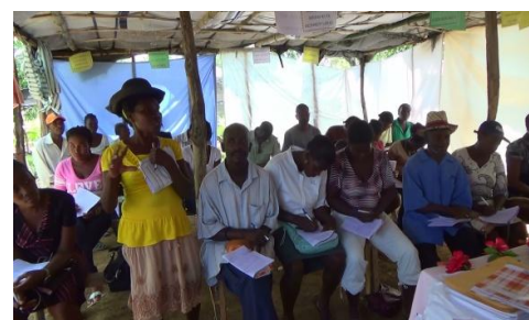
(Photo : Formation du PROAMOH auprès des agriculteurs à petite échelle)

Le PROAMOH a pour le but de réaliser l'acquisition et la mise en pratique des connaissances techniques de l'agriculture durable pour les petits agriculteurs, l'amélioration de la production agricole et de la sécurité alimentaire à travers la mise en place d'un système de vulgarisation et le renforcement des capacités des vulgarisateurs en la matière. Les stagiaires sélectionnés parmi les acteurs des secteurs privé et public qui ont suivi un stage d'environ 5 semaines à l'Université ISA en République Dominicaine, emploient actuellement leurs connaissances et techniques acquises dans leurs activités de vulgarisation en Haïti. Lors de l'EXPO 2012 organisée par la coopération sud-sud, le pays a reçu le « prix de solution » qui récompense la meilleure approche.