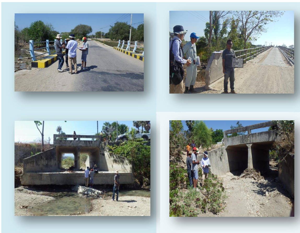
図 3.10.1 橋梁台帳データベース実地訓練調査位置図 Baucau-Com