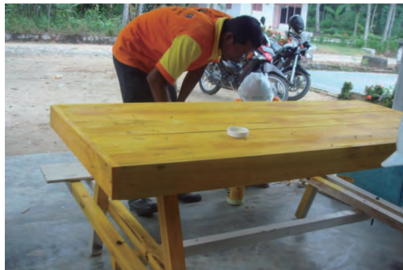
日時：2013年6月28日 場所：Makmur 内容：木材加工