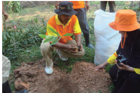
日時：2013年6月25日 場所：Makmur 内容：植林（アカシヤマンギウム）