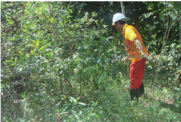
日時：2013年6月25日 場所：Makmur 内容：地ごしらへ（筋刈）