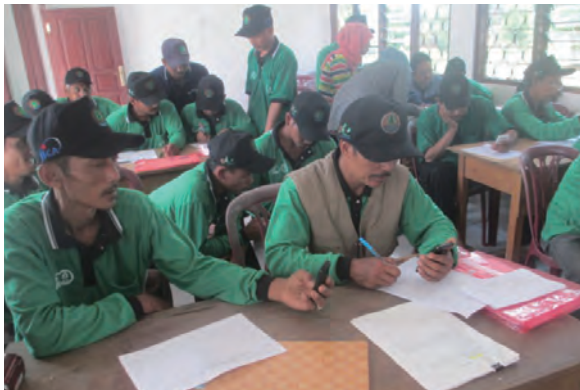
日時：2014年3月29日 場所：GMWT 内容：林班沿革簿への記入