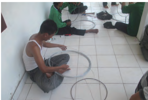
日時：2014年3月29日 場所：GMWT 内容：火たたき棒の作成