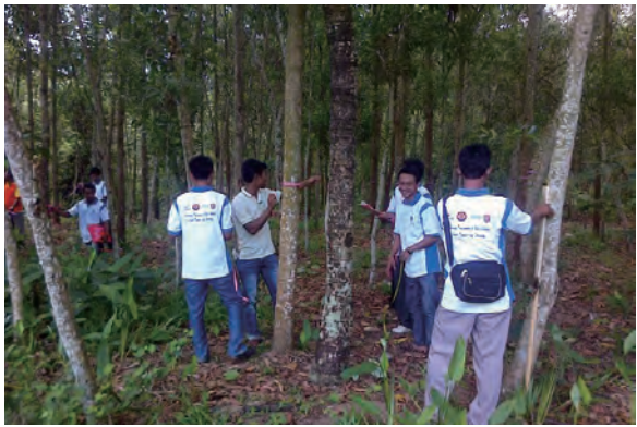
日時：2014年3月22日 場所：Makmur 内容：森林調査（胸高直径を計測）