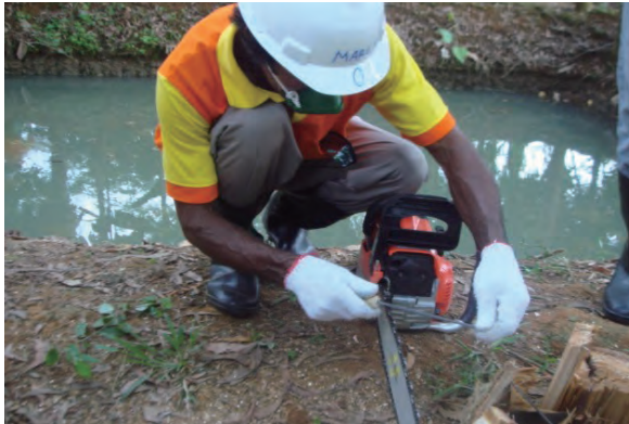
日時：2013年6月26日 場所：Makmur 内容：チェーンソーの目立て