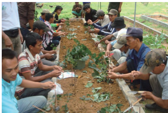
日時：2013年6月17日 場所：GMWT 内容：接ぎ木の实習