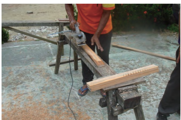
日時：2013年12月21日 場所：Makmur 内容：木材加工