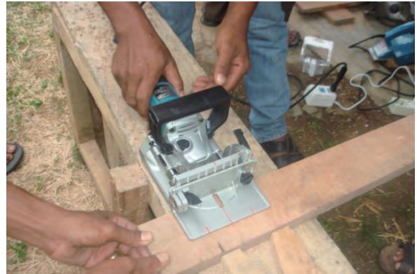
日時：2013年12月15日 場所：GMWT 内容：ジョイントカッターによる穴開け