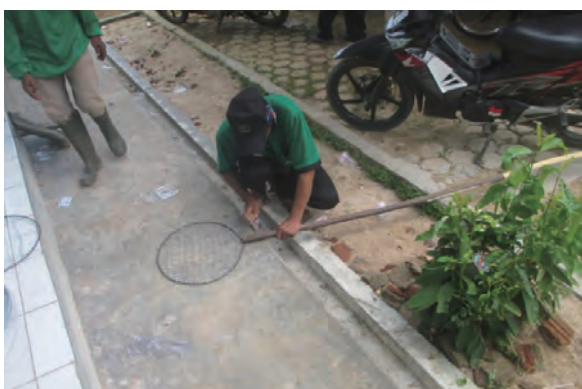
日時：2014年3月29日 場所：GMWT 内容：火たたき棒の作成