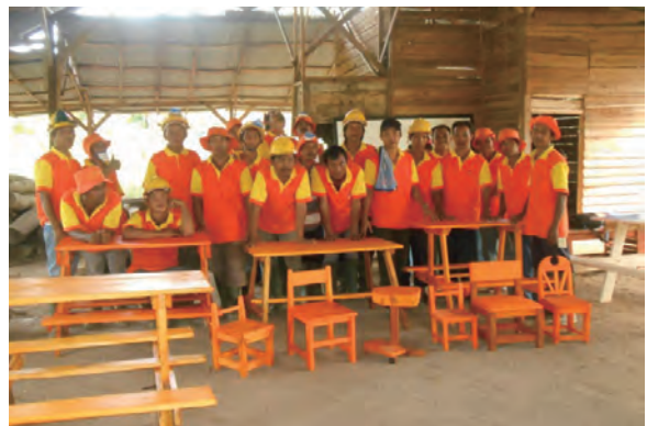
日時：2013年6月21日 場所：GMWT 内容：木材加工