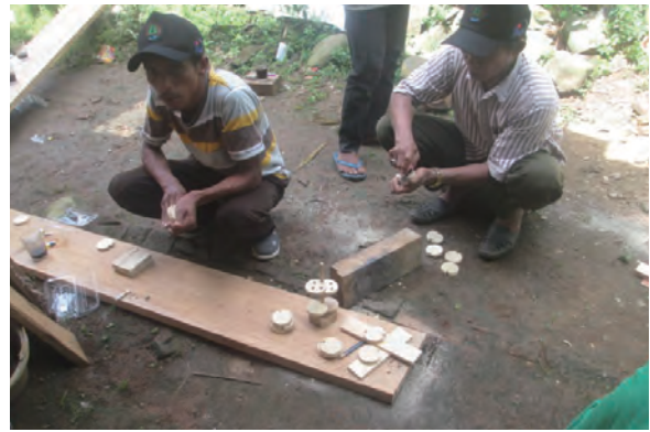
日時：2014年3月31日 場所：GMWT 内容：木材加工