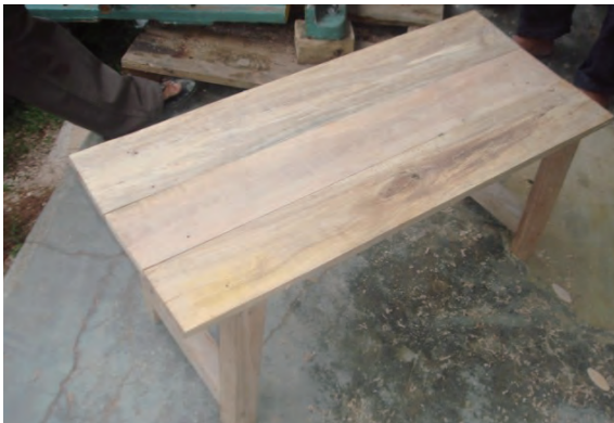
日時：2013年12月15日 場所：GMWT 内容：木材加工