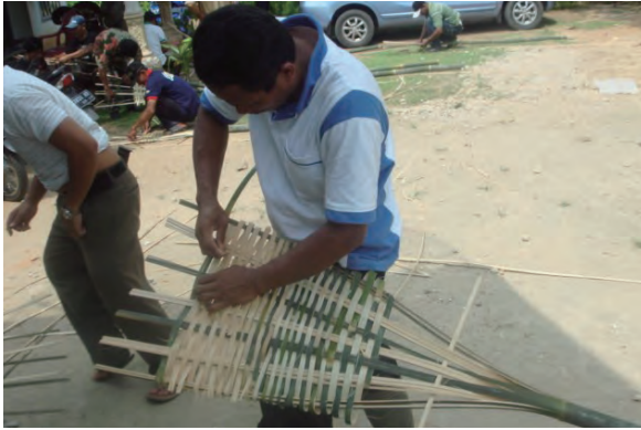
日時：2014年3月23日 場所：Makmur 内容：火たたき竹の作成