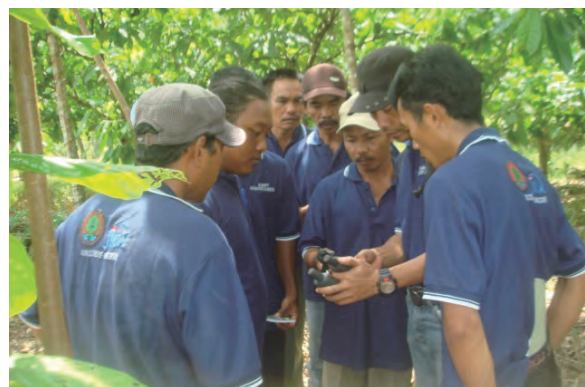
日時：2013年12月14日 場所：GMWT 内容：GPSの使用方法