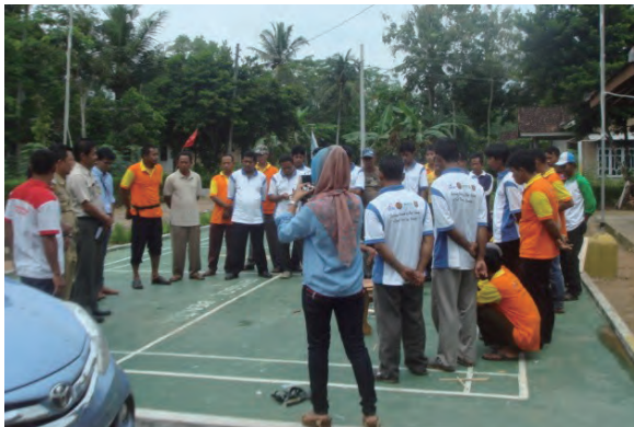
日時：2014年3月26日 場所：Makmur 内容：講評