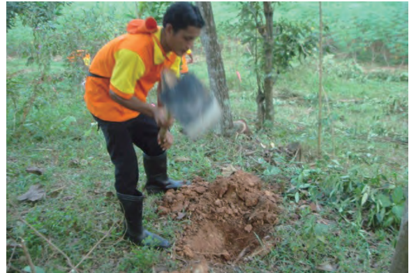
日時：2013年6月25日 場所：Makmur 内容：植林（植穴掘り）