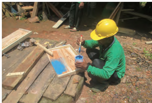
日時：2014年3月30日 場所：GMWT 内容：森林火災防止看板の作成