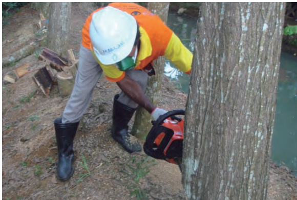
日時：2013年6月26日 場所：Makmur 内容：木材伐採