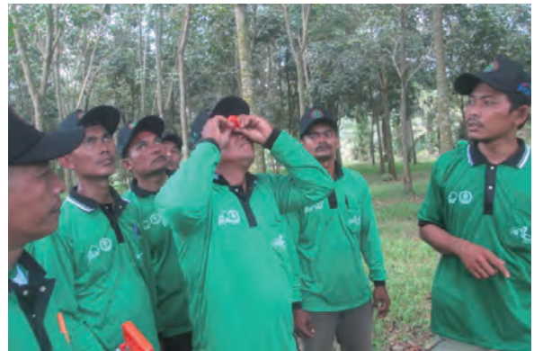
日時：2014年3月28日 場所：GMWT 内容：森林調査（デジタルクリノメーターによる樹高の計測）