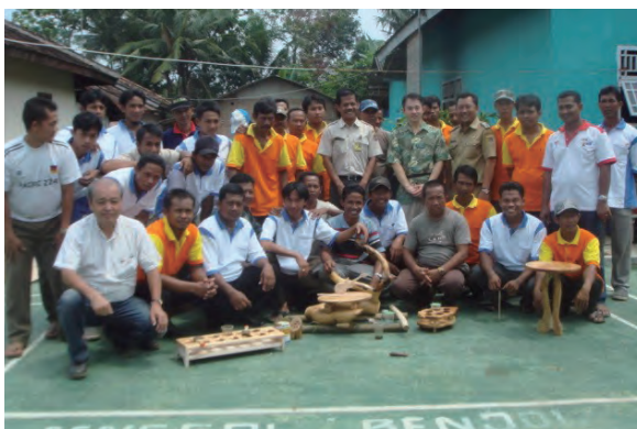
日時：2014年3月26日 場所：Makmur 内容：研修記念