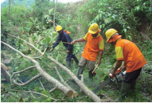
日時：2013年6月19日 場所：GMWT 内容：森林伐採の後の枝払い