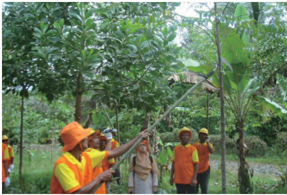
日時：2013年6月18日 場所：GMWT 内容：枝打ち