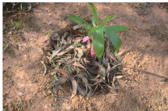
日時：2013年6月25日 場所：Makmur 内容：マルチング