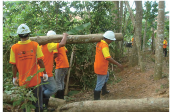
日時：2013年6月26日 場所：Makmur 内容：木材の搬出