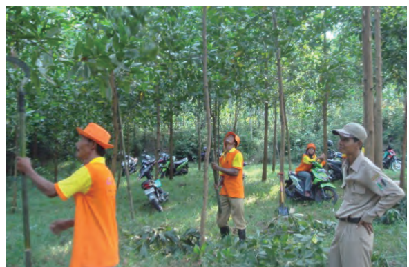
日時：2013年6月27日 場所：Makmur 内容：枝打ち