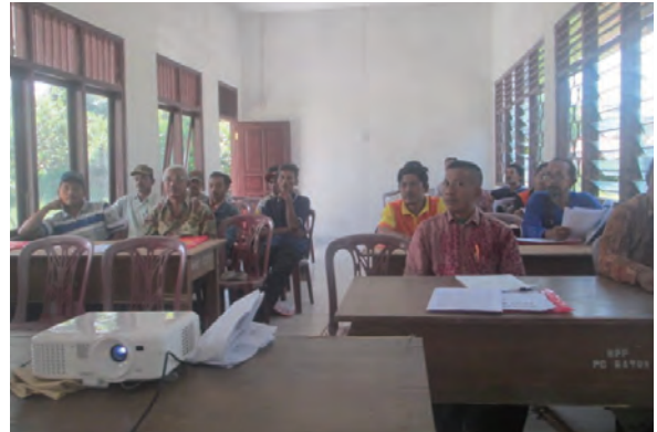
日時：2014年3月28日 場所：GMWT 内容：講義