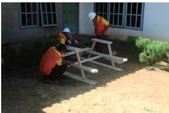
日時：2013年6月28日 場所：Makmur 内容：木材加工