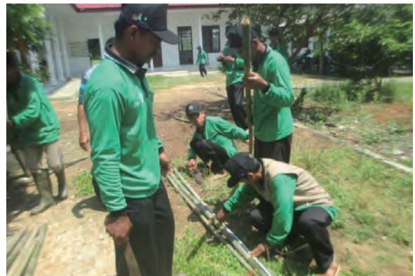
日時：2014年3月29日 場所：GMWT 内容：火たたき竹の作成