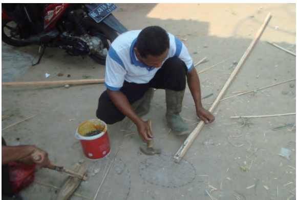
日時：2014年3月23日 場所：Makmur 内容：火たたき棒の作成