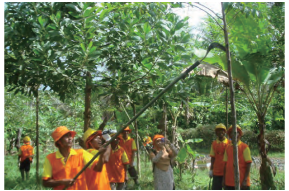
日時：2013年6月18日 場所：GMWT 内容：枝打ち