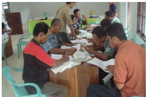
日時：2014年3月22日 場所：Makmur 内容：森林調査結果を林班沿革簿に記入