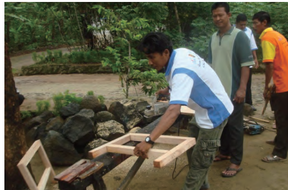
日時：2014年3月26日 場所：Makmur 内容：木材加工