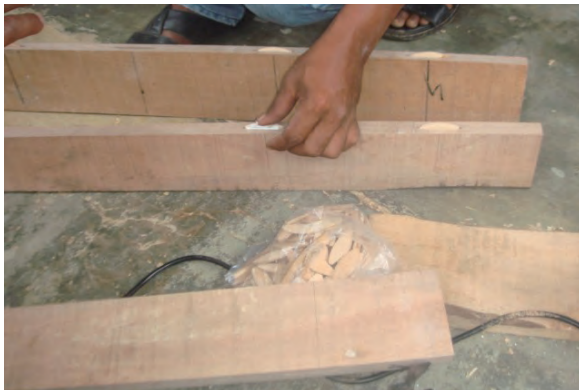
日時：2013年12月15日 場所：GMWT 内容：木工ボンドで木と木を繋ぐ)