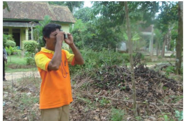
日時：2013年12月20日 場所：Makmur 内容：森林調査（樹高の計測）