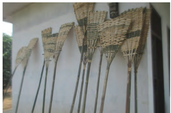
日時：2014年3月29日 場所：GMWT 内容：火たたき竹