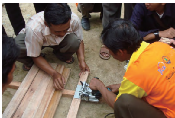
日時：2013年12月21日 場所：Makmur 内容：ジョイントカッターによる穴開け