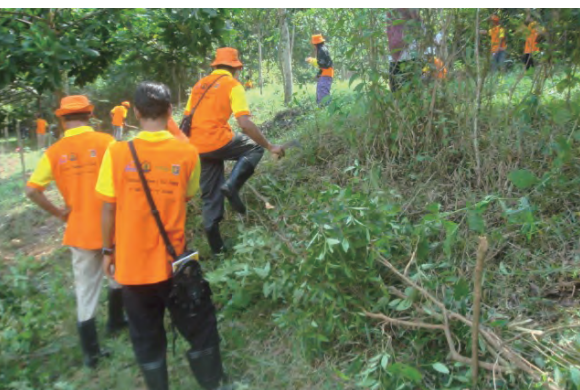
日時：2013年6月25日 場所：Makmur 内容：地ごしらへ（筋刈）