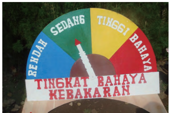
日時：2014年3月24日 場所：Makmur 内容：