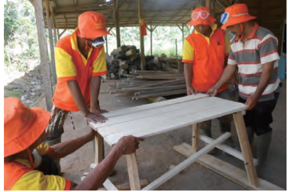
日時：2013年6月20日 場所：GMWT 内容：木材加工