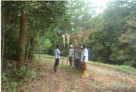
日時：2014年3月25日 場所：Makmur 内容：森林火災防止訓練