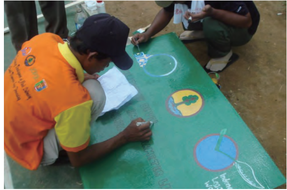
日時：2014年3月24日 場所：Makmur 内容：森林火災防止看板の作成