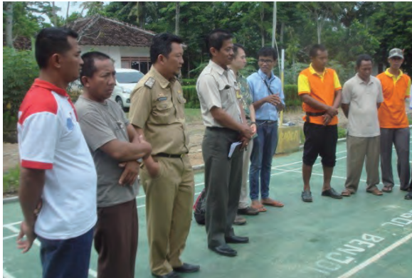
日時：2014年3月26日 場所：Makmur 内容：講評