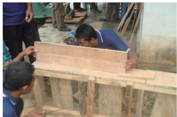
日時：2013年12月15日 場所：GMWT 内容：小径木のつなぎ