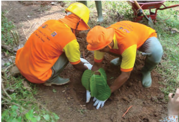
日時：2013年6月18日 場所：GMWT 内容：植林