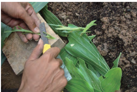
日時：2013年6月24日 場所：Makmur 内容：挿し木の挿穂づくり