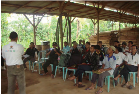
日時：2013年6月17日 場所：GMWT 内容：講義