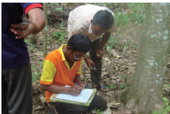
日時：2013年12月24日 場所：Makmur 内容：森林調査（野帳への記入）