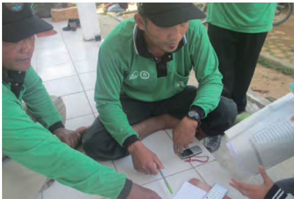
日時：2014年3月28日 場所：GMWT 内容：森林調査（野帳のまとめ）