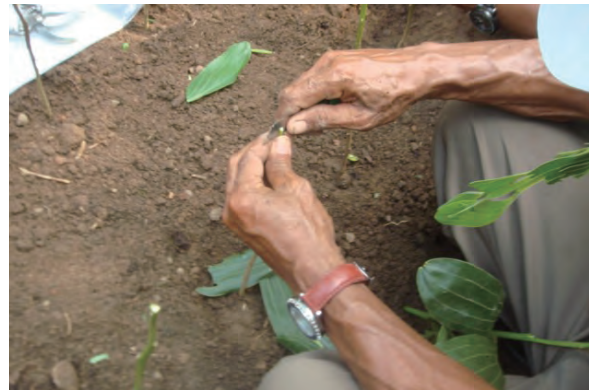
日時：2013年6月24日 場所：Makmur 内容：接ぎ木の實習