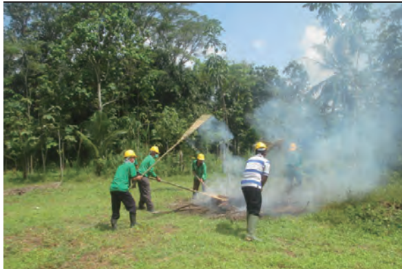
日時：2014年3月30日 場所：GMWT 内容：森林火災防止訓練