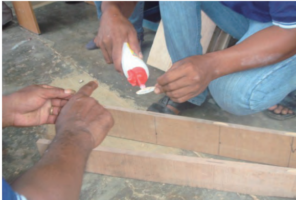
日時：2013年12月15日 場所：GMWT 内容：木工ボンドで木と木を繋ぐ)