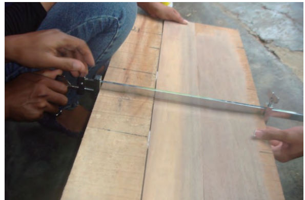
日時：2013年12月15日 場所：GMWT 内容：木材加工