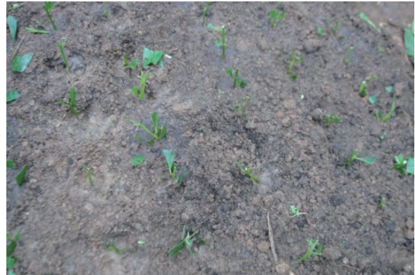
日時：2013年6月24日 場所：Makmur 内容：挿し木の實習