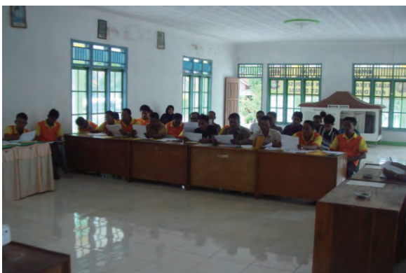
日時：2013年12月20日 場所：Makmur 内容：講義