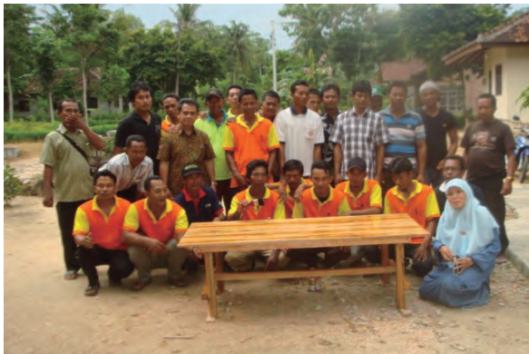
日時：2013年12月21日 場所：GMWT 内容：木材加工