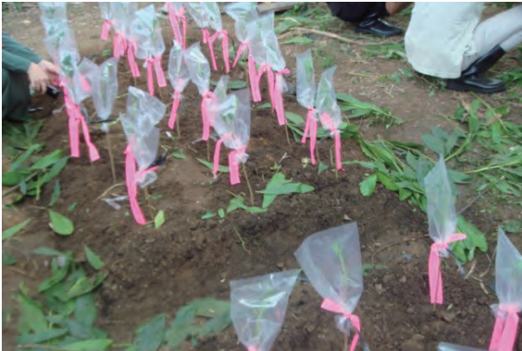
日時：2013年6月24日 場所：Makmur 内容：接ぎ木の実習