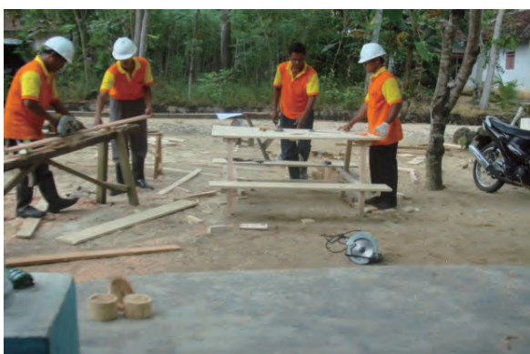
日時：2013年6月28日 場所：Makmur 内容：木材加工