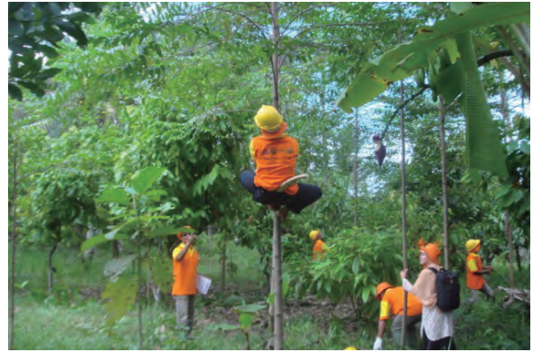
日時：2013年6月18日 場所：GMWT 内容：枝打ち