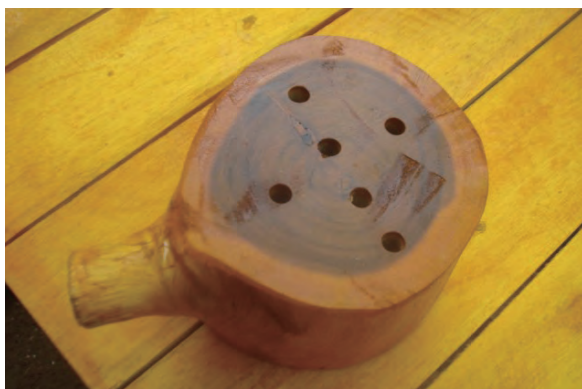
日時：2013年6月28日 場所：Makmur 内容：鉛筆立て