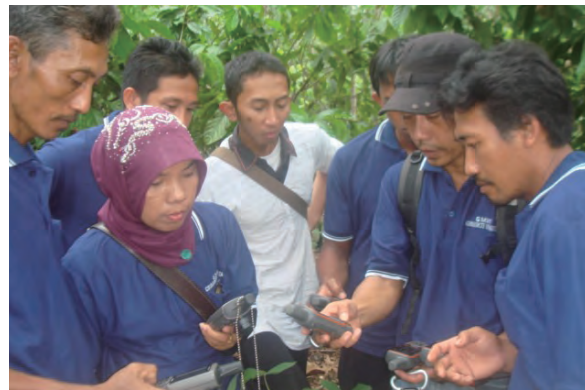
日時：2013年12月14日 場所：GMWT 内容：GPSの使用方法