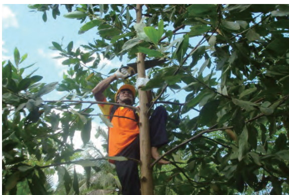
日時：2013年6月18日 場所：GMWT 内容：枝打ち