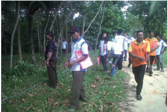
日時：2014年3月22日 場所：Makmur 内容：森林調査