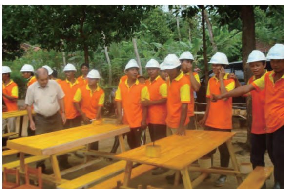
日時：2013年6月28日 場所：Makmur 内容：木材加工