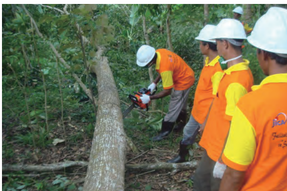
日時：2013年6月26日 場所：GMWT 内容：伐採木の枝払い