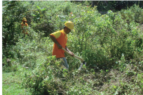
日時：2013年6月18日 場所：GMWT 内容：地ごしらへの実習（坪刈）