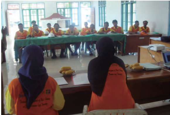
日時：2013年6月24日 場所：Makmur 内容：講義