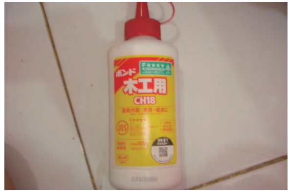
日時：2013年12月15日 場所：GMWT 内容：木工ボンド