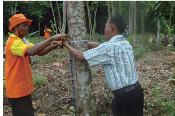
日時：2013年12月20日 場所：Makmur 内容：森林調査（胸高直径の計測）