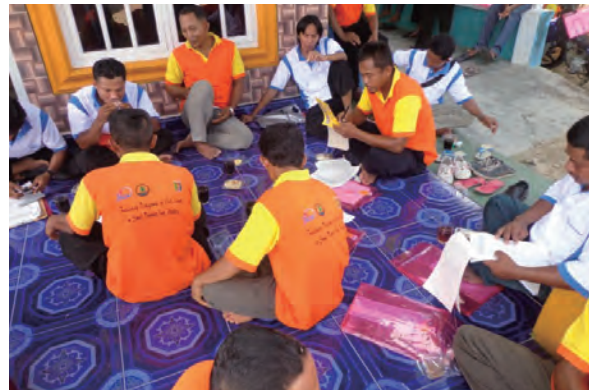
日時：2014年3月22日 場所：Makmur 内容：森林調査（野帳の取りまとめ）