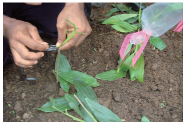
日時：2013年6月24日 場所：Makmur 内容：接ぎ木の實習