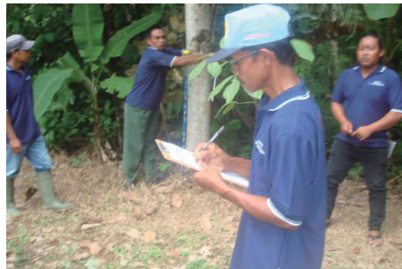
日時：2013年12月14日 場所：GMWT 内容：森林調査（計測結果を野帳に記入）