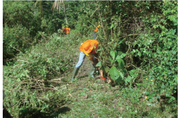
日時：2013年6月18日 場所：GMWT 内容：地ごしらへの実習（筋刈）