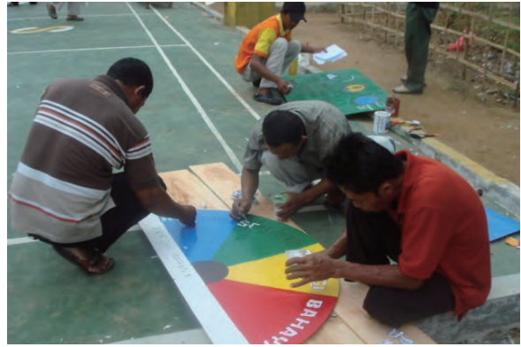
日時：2014年3月24日 場所：Makmur 内容：森林火災防止看板の作成