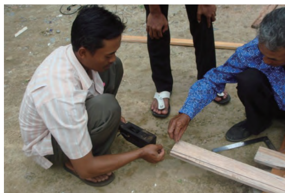
日時：2013年12月21日 場所：Makmur 内容：木材加工