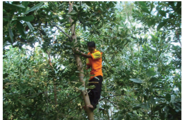
日時：2013年6月27日 場所：Makmur 内容：枝打ち