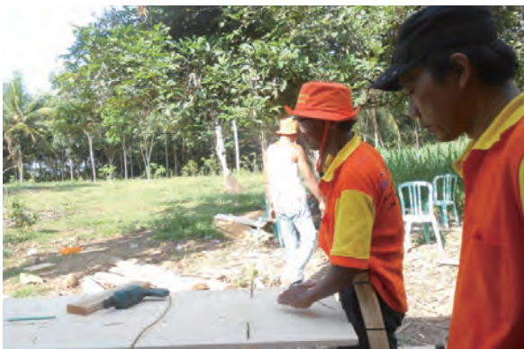
日時：2013年6月20日 場所：GMWT 内容：木材加工