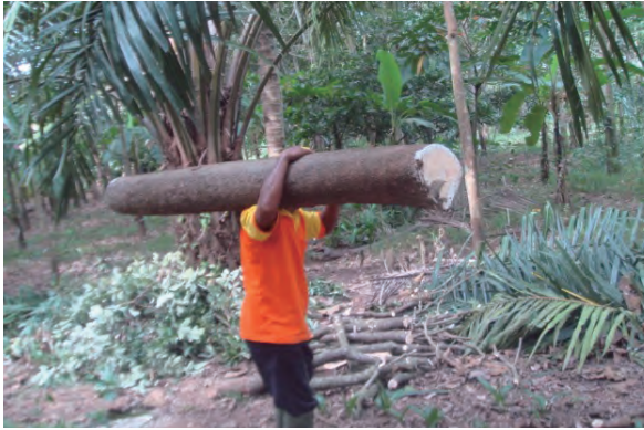
日時：2013年6月19日 場所：GMWT 内容：木材の運び出し