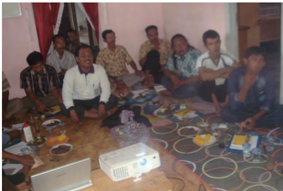
日時：2013年12月14日 場所：GMWT 内容：講義