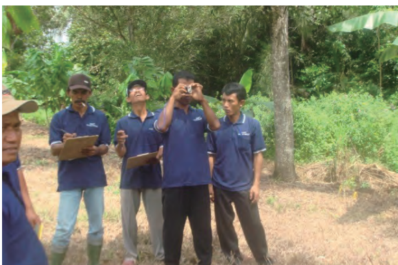
日時：2013年12月14日 場所：GMWT 内容：森林調査（樹高を計測）