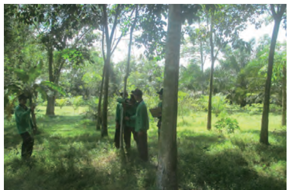
日時：2014年3月28日 場所：GMWT 内容：森林調査（直径巻尺による胸高直径の計測）