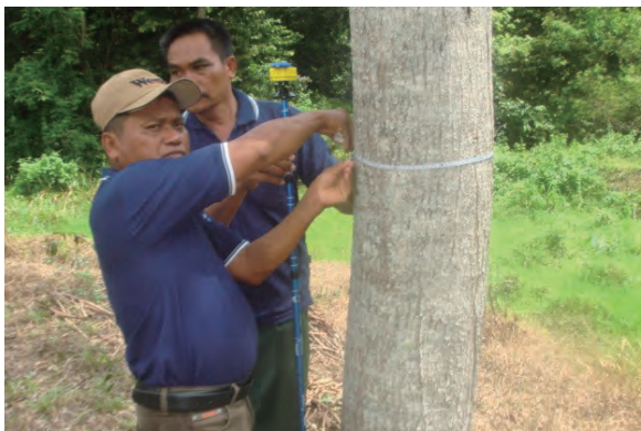
日時：2013年12月14日 場所：GMWT 内容：森林調査（胸高直径の計測）