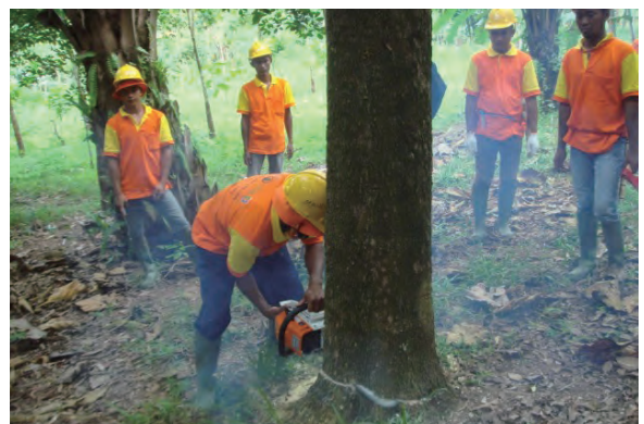
日時：2013年6月19日 場所：GMWT 内容：森林伐採