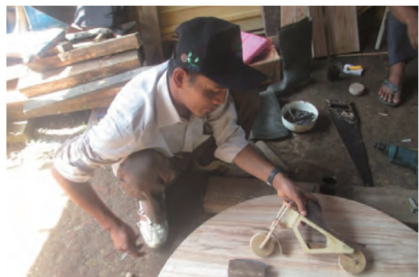
日時：2014年3月31日 場所：GMWT 内容：木材加工