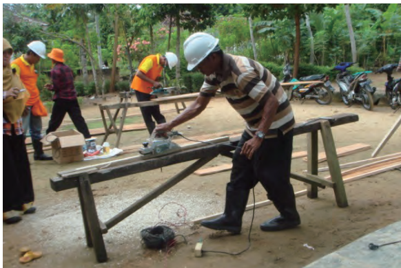
日時：2013年6月27日 場所：Makmur 内容：木材加工