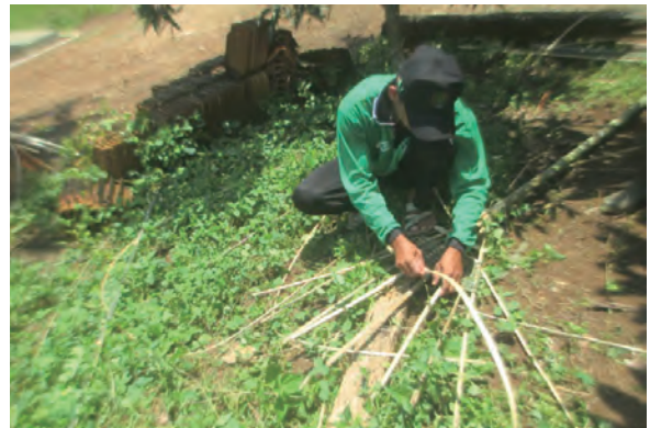
日時：2014年3月29日 場所：GMWT 内容：火たたき竹の作成