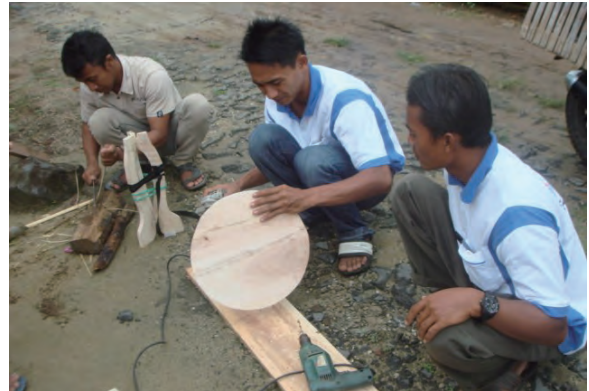
日時：2014年3月26日 場所：Makmur 内容：木工品作成