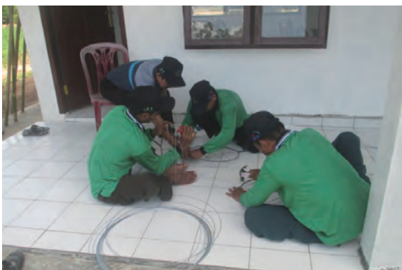
日時：2014年3月29日 場所：GMWT 内容：火たたき棒の作成