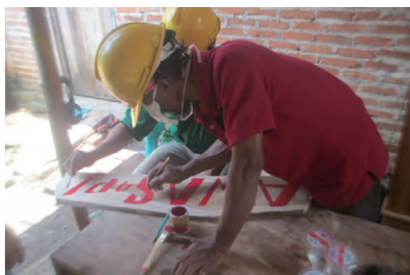
日時：2014年3月30日 場所：GMWT 内容：森林火災防止看板の作成