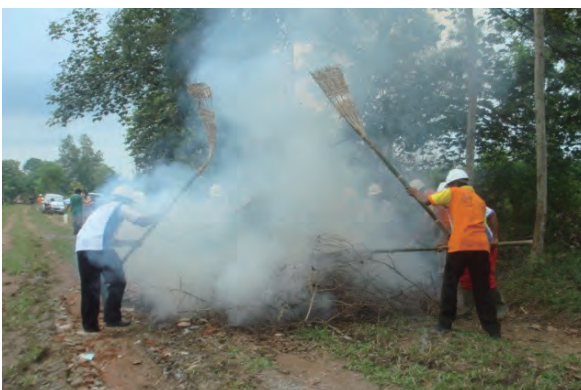
日時：2014年3月25日 場所：Makmur 内容：森林火災防止訓練