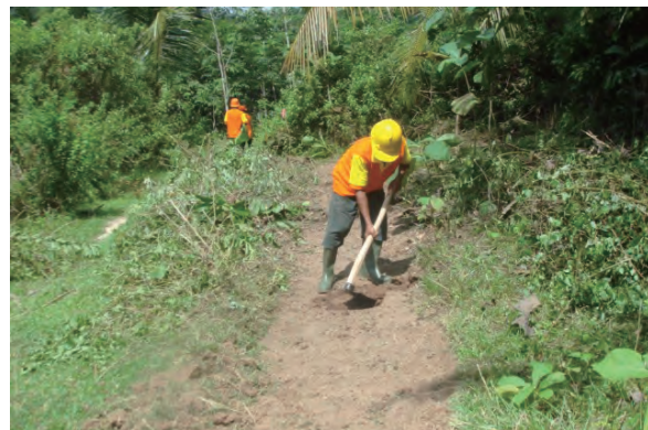
日時：2013年6月18日 場所：GMWT 内容：地ごしらへの実習（筋刈）