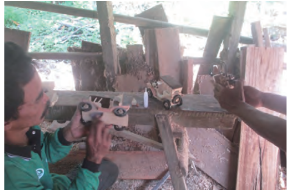
日時：2014年3月31日 場所：GMWT 内容：木材加工