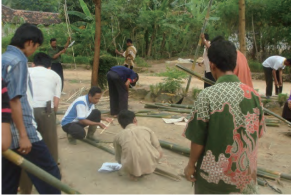
日時：2014年3月23日 場所：Makmur 内容：火たたき竹の作成