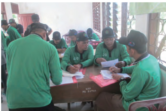
日時：2013年3月29日 場所：GMWT 内容：林班沿革簿への記入