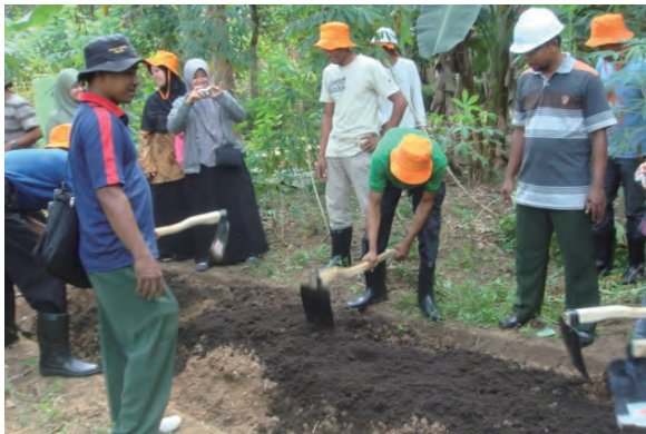
日時：2013年6月24日 場所：Makmur 内容：苗圃の作成の實習