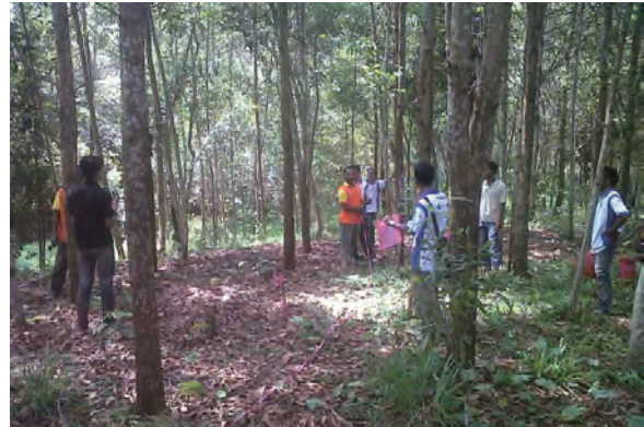
日時：2014年3月22日 場所：Makmur 内容：森林調査（直径巻尺による胸高直径測定）