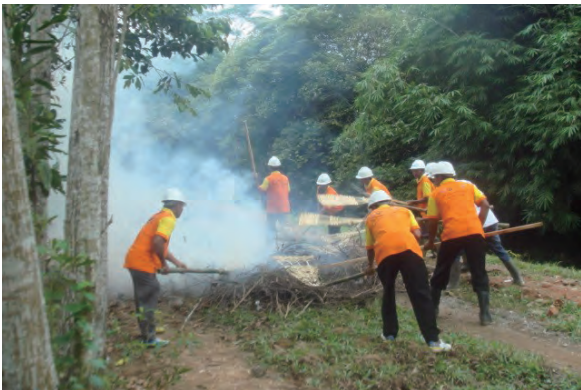
日時：2014年3月25日 場所：Makmur 内容：森林火災防止訓練