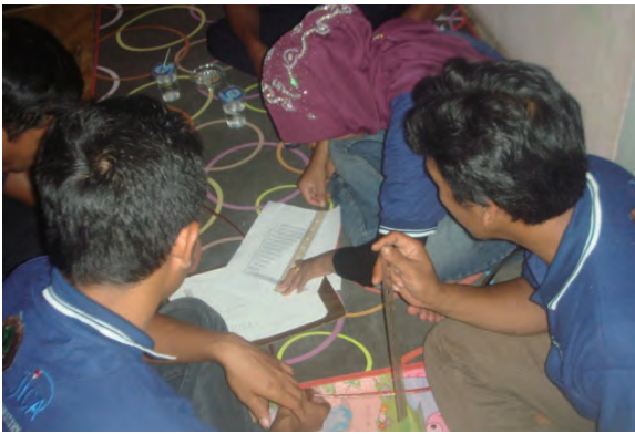
日時：2013年6月14日 場所：GMWT 内容：森林調査（野帳の整理）