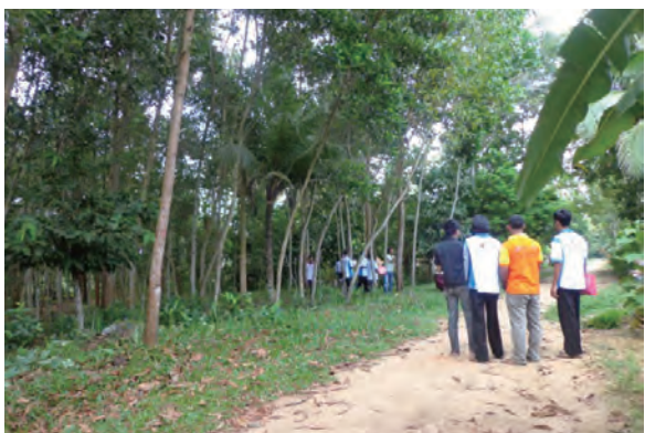
日時：2014年3月22日 場所：Makmur 内容：GPSによる面積測定