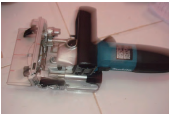
日時：2013年6月15日 場所：GMWT 内容：ジョイントカッター