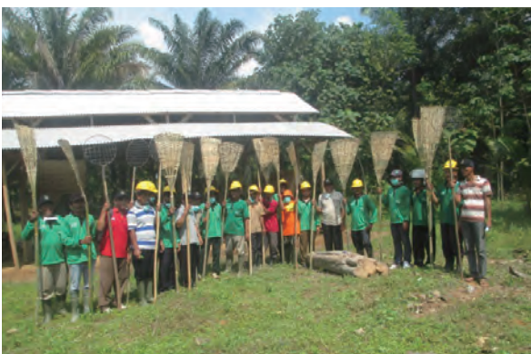
日時：2014年3月30日 場所：GMWT 内容：森林火災防止訓練