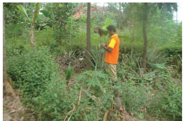
日時：2013年12月24日 場所：Makmur 内容：森林調査（野帳への記入）