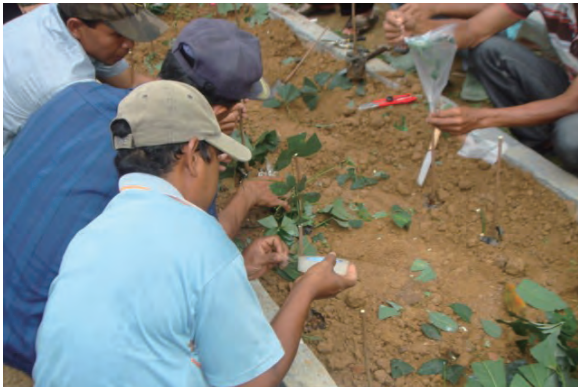
日時：2013年6月17日 場所：GMWT 内容：挿し木の实習