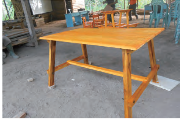
日時：2013年6月21日 場所：GMWT 内容：木材加工