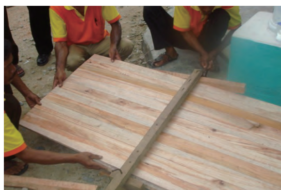
日時：2013年12月21日 場所：Makmur 内容：木材加工（小径木のつなぎ）