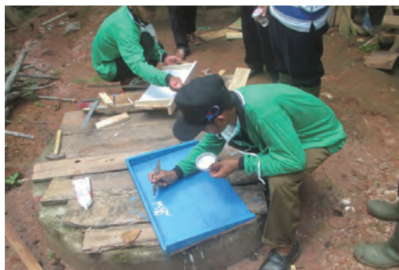
日時：2014年3月30日 場所：GMWT 内容：森林火災防止看板の作成