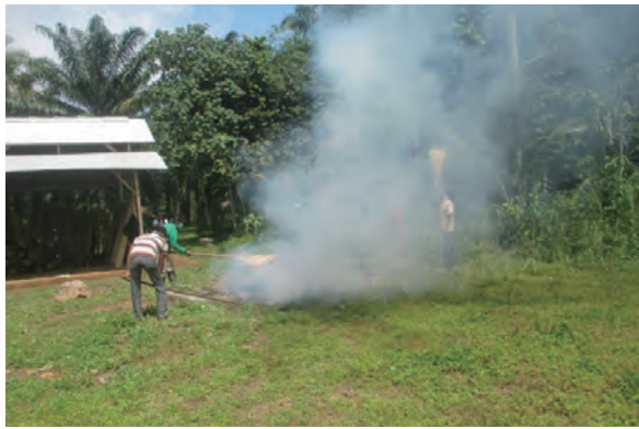
日時：2014年3月30日 場所：GMWT 内容：森林火災防止訓練