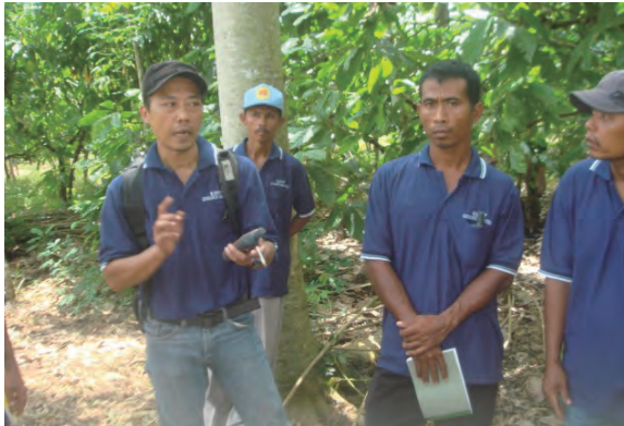
日時：2013年12月14日 場所：GMWT 内容：GPSの使用方法