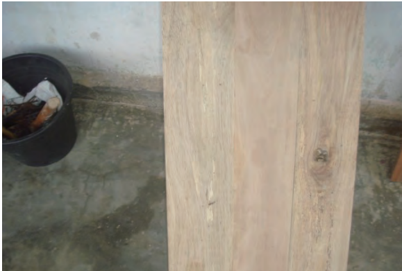
日時：2013年12月15日 場所：GMWT 内容：木材加工