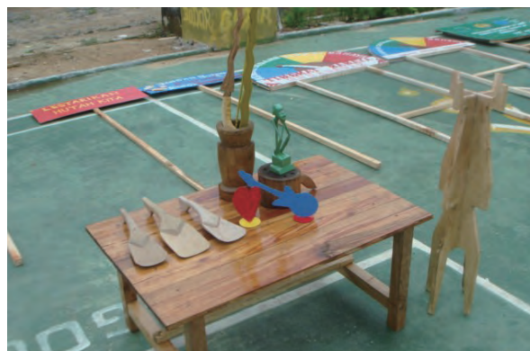
日時：2014年3月26日 場所：Makmur 内容：木材加工