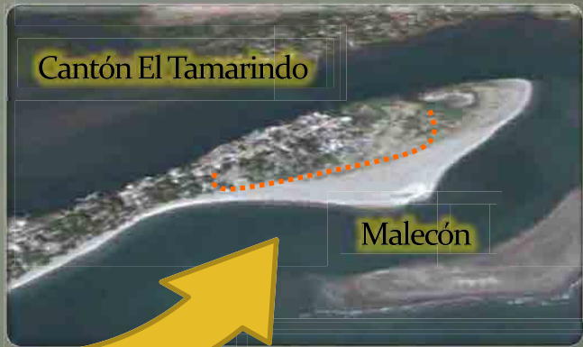
Cantón El Tamarindo

El proyecto se desarrollara en la Playa El Tamarindo, ubicada en la zona costera al sur-este del Golfo de Fonseca de El Salvador, departamento de La Unión, a 190 km de la capital, sobre la carretera El Litoral.