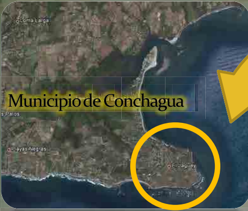
Municipio de Conchagua