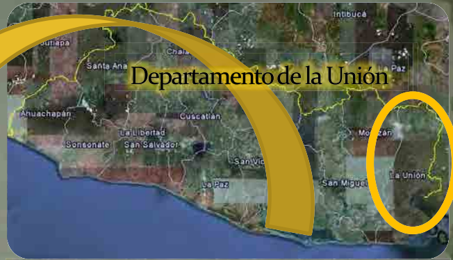
Departamento de la Unión

El proyecto se desarrollara en la Playa El Tamarindo, ubicada en la zona costera al sur-este del Golfo de Fonseca de El Salvador, departamento de La Unión, a 190 km de la capital, sobre la carretera El Litoral.