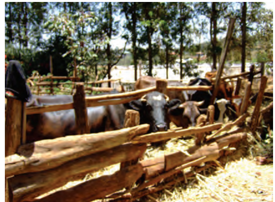
視察した農家②（ンゴング）（家畜舎（ウシ）） 〔ケニア〕