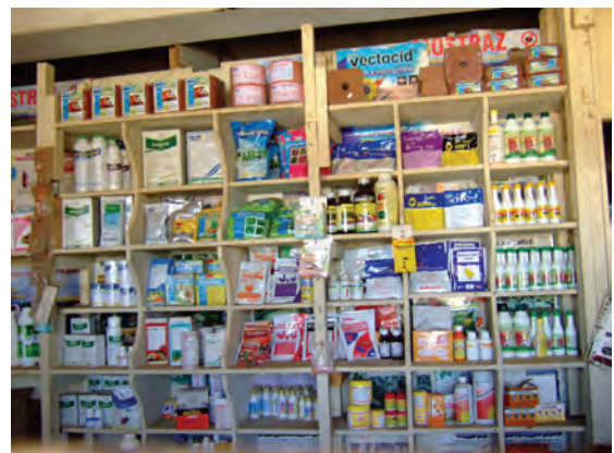
ンゴングの農業資材店〔ケニア〕