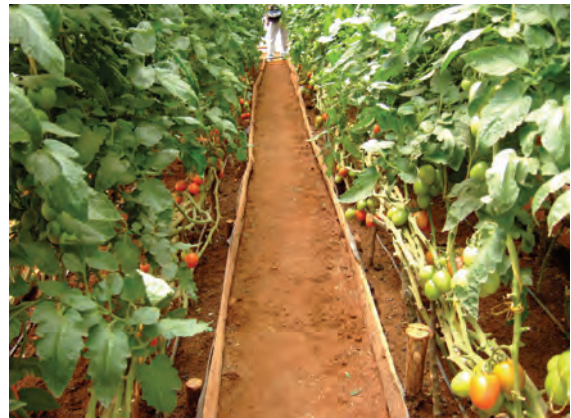
ンゴング農業研修センター （ビニルハウス内部）〔ケニア〕