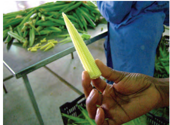
園芸作物開発公社の内部 （輸出用ヤングコーン）〔ケニア〕