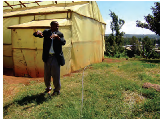
ンゴング農業研修センター （ビニルハウスと帰国研修員）〔ケニア〕