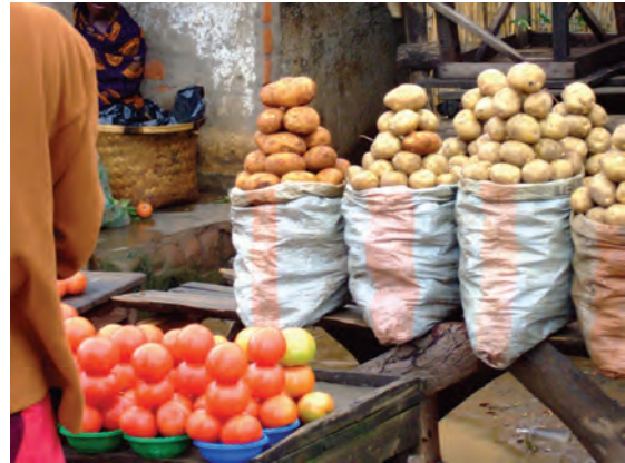
道端のマーケット〔マラウイ〕