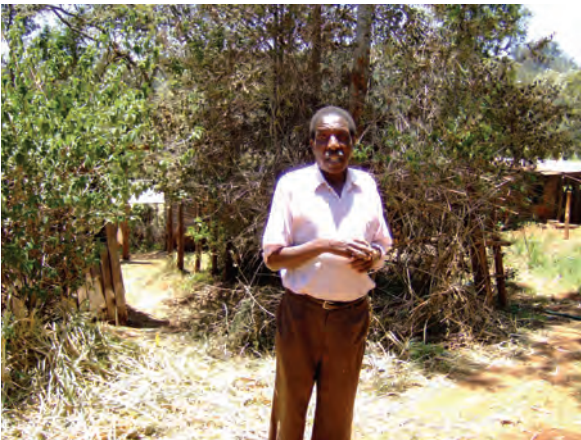
視察した農家②（ンゴング）〔ケニア〕