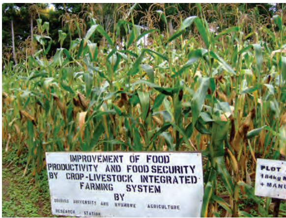
「耕畜連携システムによる食料生産性向上」プロジェクト（帯広畜産大学/JICA）のブンブエ試験場の展示圃場〔マラウイ〕