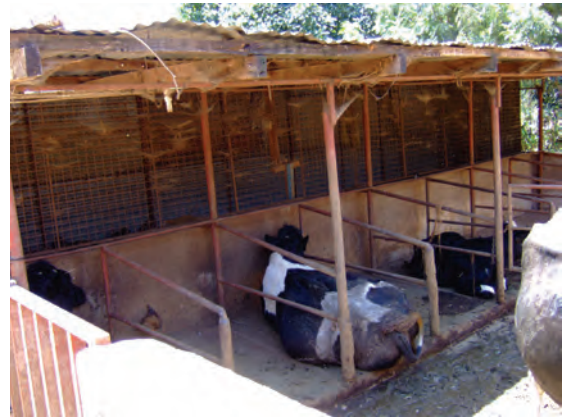
視察した農家①（ンゴング）〔家畜舎（ウシ）〕 〔ケニア〕