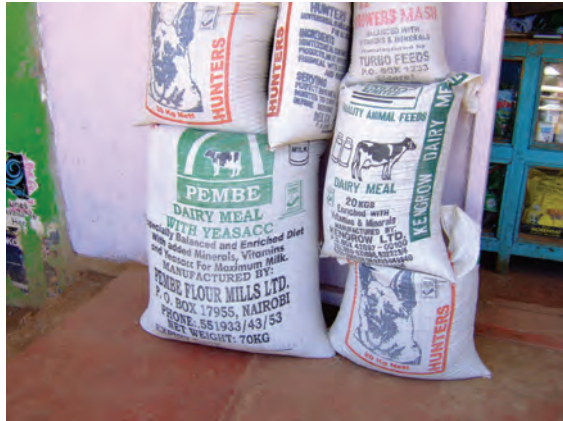
ンゴングの農業資材店〔ケニア〕