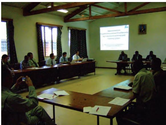
「耕畜連携システムによる食料生産性向上」プロジェクト（帯広畜産大学/JICA）のステアリング・コミットィの様子〔マラウイ〕