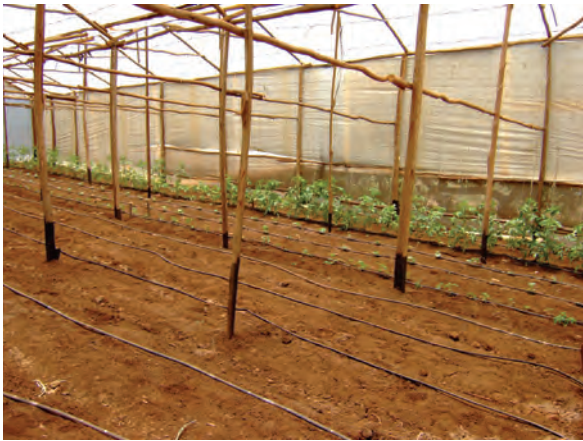
視察した農家②（ンゴング）（ビニルハウス） 〔ケニア〕