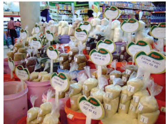
ナイロビ（ケニア）のスーパーマーケットの 穀物売場