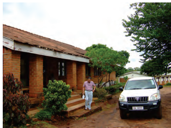
ブランタイヤの普及所〔マラウイ〕