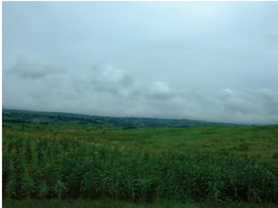
一面のトウモロコシ（メイズ）〔マラウイ〕