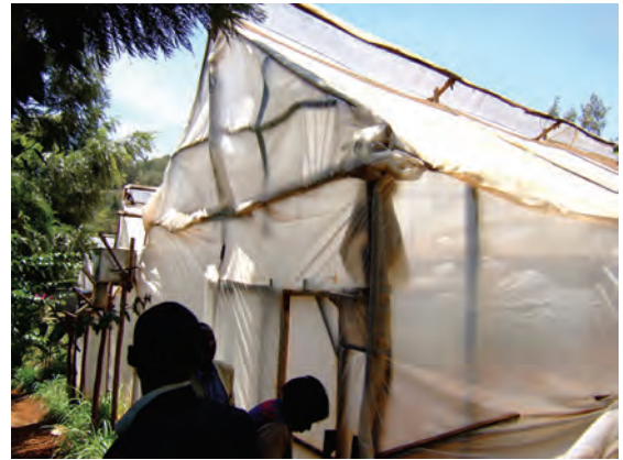
視察した農家①（ンゴング）（ビニルハウス） 〔ケニア〕