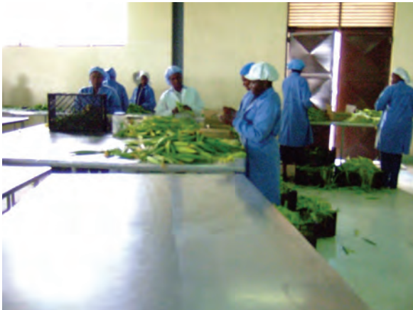
園芸作物開発公社の内部（選定の様子）〔ケニア〕