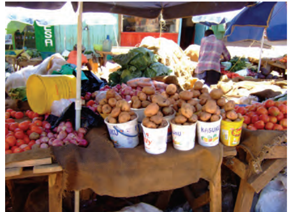
ンゴングの青空マーケット〔ケニア〕