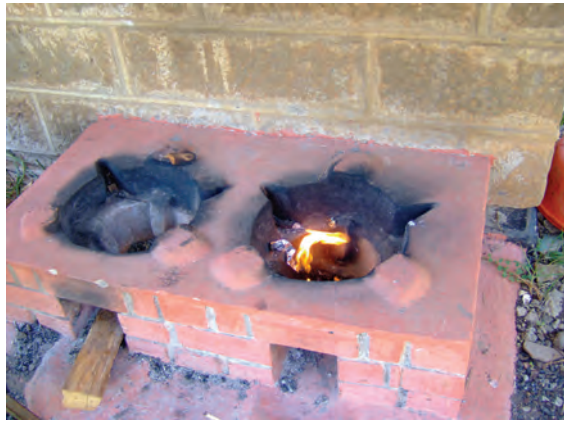
ンゴング農業研修センター（改良かまど） 〔ケニア〕