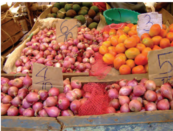
ンゴングの青空マーケット （タマネギの大きさによって値段が異なる） 〔ケニア〕