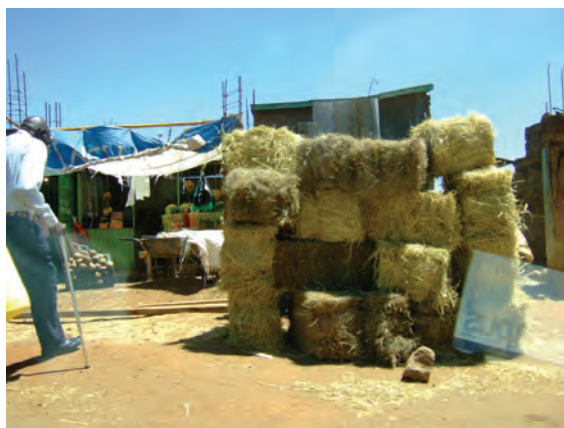
ンゴングの市場の家畜飼料〔ケニア〕