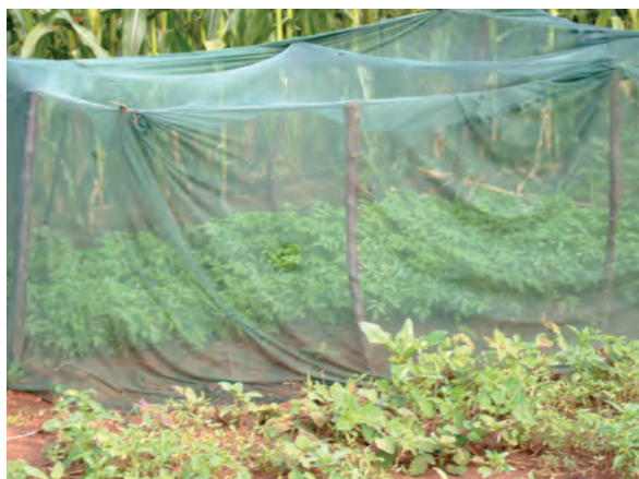
サリマ郡農業事務所（育苗）〔マラウイ〕