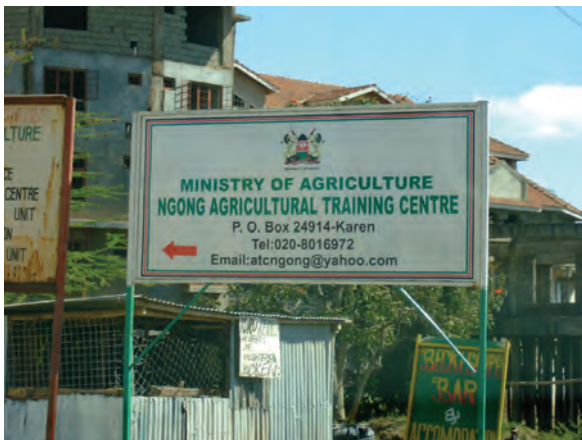
ンゴング農業研修センター入口〔ケニア〕