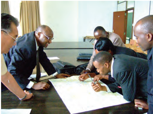
JICA ケニア事務所会議室にて、 帰国研修員ヘインタビュー