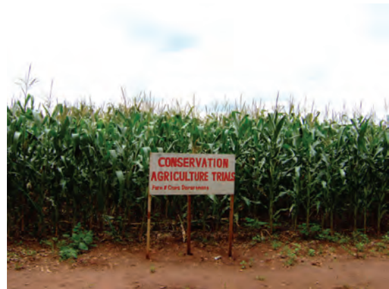
自然資源短期大学での帰国研修員の取り組み (品種の比較)〔マラウイ〕