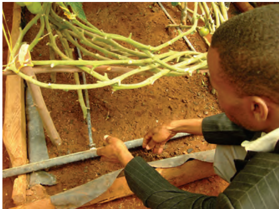
ンゴング農業研修センター（ビニルハウス内部） 〔ケニア〕