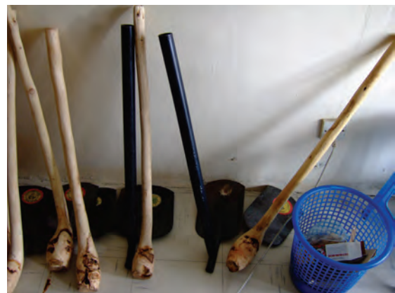
マラウイの農具〔マラウイ〕