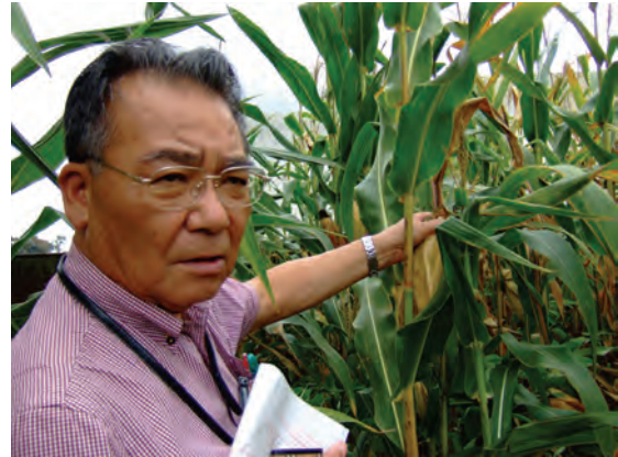
普及所内の展示圃場〔マラウイ〕