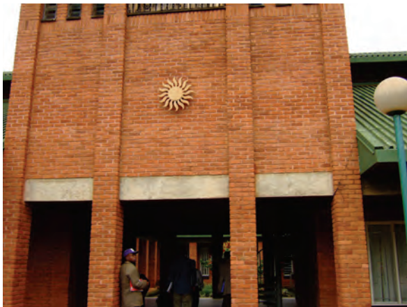
自然資源短期大学 (リロングウェ) 〔マラウイ〕