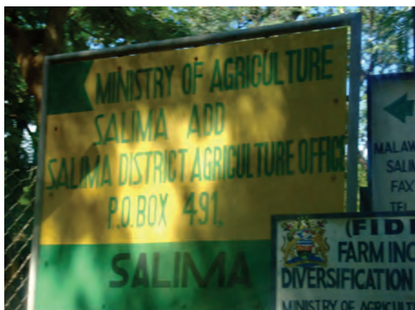
サリマ郡農業事務所（帰国研修員配属先） 〔マラウイ〕