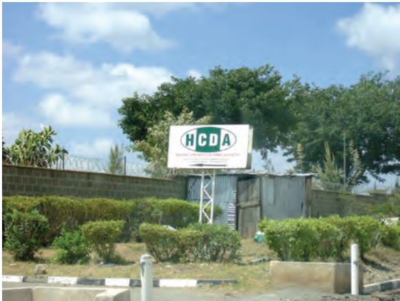
園芸作物開発公社の外観〔ケニア〕