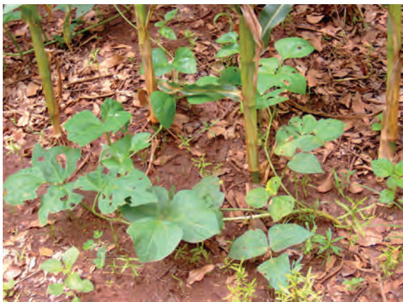
自然資源短期大学での帰国研修員の取り組み (メイズとマメの混作試験)〔マラウイ〕