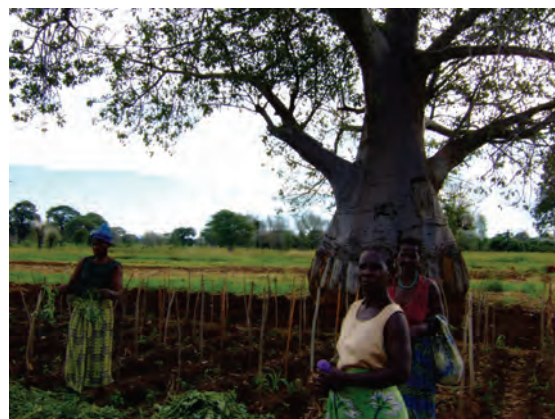
サリマ郡農業事務所（圃場）〔マラウイ〕