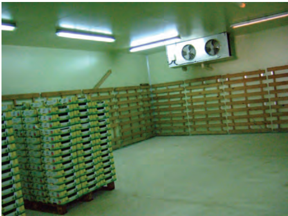
園芸作物開発公社の冷蔵倉庫〔ケニア〕