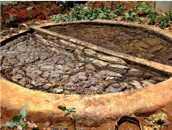
視察した農家①（ンゴング）（バイオガス） 〔ケニア〕