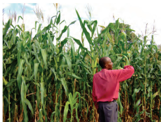
サリマ郡農業事務所の試験圃場における 品種比較の展示〔マラウイ〕