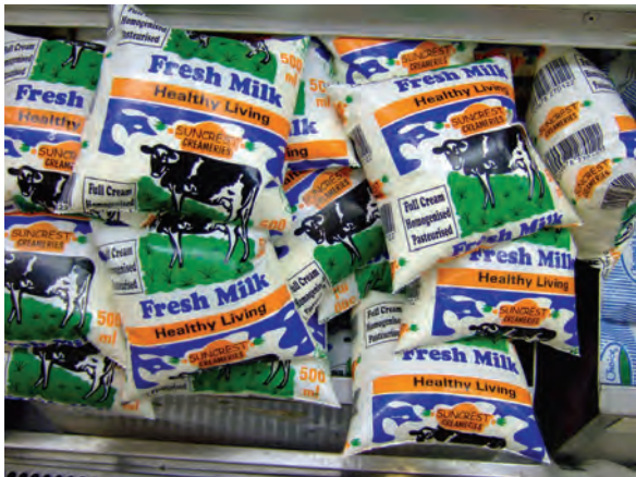
ブランタイヤのスーパーマーケット冷蔵庫 (生乳)〔マラウイ〕