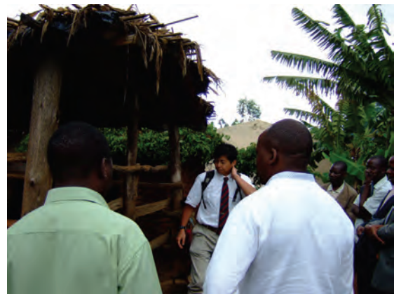
「耕畜連携システムによる食料生産性向上」プロジェクト（帯広畜産大学/JICA）の篤農家の展示圃場〔マラウイ〕