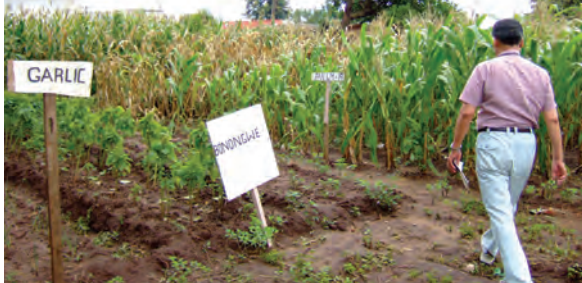
普及所内の展示圃場〔マラウイ〕