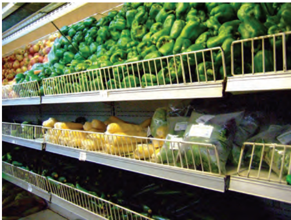
ナイロビ（ケニア）のスーパーマーケットの 野菜売り場（常温）