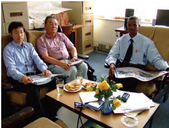
ブランタイヤ県農政局にて 帰国研修員へインタビュー〔マラウイ〕