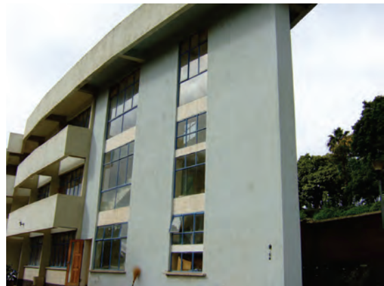
ブランタイヤ県農政局建屋〔マラウイ〕