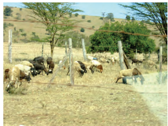
ンゴング農業研修センター（家畜）〔ケニア〕