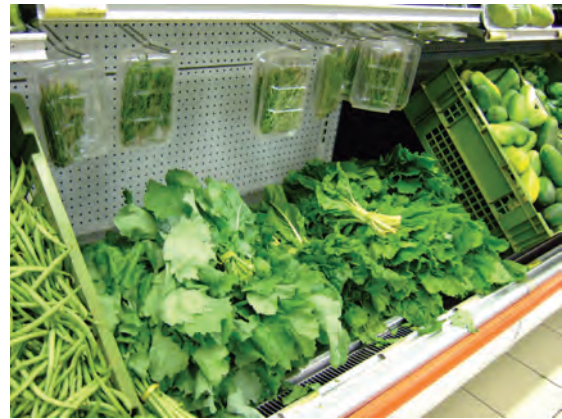
ブランタイヤのスーパーマーケット (野菜、常温)〔マラウイ〕