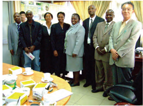
JICA ケニア事務所会議室にて、 帰国研修員ヘインタビュー