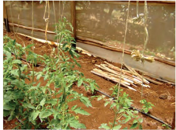
視察した農家②（ンゴング）（ビニルハウス） 〔ケニア〕