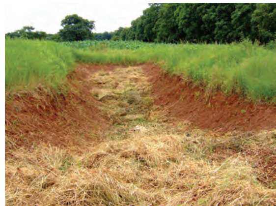
自然資源短期大学での帰国研修員の取り組み (バンカーサイロ)〔マラウイ〕