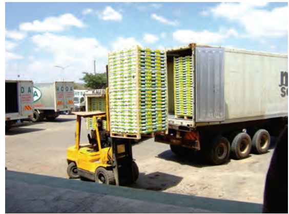
園芸作物開発公社倉庫から 空港へ農作物を運び出す〔ケニア〕