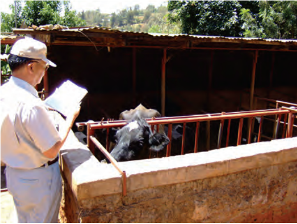
視察した農家①（ンゴング）〔家畜舎（ウシ）〕 〔ケニア〕