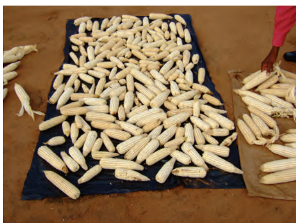
サリマ郡農業事務所 （収穫したメイズを乾燥させる）〔マラウイ〕