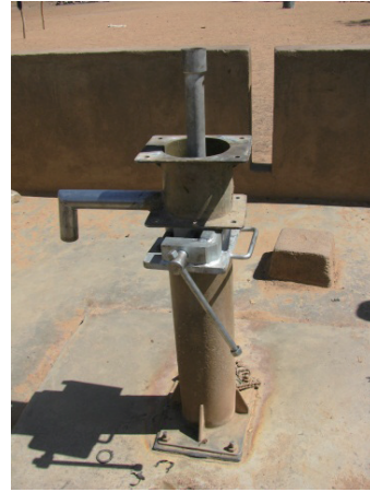
COGES 学校改善活動（井戸修理：他の COGES から修理方法を学習して）