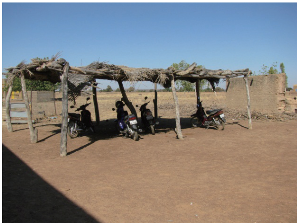
COGES 学校改善活動 (暑さ対策用仮教室設置 : 乾期は教員用バイク置き場)