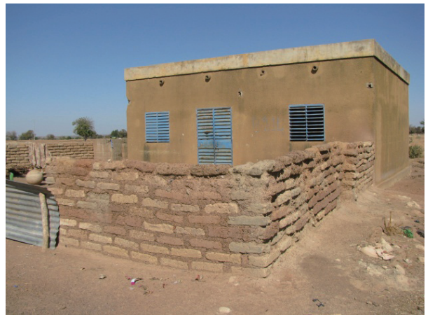
COGES 学校改善活動 (教員住居敷地壁設置)