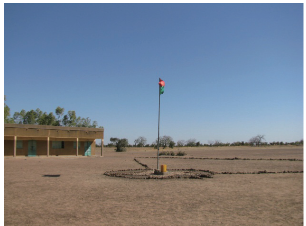
学校風景 - 対象校 / 現地調査校 2 (中央プラトー州ジニャレ基礎教育学区バルコウイテンガ小学校 : 農村部)