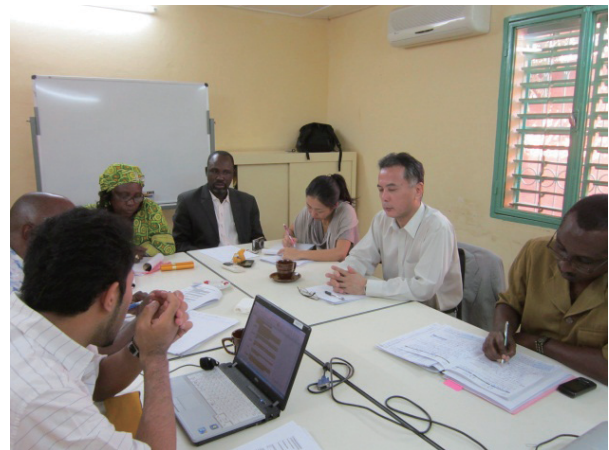
プロジェクトとのミニッツ協議