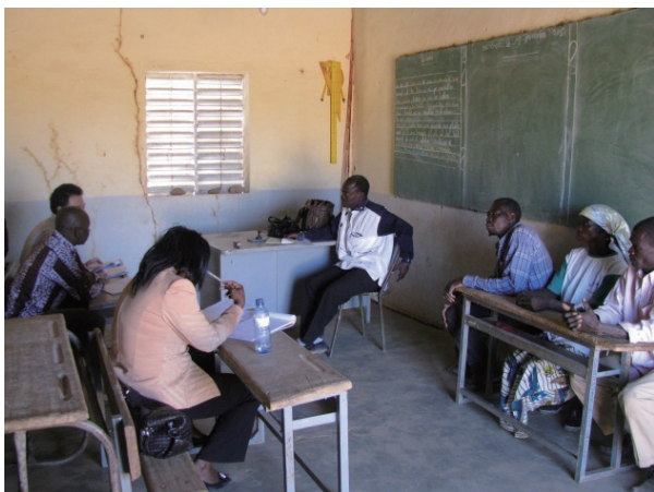
COGES 役員 / PTA 役員 (=COGES メンバー) インタビュー風景