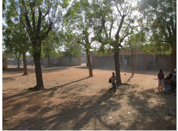
学校風景 - 対象校 / 現地調査校 1 (ワガドゥグ基礎教育学区 1 ネムネ小学校 : 都市部)