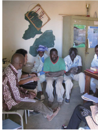
COGES 役員 / PTA 役員 (=COGES メンバー) インタビュー風景