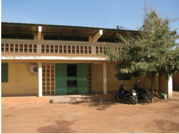
プロジェクト・オフィス