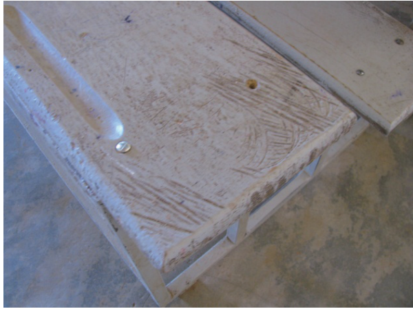
COGES 学校改善活動（学習机修理 = ネジ購入）