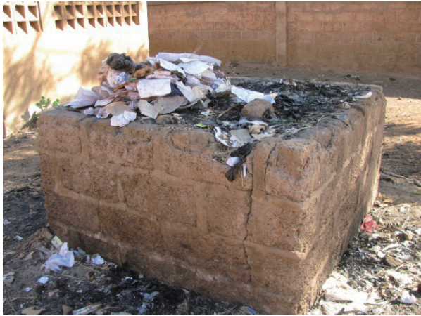
学校運営委員会 (COGES) 学校改善活動 (ゴミ捨て / 焼却炉設置) - 対象校 / 現地調査校 1 (ワガドゥグ基礎教育学区 1 ネムネ小学校 : 都市部)