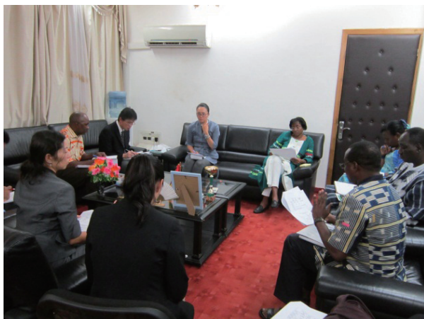
教育大臣表敬（プロジェクト説明含む）：正面右が大臣