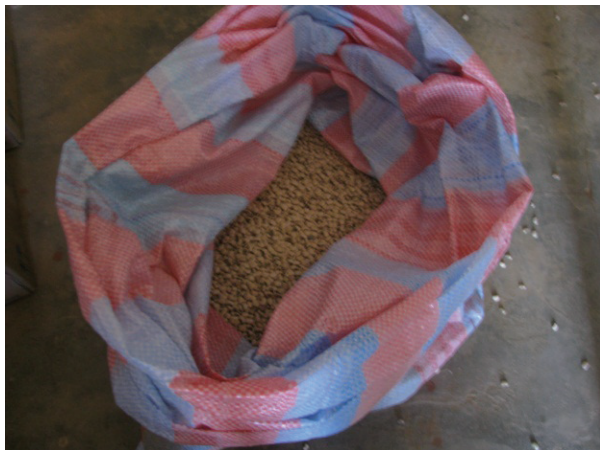
COGES 学校改善活動（給食用食材購入）