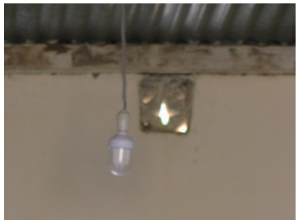
COGES 学校改善活動 (教室用電球設置)