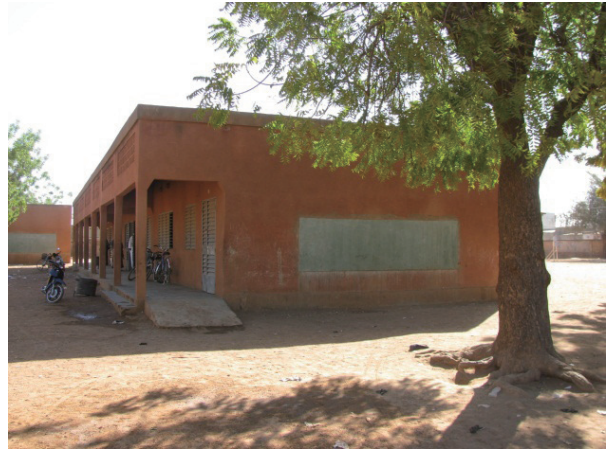
COGES 学校改善活動 (授業時間外 / グループ学習時補助用黒板設置) - 対象校 / 現地調査校 1 (ワガドゥグ基礎教育学区 1 ネムネ小学校 : 都市部)