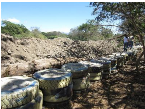
専門家の指導により設置し、住民により 延伸工事が行われている古タイヤ堤防 (コスタリカ、エル・ホテル地区)