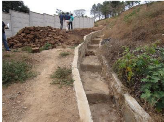
専門家の助言により整備された排水溝 (エルサルバドル、エル・コリージョ地区)