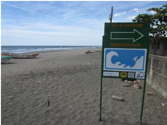
プロジェクトで設置された 津波避難経路を示す看板 (ニカラグア、サリナス・グランデス地区)