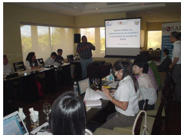
Terminal Evaluation Report の内容についての議論の様子 (コスタリカ、リベリア市)