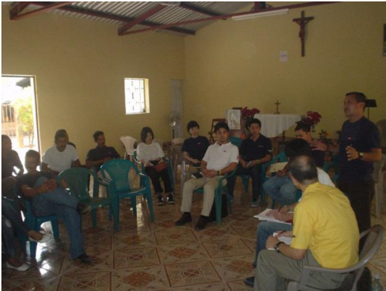
コミュニティからの聞き取りの様子 (ホンジュラス、サンタ・イザベル地区)