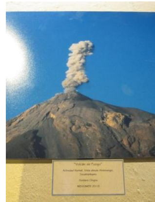
研修員の働きで開設された火山博物館に 展示されているフエゴ火山の写真 (グアテマラ、シウダ・ビエハ市)