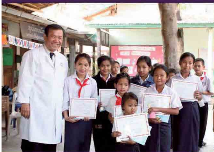
ドンコイ小学校検診スタッフ