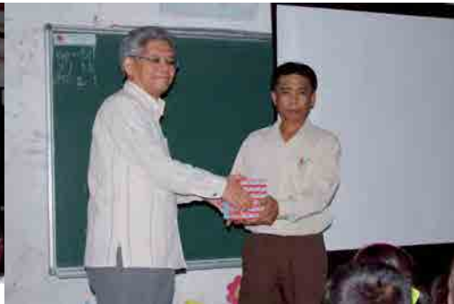
歯ブラシ・歯磨剤の贈呈