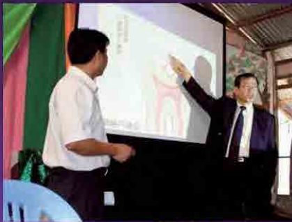
ポンパバオ小学校