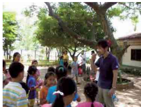
一緒に歯磨きをした