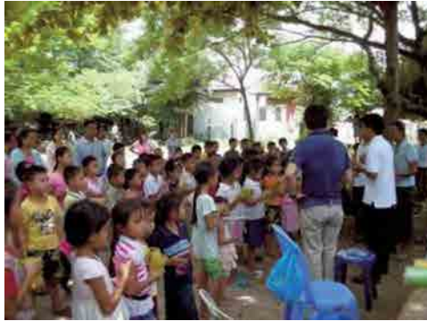
検診の済んだ子を木陰に集め