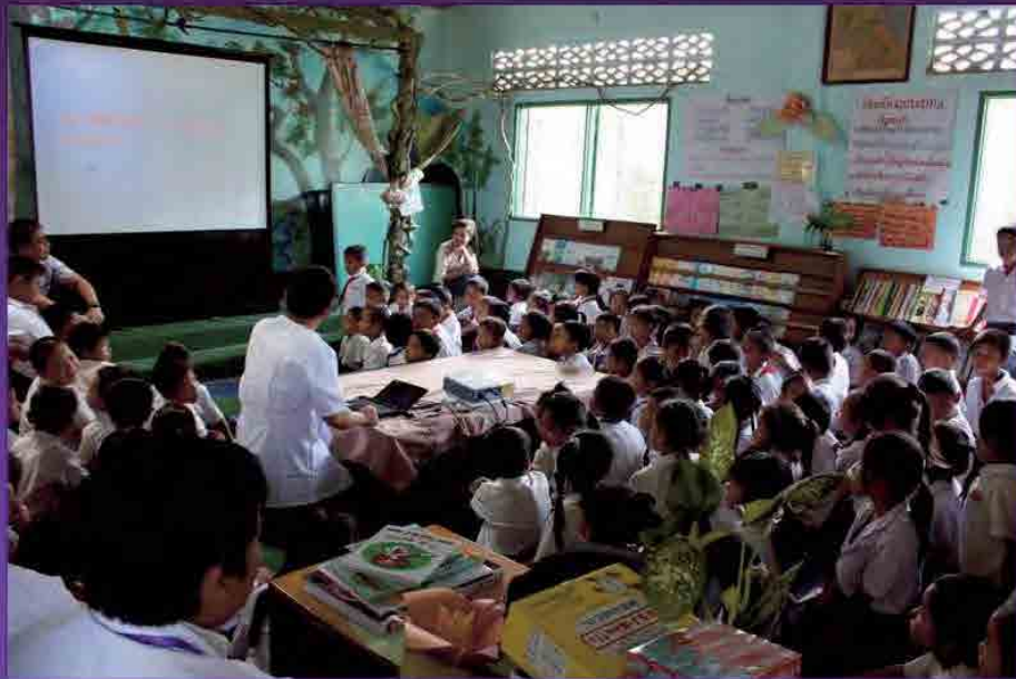
他の先生は外では検診準備を行っている