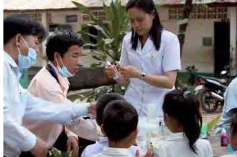
フッッシング指導を行うセタスタッフ