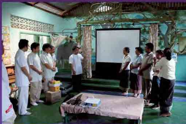
歯科検診前のミーティング