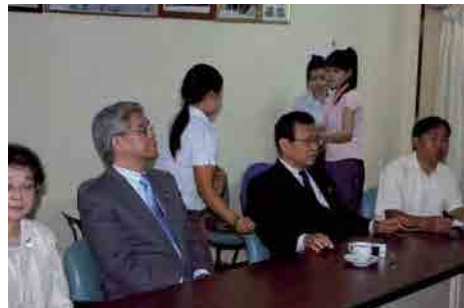
ラオス健康科学大学学長表敬訪問