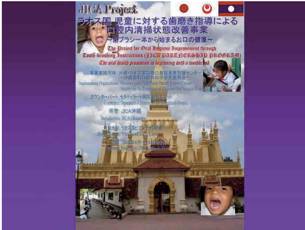
児童、教職員、父母に対する勉強会