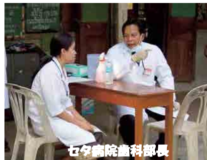
セタ病院歯科部長