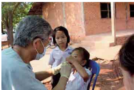
セタスタッフを実演を見せる高嶺先生