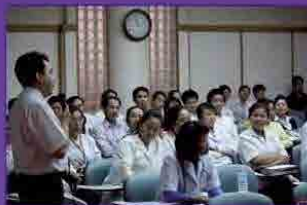
開業医、歯科学生、教員への講義