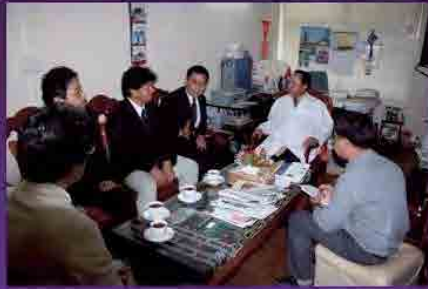
プロジェクト開始前の挨拶