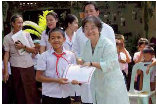
虫歯「0」の児童たちへ表彰