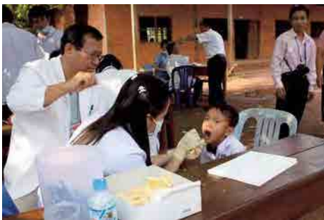
セタスタッフを指導する砂川先生