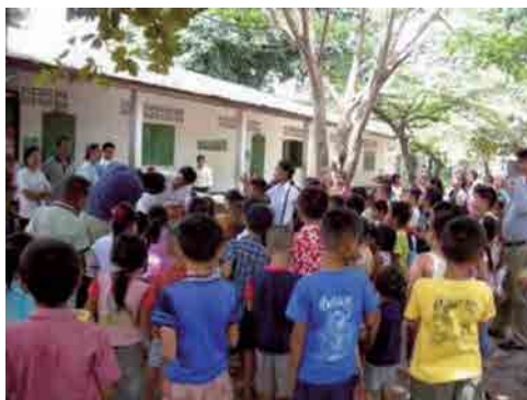
鏡で口腔内を見せて