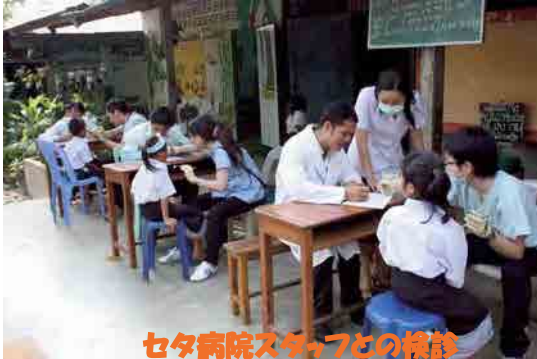
セタ病院スタッフとの検診