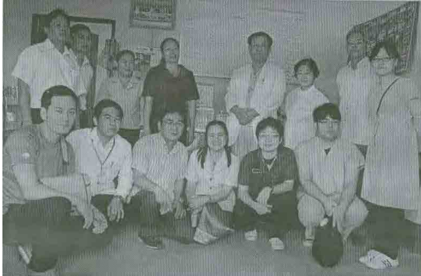
平成22年2月18日(木) 新聞