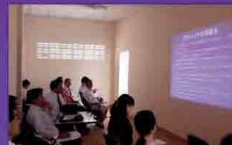
セタ病院歯科スタッフとの 最終ミーティング