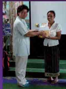
歯ブラシ・歯磨剤の贈呈