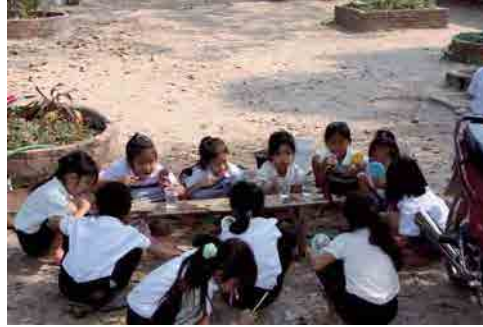
鏡をみながらフッッシング