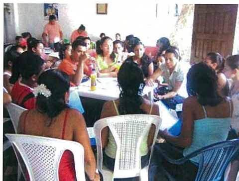
Discusión sobre actividades después de la terminación del Proyecto