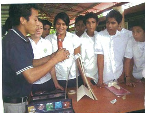
Charlas por Promotores Adolescentes