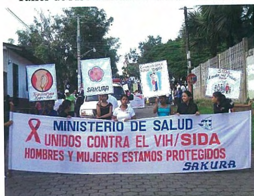
Eventos comunitarios para promoción de SSRA