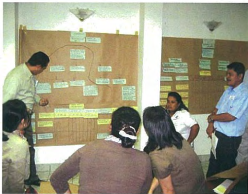
Taller de PCM