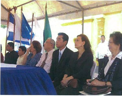
Ceremonia de Inauguración