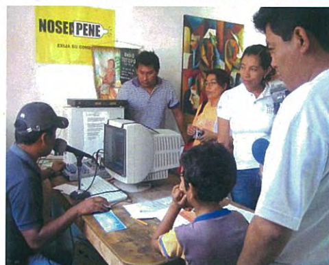
Curso en México: Visita a la oficina del programa de radio local para la promoción de SSRA