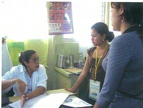
Evaluación del servicio por adolescentes