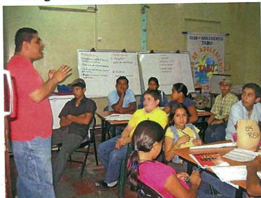
Capacitación de Promotores Adolescentes