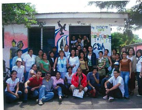
Intercambio con los jóvenes de Estelí