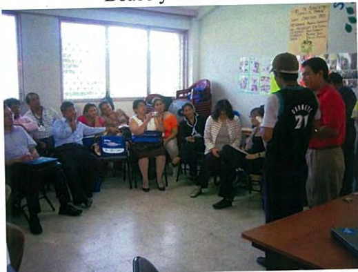
Visita por Proyecto PASOS de Honduras