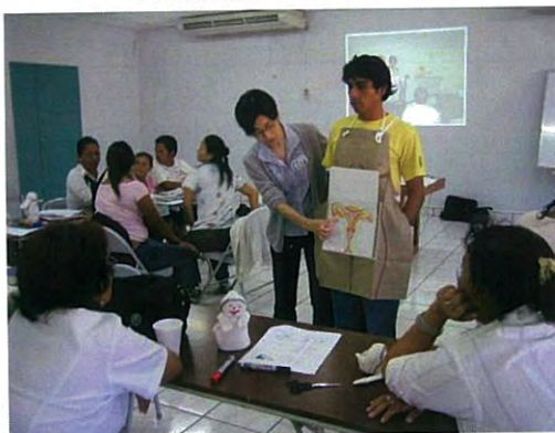
Taller de IEC • BCC