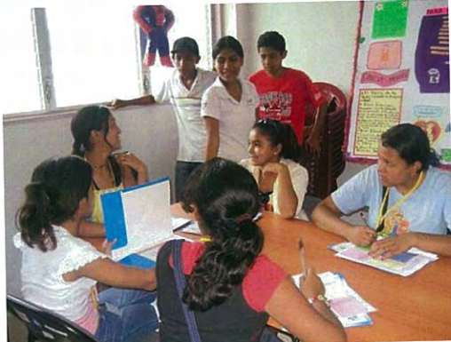
Intercambio entre Clubes de Adolescentes de Boaco y Granada