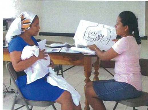
Taller de Consejería para SSRA