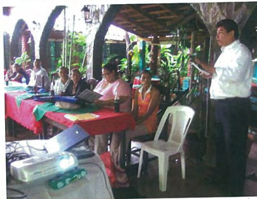
Expansión de Experiencia (Nueva Segovia)