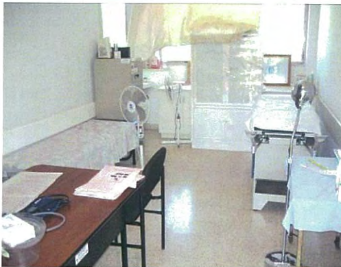
Suministro de equipamiento para SSRA en el consultorio