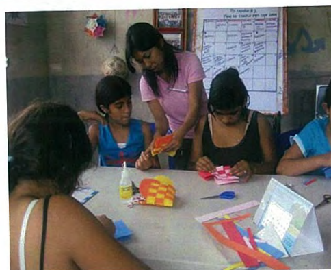
Clase de manualidades en el Club de Adolescentes