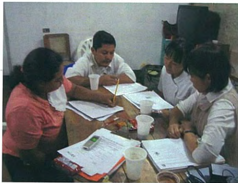
Planificación de Mini-mini Proyecto