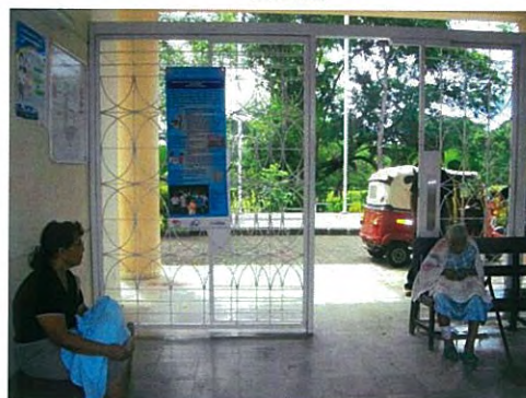
Instalación del banner de "Declaración de SSRA para año 2012"