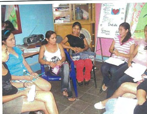
Administración del Club