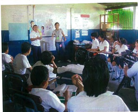
Educación sexual con persona de salud para alumnos en la escuela