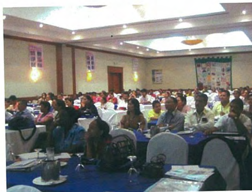
Foro Nacional de SSRA