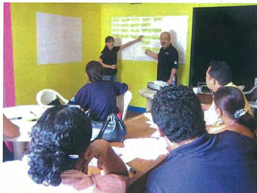
Taller para el fortalecimiento de CMS