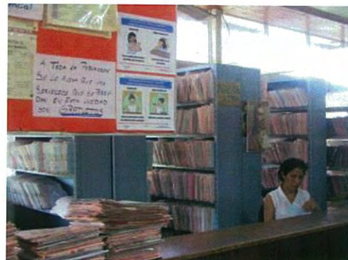
Póster de declaración del servicio amigable