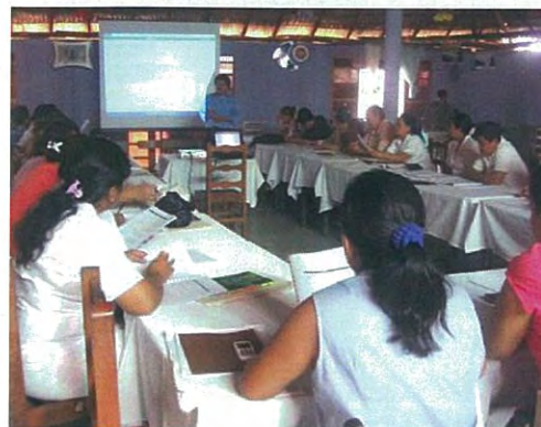
Taller de Indicadores de SSRA