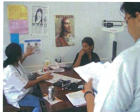
Monitoreo utilizando herramientas elaboradas