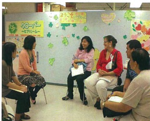
Curso en Japón: Visita a "Peer Room" en Tochigi