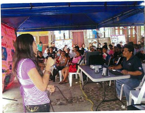
Reunión de Intercambio entre Boaco y Granada