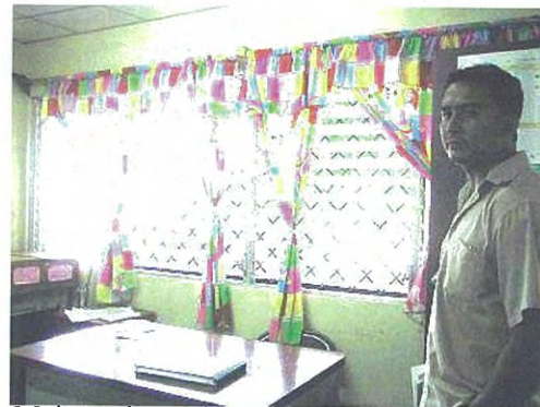
Mejoramiento de ambiente: Instalación de cortinas bonitas