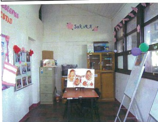
Inauguración de Club de Adolescentes