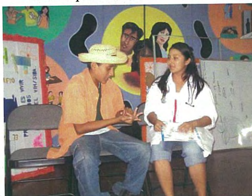
Promoción de SSRA por Sociodrama y Títeres