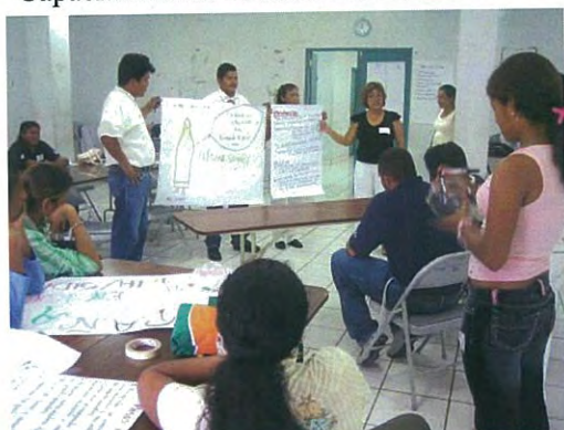
Taller de Asociación de Joven - Adulto