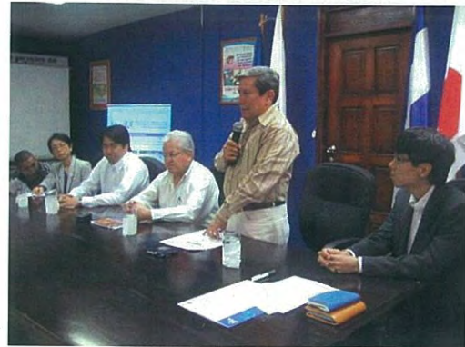
Ceremonia de Terminación (Comité de Coordinación Conjunta)