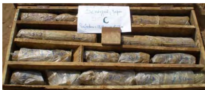
Photo 8 : Echantillons du sondage carotté B prélevés entre 7,5 et 10,5 m