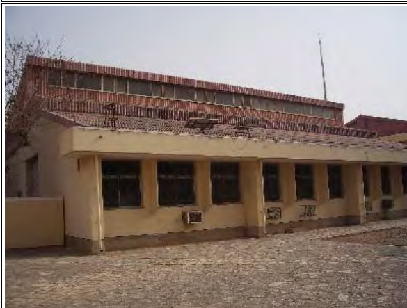
写真-15 : 電気実習棟 平屋建 1984年の無償資金協力にて建設