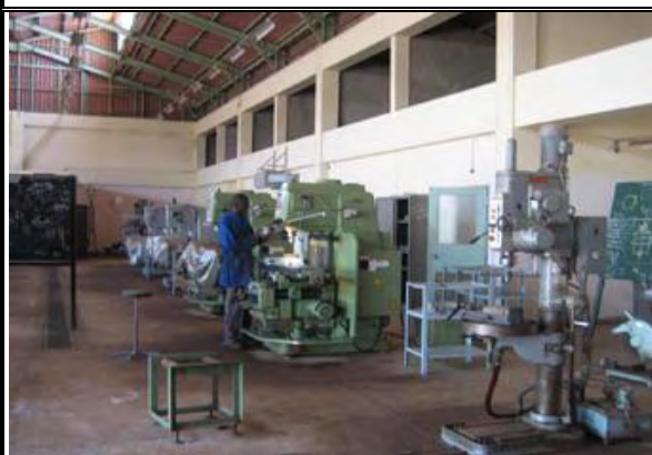
写真-10：BTI 機械実習棟 ボール盤：1984年の無償資金協力にて整備 現在も稼働中