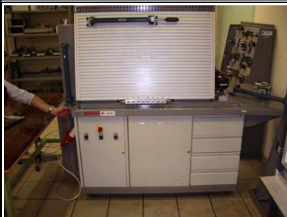
写真-8：BTS 実習棟 2階油圧・空圧実習室 油圧システム実習装置：1999年の技術協力にて 供与、状態は良好である