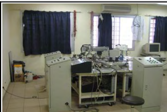
写真-6 BTS 実習棟 2階 自動制御科実習室 生産ラインシミュレーションシステム：2005年 の無償資金協力で整備。状態は良好である