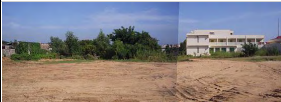
写真-19：施設建設予定地（概略設計概要説明調査時） 重機保守棟建設予定地はCFPT 敷地内に確保されている 右の建物は多目的棟 2 階建(2005 年竣工)