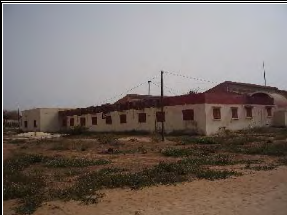
写真-14 : BTS 棟 平屋建 1999年「セ」国政府の予算にて建設