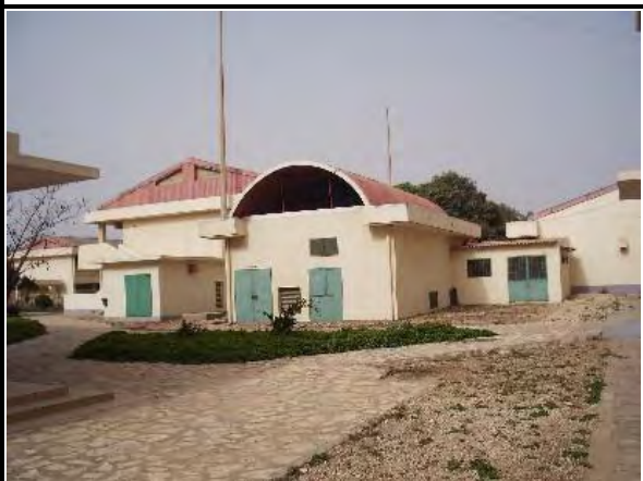
写真-16 : インフラ棟 平屋建 変電棟・自家発電機棟