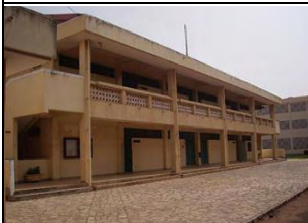
写真-4：既存建物 BTI 電子実習棟 2階建