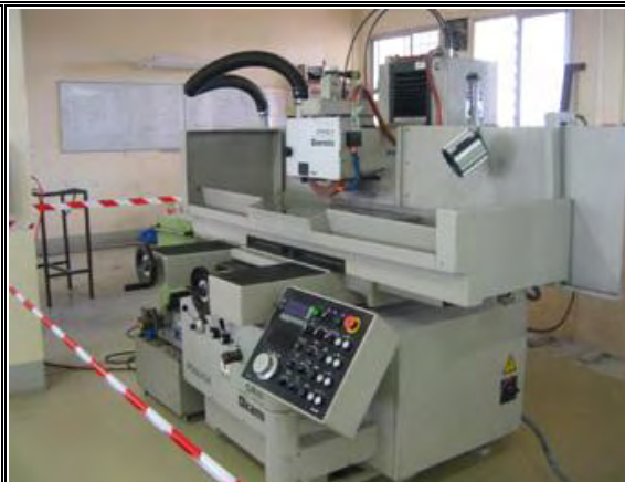
写真-3：電気機械実習棟 工具研削盤：2005