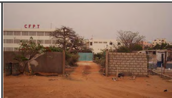
写真-21：既存門扉外観 同左既存門扉を V. D. N. 通り敷地の外側より望む 背後の建物は BTS 教室・実習棟