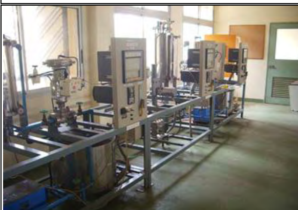
写真-11：電子実習棟 1階実習室 水力発電シミュレーター：1984年の無償資金協 力にて整備。現在も稼働中