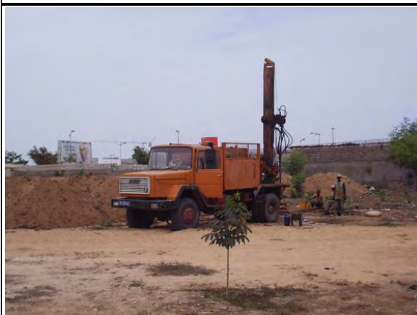
写真-17 : 敷地ボーリング調査 3か所測定