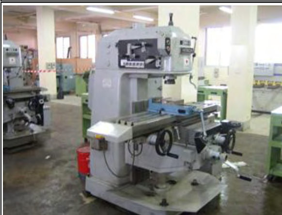
写真-9：教室・実習棟 1階実習室 フライス盤：2005年の無償資金協力で整備 状態は良好である