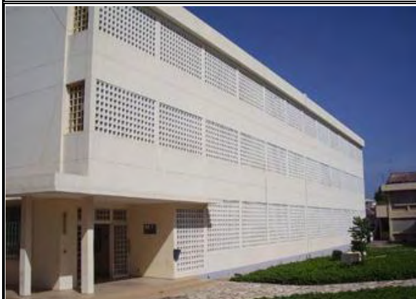
写真-2：BTS 教室・実習棟 3階建