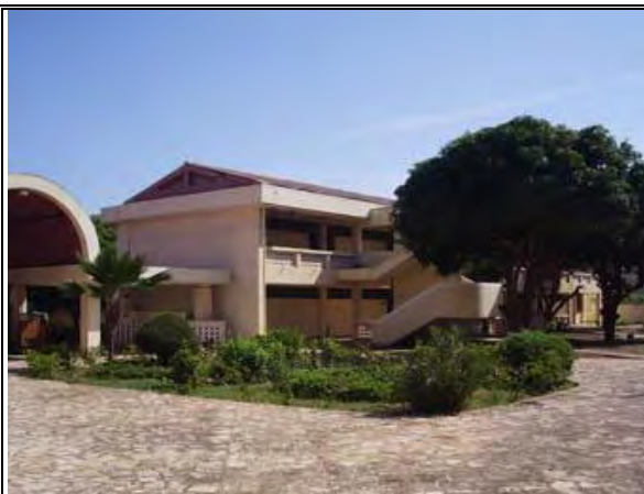
写真-13 一般教室棟 2階建 座学教室 1984年の無償資金協力にて建設