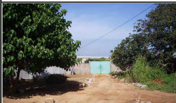
写真-20：工事車輛搬入の既存門扉 2002 年の増築工事で使用、敷地内側より望む