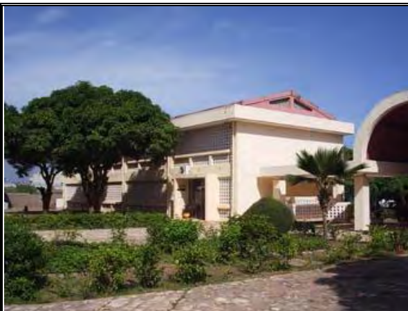
写真-12 管理棟 2階建 校長室、指導員室、会議室を持つ 1984年の無償資金協力にて建設