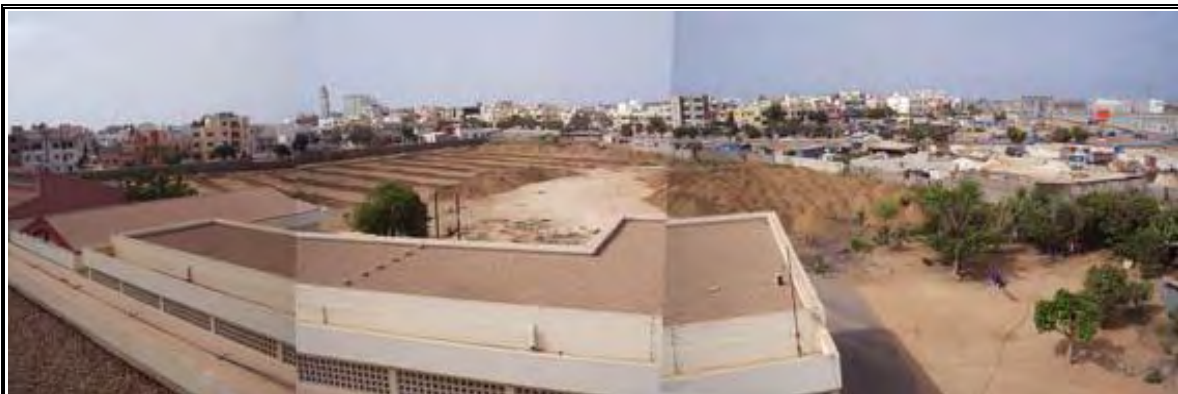
写真-18：CFPT 敷地南の空地（協力準備調査時） 左の縞模様の造成は建設中のサッカーグラウンド 右の盛土部分は重機保守棟建設予定地