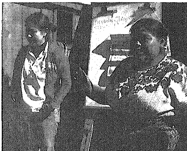
Una ex becaria realiza sus actividades junto con una voluntaria

Así la cooperación de seguimiento sirve para incrementar los efectos y la calidad de las acciones de cooperación internacional de Japón, al mantener y desarrollar los impactos de una cooperación ya terminada durante un largo tiempo.