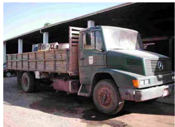
Boqueron県庁機材 ドイツ政府によって供与された井戸建設の支援車両