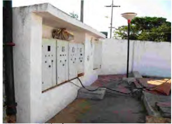
Concepción県 ポンプステーション 配電盤