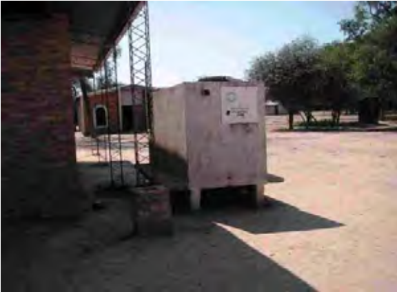
Boqueron県 Santa Helena村 赤十字が建設した雨水集水のための貯水槽 現在は使用されていない