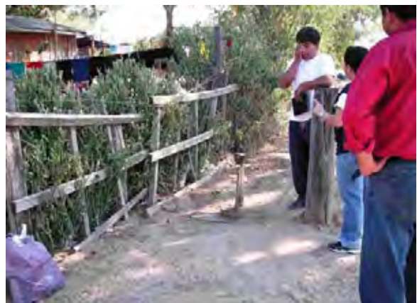
Boqueron県 Enchet村 インディヘナ村落に設置された共同水栓 市内から配水されている