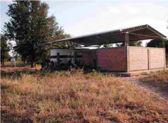
boqueron県 Nascu村 インディヘナ村落 世銀(BIRF3)によって建設された衛生施設 住民の会合が行われていた 屋根への雨も貯水できる構造となっている