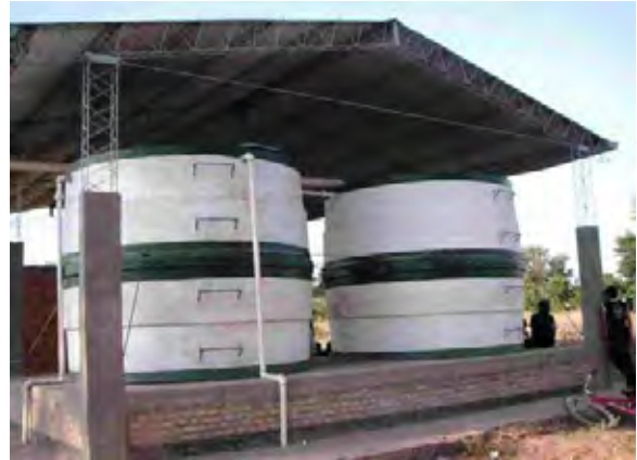
boqueron県 Nascu村 インディヘナ村落 衛生施設の貯水槽 水源はタハマル 動力である風車が故障し使用されていない