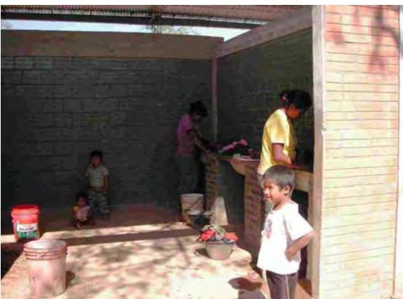
Boqueron県 Santa Helena村 衛生施設内の洗濯場