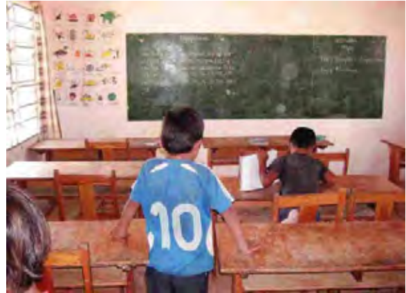
Boqueron県 Santa Helena村 インディヘナ村落の小学校