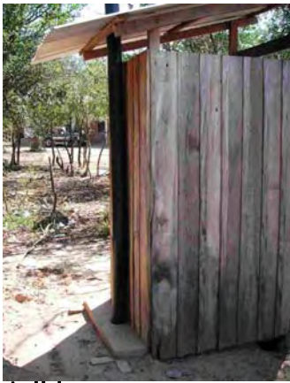
boqueron県 Santa Helena 汲み取り式トイレ