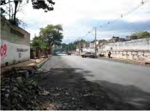
Asunción首都圏 市役所とESSAPIによる雨水排水管、污水管、配水管の敷設ルート