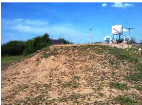
Mcal Esti市 高架タンクへは井戸から送水