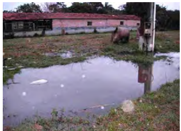
Pilar市 排水整備されていない箇所(雨天時)