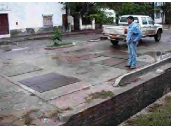
Pilar市 使用されていない汚水送水ポンプ