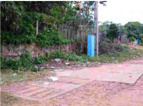
Caaguazu県 Alc下水処理場 汚水ポンプ中継地