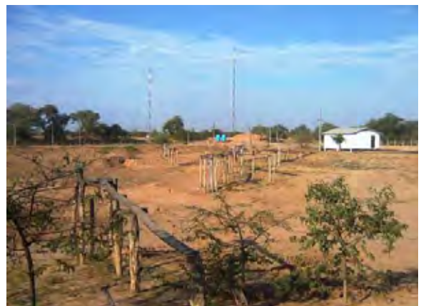
Filadelfia市 タハマール(溜池)