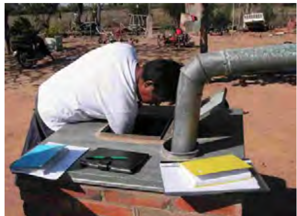
Boqueron県 Enchet村 雨水を貯蓄するアルヒーベと呼ばれる地下式貯水槽 本村落では各戸に同様の施設が設置されている