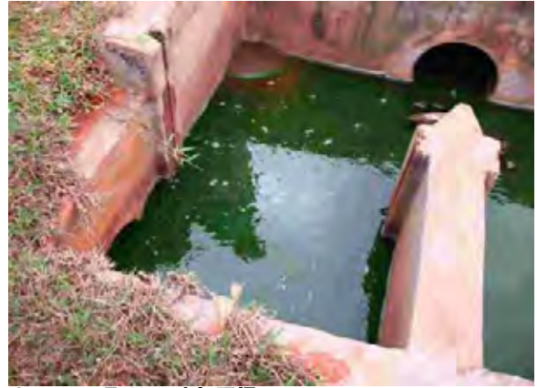
Caaguazu県 Alc下水処理場 下水ます