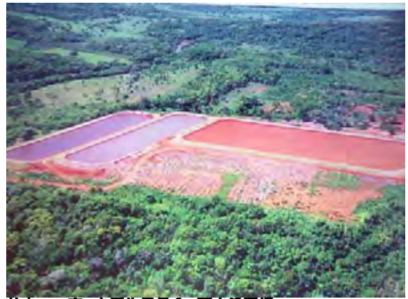
Hohenau市 水衛生委員会 下水処理場 下水処理場全景