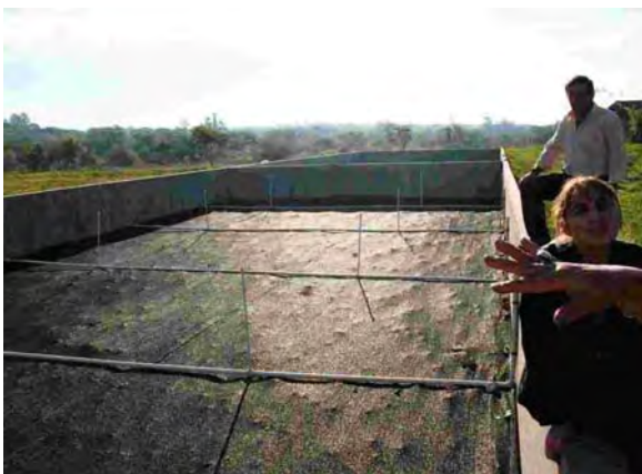
Itagua市 水衛生委員会 下水処理場 散水ろ床法