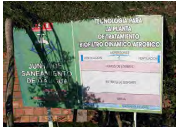
Itagua市 水衛生委員会 下水処理場 下水処理場案内板