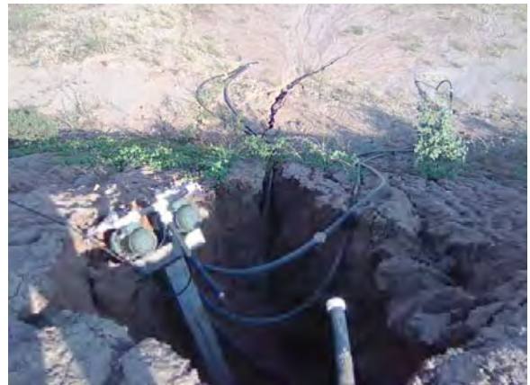
Filadelfia市 タハマール下部砂層の取水ポンプ