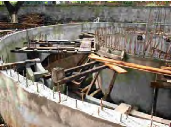
Asunción首都圏 下水処理場