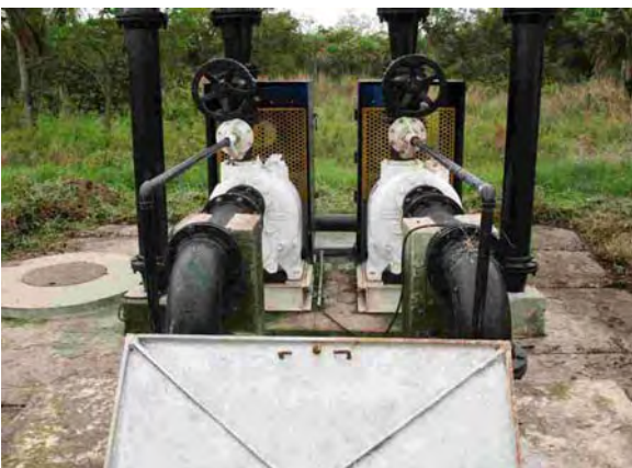
San Pedro市 下水処理場バルブ