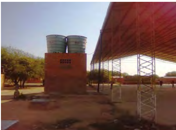
Filadelfia市 雨水集水施設と高架タンク