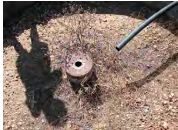
Boqueron県 Campos Vie村 取水用井戸の上部 充填されたろ過砂を通し、中心部の配管から取水する ろ過部が閉塞しやすく、取水できない施設が多い