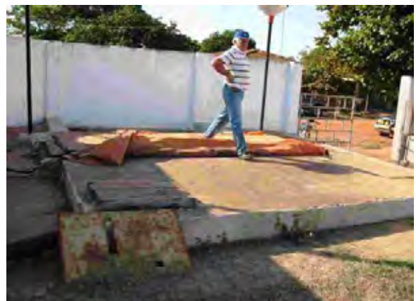
Concepcion県 ポンプステーション 汚水ポンプ中継地