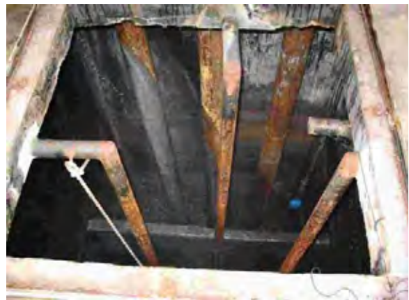
Villela下水処理場 ポンプ水槽