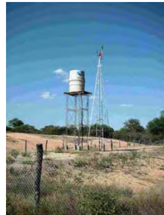
その他の村 世銀(BIRF3)の支援により建設された高架式貯水槽と風車