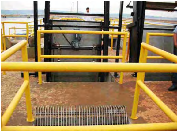
Encarnación市 ヤシレタ公園建設 下水処理場 一次処理