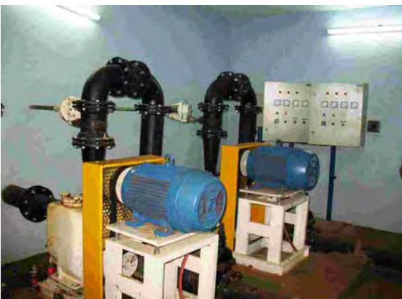
Hohenau市 水衛生委員会 下水処理場 汚水ポンプ