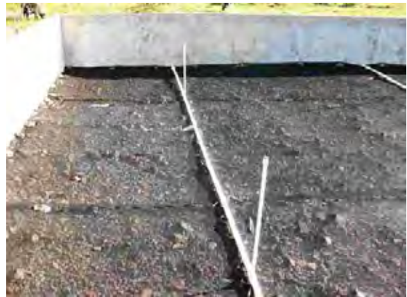
Itagua市 水衛生委員会 下水処理場 散水ろ床法