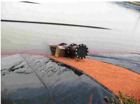
Encarnación市 ヤシレタ公園建設 下水処理場