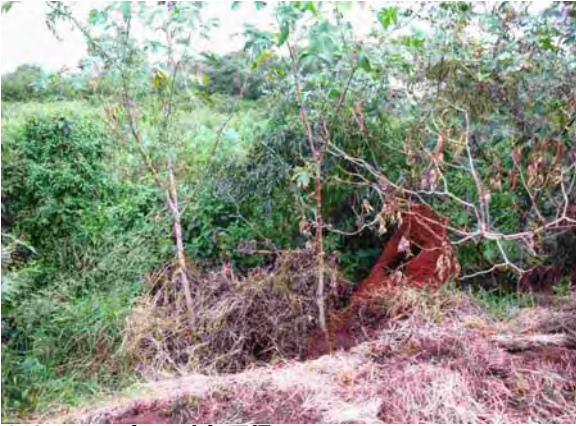
SJ Caballero市 下水処理場 酸化池バイパス