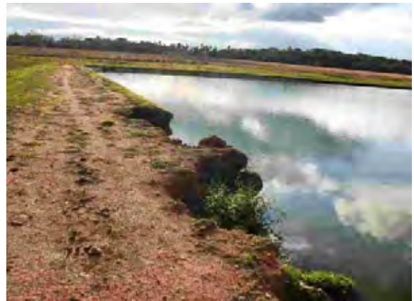
Conl.Oviedo市 下水処理場 最初沈澱池兼ばつ気槽