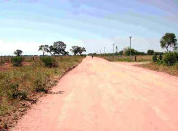
Boqueron県 Campos Vie村 西部地域の様子