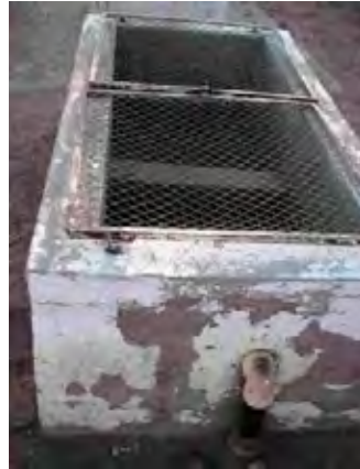
西部その他の村 村落に設置されたアルヒーベ(貯水槽) 高架水槽から送水されてくる