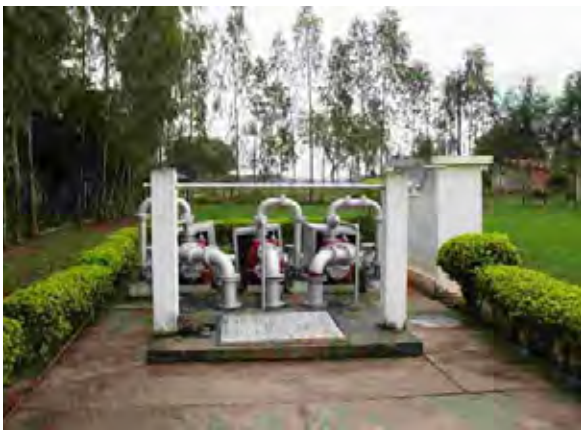
Villela下水処理場 汚水ポンプ