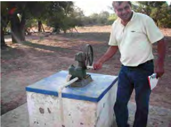
その他の村 村落に設置されたアルヒーベ(貯水槽) 高架水槽から送水されてくる