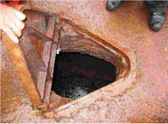
Este市 放流地点マンホール