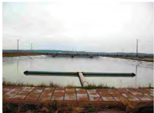
Encarnación市 ヤシレタ公園建設 下水処理場 最初沈澱池兼ばつ気槽