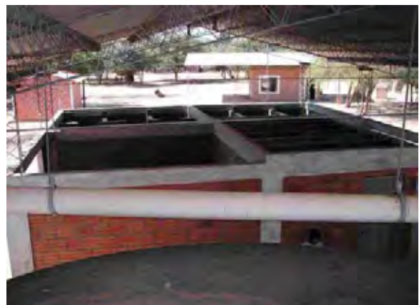
Boqueron県 Santa Helena村 衛生施設の内部 シャワー施設、洗濯場が併設されている