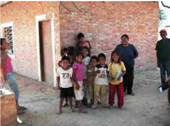
Boqueron県 Santa Helena村 小学校の生徒と先生 水衛生委員会が設立されていないため、先生が中心となり衛生施設の管理を行っている