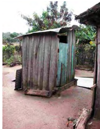
Caazapa県 Puchelito 汲み取り式トイレ