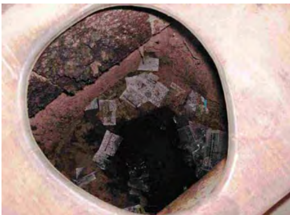
boqueron県 Santa Helena 汲み取り式トイレ(中の様子)