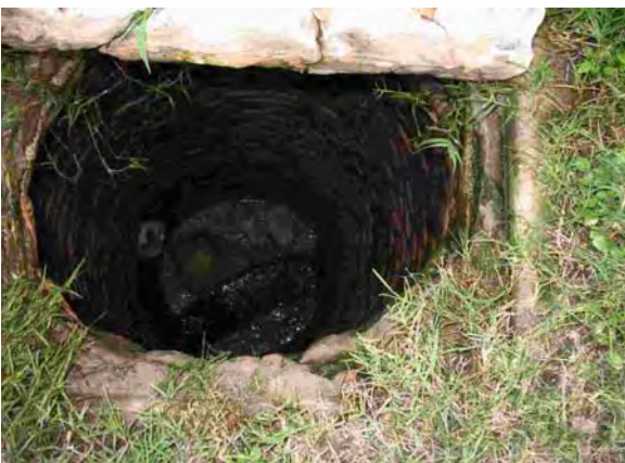
Villa Hayes市 マンホール