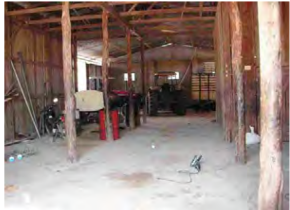
Boqueron県 Causemirue村 インディヘナ村落 ゴマ栽培が主対であるが、本村落では組合が存在しトラクターなどの重機を所有している