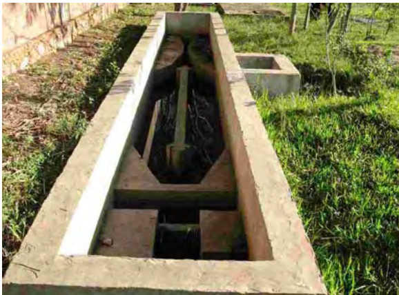
Itagua市 水衛生委員会 下水処理場 下水処理場への流入