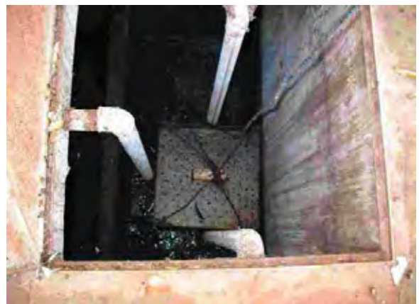
Hohenau市 水衛生委員会 下水処理場 汚水ポンプ水槽