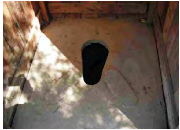
Santa Helena-boqueron 汲み取り式トイレ(中の様子)