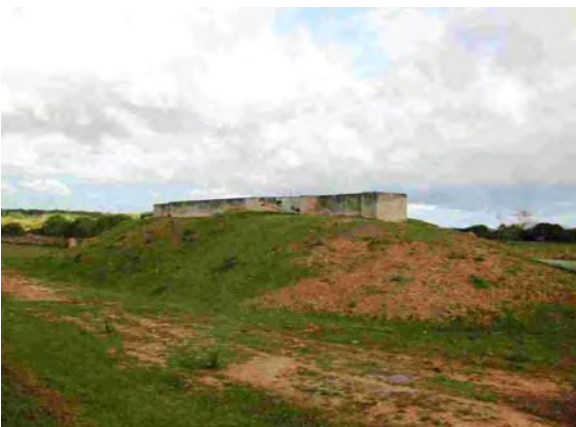
Conl.Oviedo市 下水処理場 沈砂池(地下)