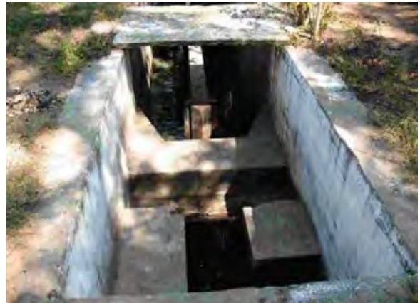
Limpio Ralf 下水処理場 下水処理場への流入