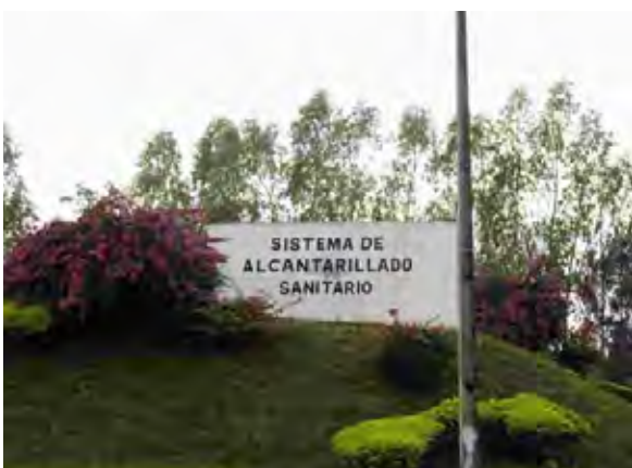
Villela下水処理場 下水処理場案内板