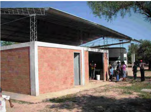
Boqueron県 Santa Helena村 インディヘナ村落 世銀(BIRF3)によって建設された衛生施設