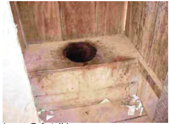
boqueron県 Santa Helena 汲み取り式トイレ(中の様子)