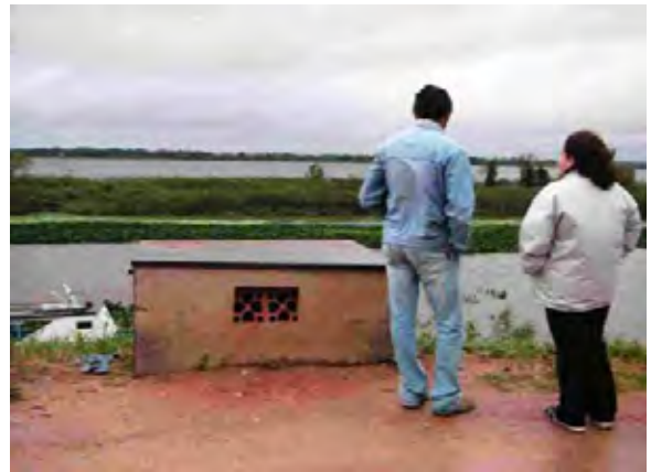
Pilar市 汚水ポンプボックス