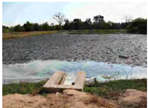
Filadelfia市 メノニータ組合 最初沈澱池