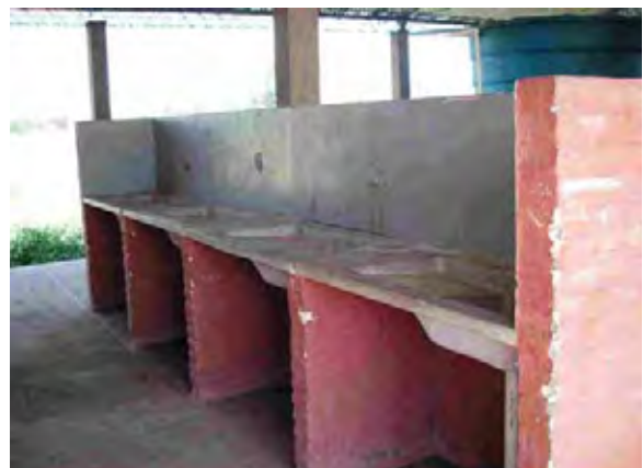
Boqueron県 timoteu村 世銀(BIRF3)の支援により建設された衛生施設の洗濯場 使用されていない