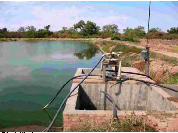
Filadelfia市 最初沈澱池兼ばっ気槽