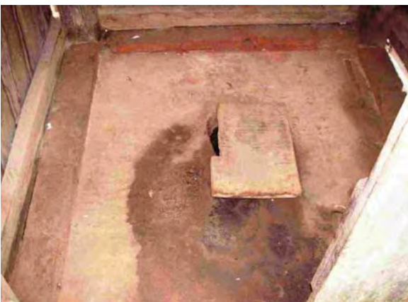
Caazapa県 Puchelito 汲み取り式トイレ