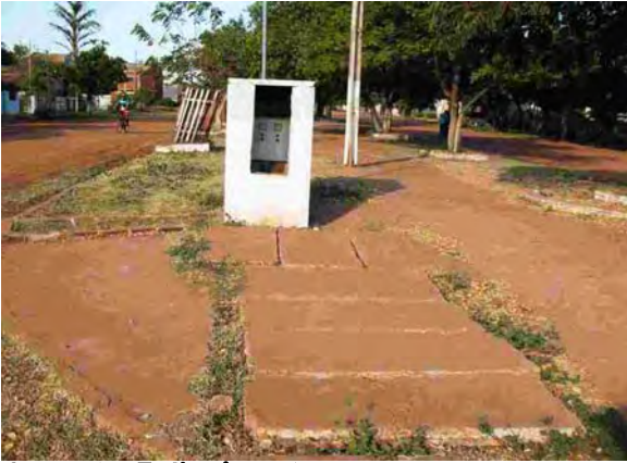
Concepción県 ポンプステーション 汚水ポンプ中継地