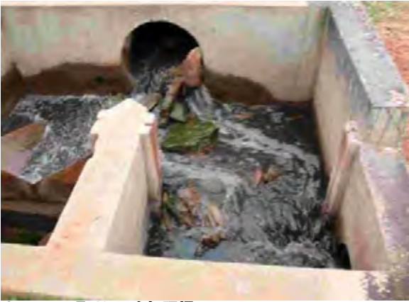
Caaguazu県 Alc下水処理場 下水処理場への流入