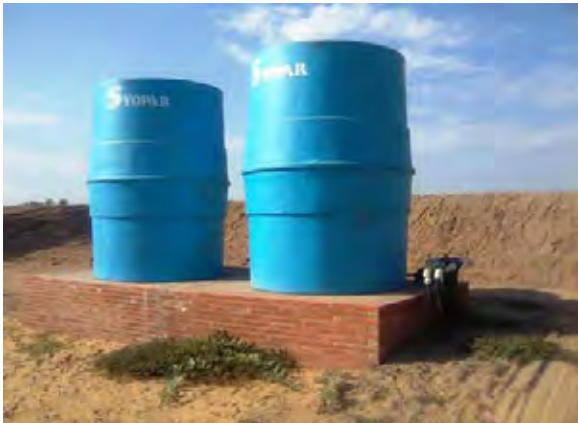
Filadelfia市 村落用貯水タンク