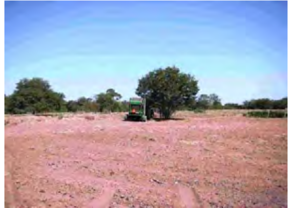
Boqueron県 Campos Vie村 酪農が主としているがラテン系村落では重機を所有する村落もある