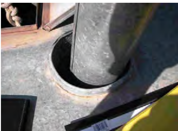
Boqueron県 Enchet村 アルヒーベの上部構造 汚物が混入しないよう、口元の口径が小さくなっている