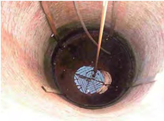
Boqueron県 Causemirue村 浅井戸の内部