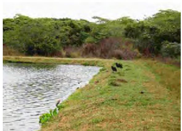
Villarrica市 下水処理場 酸化池