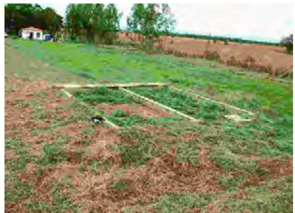
San Pedro市 暗渠