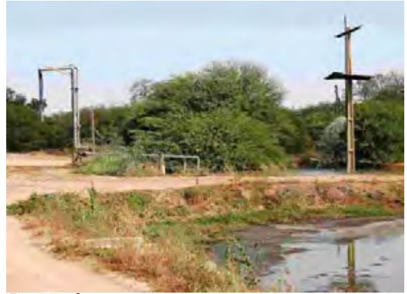
Filadelfia市 最初沈澱池兼ばっ気槽