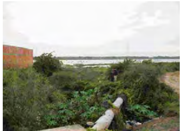
Villa Hayes市 下水管