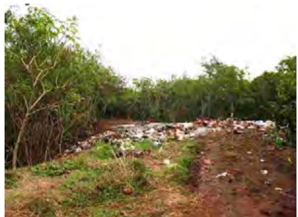
SJCaballero市 下水処理場 周辺にゴミ捨て場