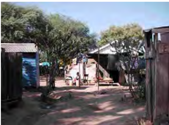
Boqueron県 Enchet村 西部村落の様子