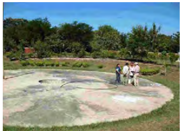
Limpio市 下水処理場 嫌気処理槽