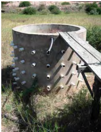
Boqueron県 Campos Vie村 タハマル(ため池)内に設置された取水用井戸の構造 調査時には水が枯れていた