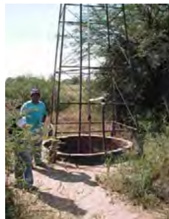
Boqueron県 Causemirue村 浅井戸と揚水用の風車 一部地域では塩分の少ない飲用可能な地下水が確保できる