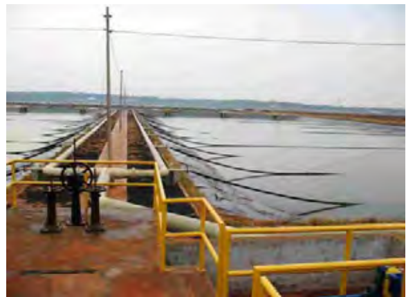
Encarnación市 ヤシレタ公園建設 下水処理場 最初沈澱池兼ばつ気槽