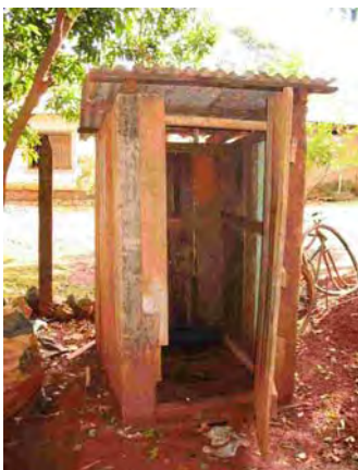
Este市 汲み取り式トイレ