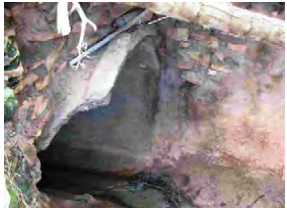
Asunción首都圏 雨水排水管に污水管が接続された状況