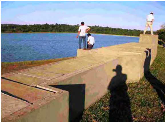
Hohenau市 水衛生委員会 下水処理場 酸化池