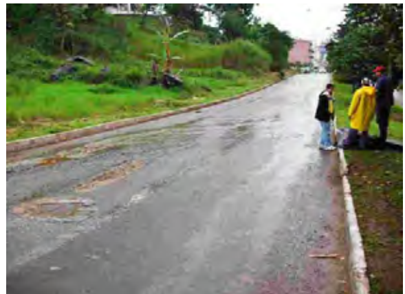
Este市 Este市における市街地排水はこの道路下を横断して河川へ放流される