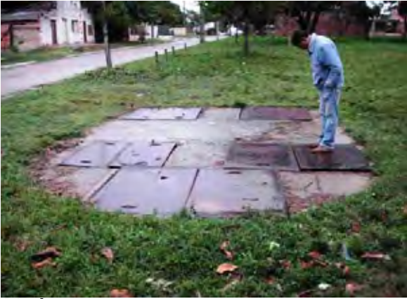
Pilar市 汚水送水ポンプ