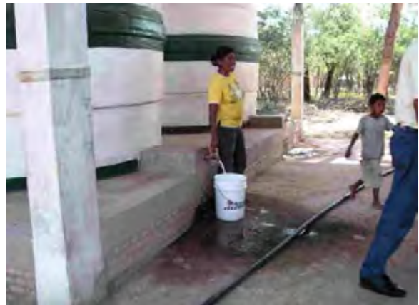
Boqueron県 Santa Helena村 貯水槽から水を汲む住民 水源はタハマルおよび屋根への雨水