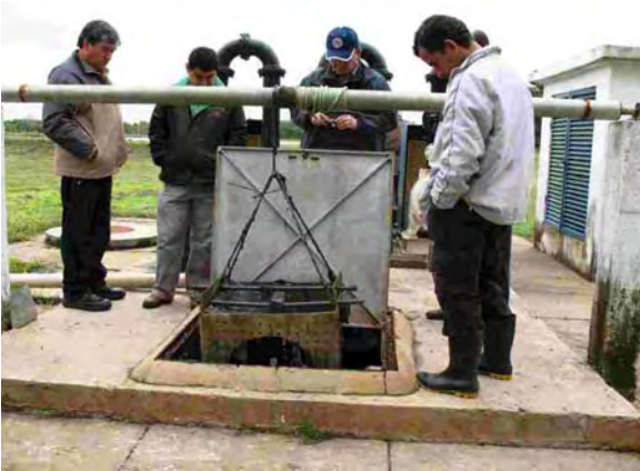
San Pedro市 水衛生委員会 下水処理場 流入水槽