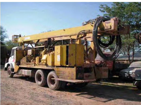
Boqueron県庁機材 ドイツ政府によって供与された井戸掘削機 スペアパーツが入手困難で現在使用できない状況にある