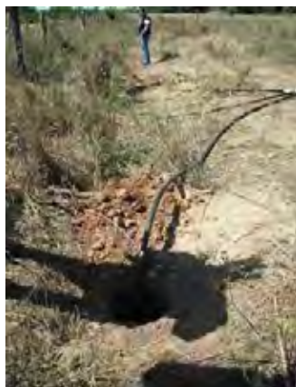
Boqueron県 Campos Vie村 住居敷地内に設置された裸口と地下水取水用のポリエチレン管