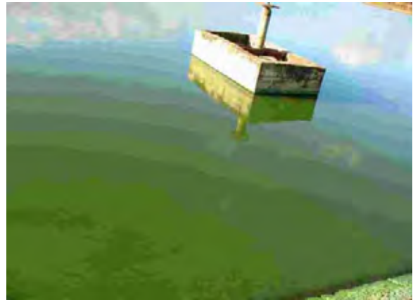
Villarrica市 下水処理場 同左