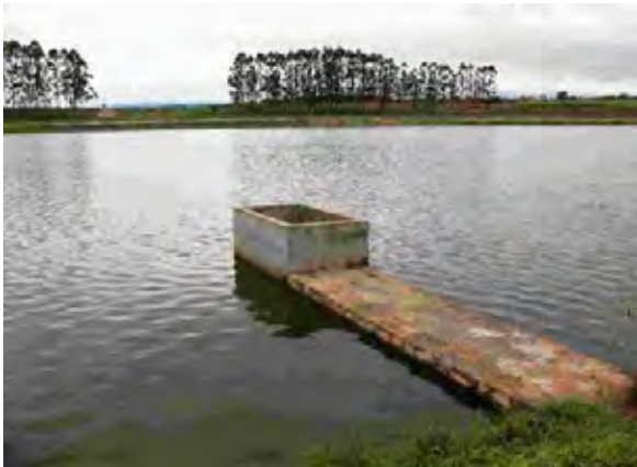
Villarrica市 下水処理場 酸化池、流出部