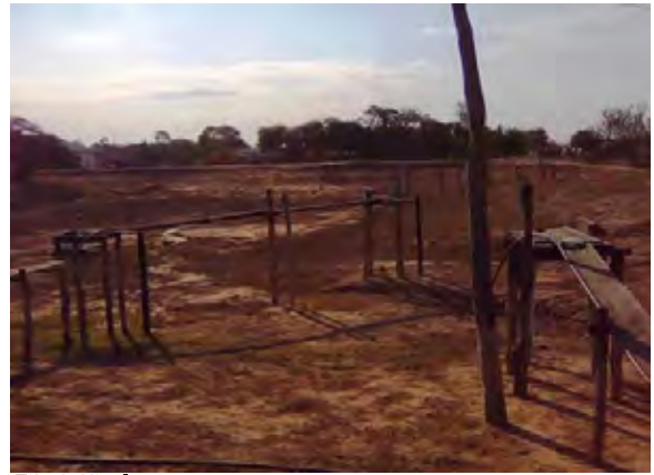
Filadelfia市 タハマール(溜池) ホースは砂層中にある取水ポンプに接続している。