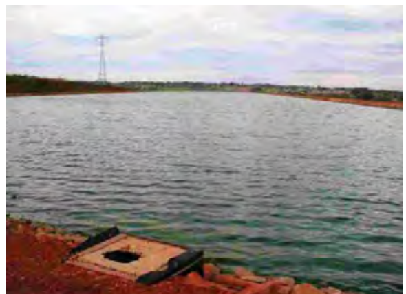
Caaguazu県 Alc下水処理場 最初沈澱池