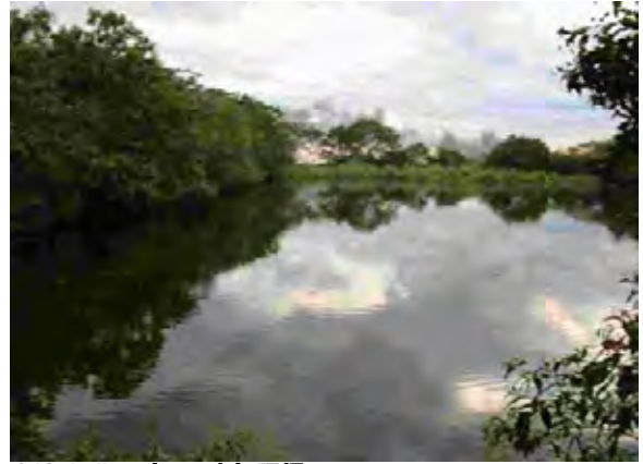
SJ Caballero市 下水処理場 酸化池