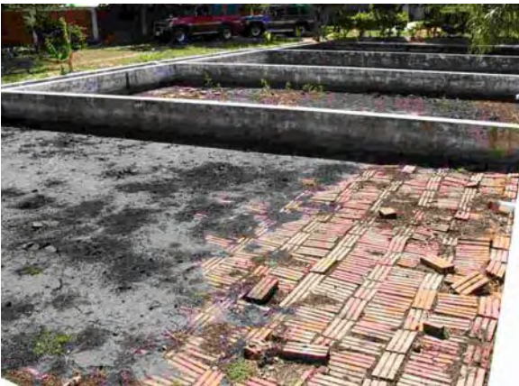
Limpio Ralf 下水処理場 汚水乾燥床