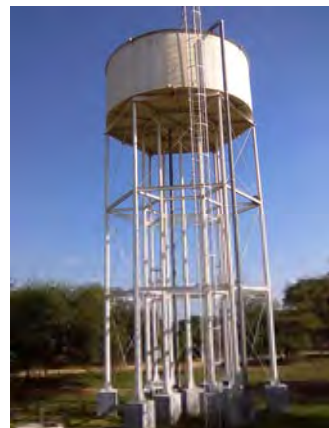
Mcal Esti市 高架タンク