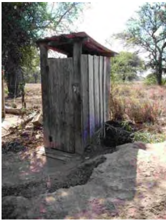
boqueron県 enchet 汲み取り式トイレ