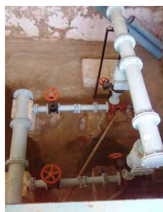
Mcal Esti市 送水管バルブ