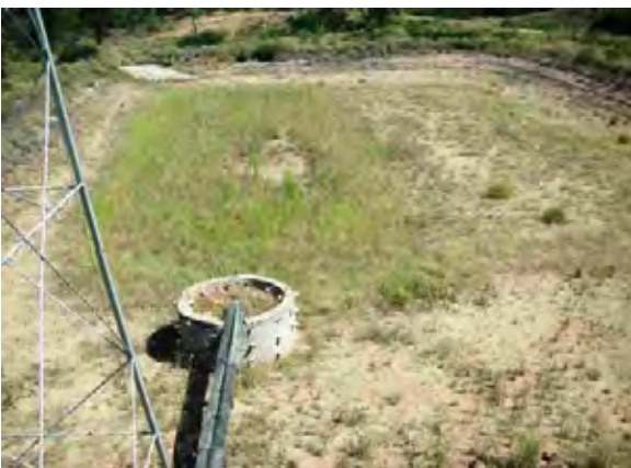
Boqueron県 timoteu村 世銀(BIRF3)の支援により建設されたタハマルの全景 下部に浸透を妨げる措置がされていない