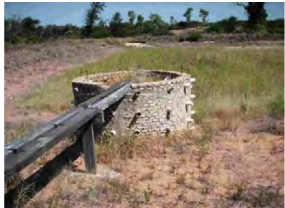
Boqueron県 timoteu村 タハマルと取水用の井戸