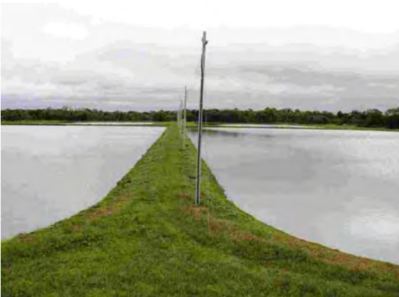
San Pedro市 酸化池