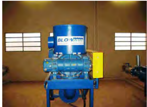
Encarnación市 ヤシレタ公園建設 下水処理場 汚水ポンプ