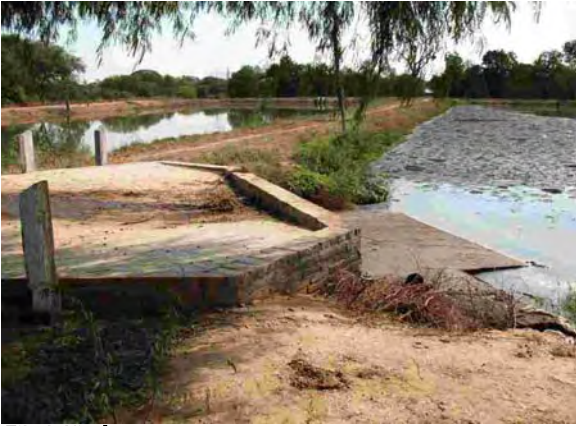
Filadelfia市 最初沈澱池、酸化池