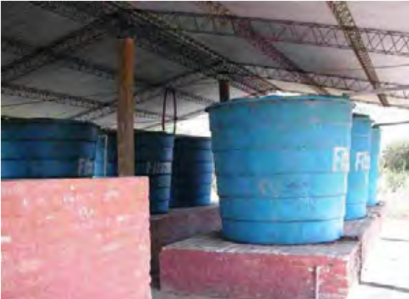
Boqueron県 timoteu村 世銀(BIRF3)の支援により建設された衛生施設の洗濯場 使用されていない