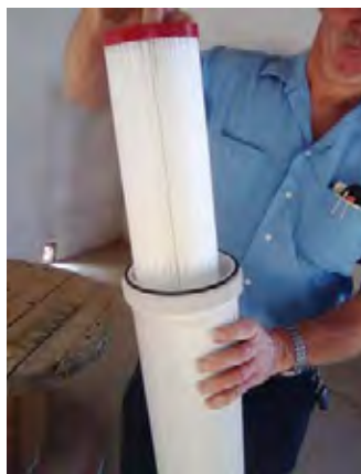
Filadelfia市 除塩設備フィルター