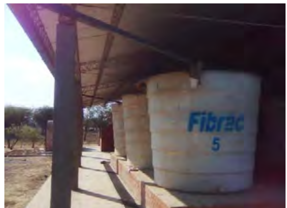
Filadelfia市 雨水貯水用貯水タンク