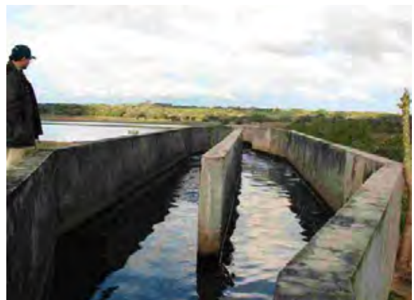
Conl.Oviedo市 下水処理場 下水処理場への流入