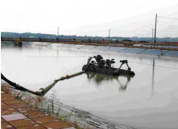
Encarnación市 ヤシレタ公園建設 下水処理場 最初沈澱池兼ばつ気槽