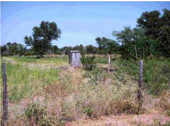
Boqueron県 汲み取り式トイレ