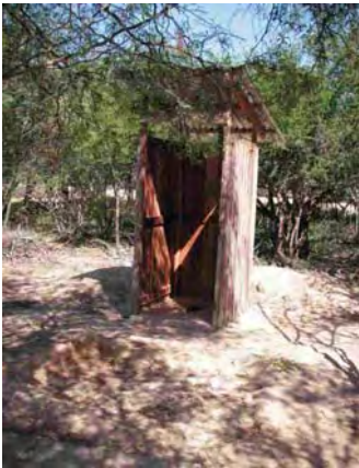
Santa Helena-boqueron 汲み取り式トイレ