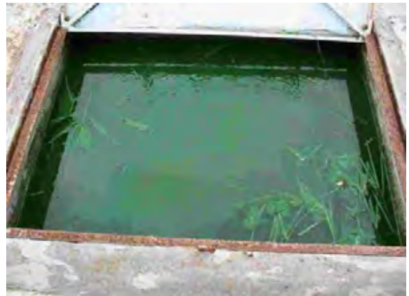
San Pedro市 酸化池流入ボックス