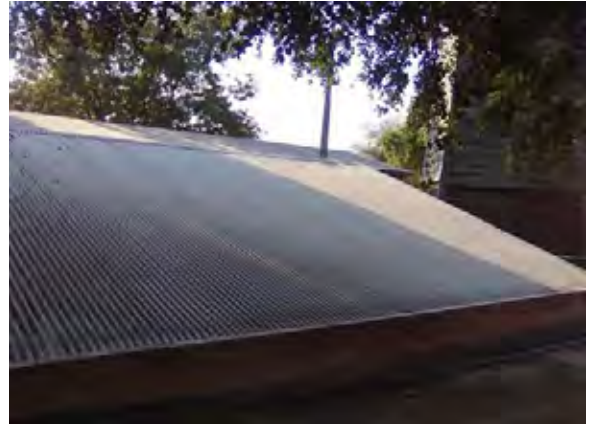
Filadelfia市 雨水集水用屋根(配水池)