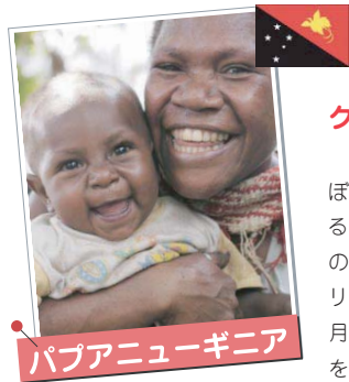
パプアニューギニア

二〇〇八年まであと数日。みなさんのあたらとし家では、どのように新しい年をむかえますか？ 今週は、世界の子もたちの新年の過ごし方を紹介します。みんなにとって、よい年がやってきますように！！