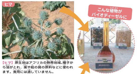
【ヒマ】 原産地はアフリカの熱帯地域。種子から油がとれ、葉や茎の真の原料などに使われます。食用には適していません。

農作物がバイオ燃料用に回されることで、例えば大豆など食料の値段が上がるなどの問題もあります。ブラジル政府は、使われていない農地を使って、食料にはならないジャトロファなどの栽培に力を入れています。