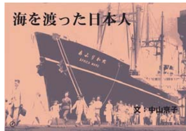
海を渡った日本人