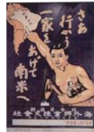
日本人移民の歴史を伝えるJICA横浜海外移住資料館の展示（右の紙芝居も）