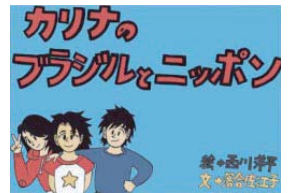
日系人の暮らしが分かる紙芝居

横浜市西区のJICA横浜海外移住資料館（☎045・663・3257）では、日本人の海外移住の歴史とその子孫である日系人の暮らしについて展示しています。移民カルタや紙芝居もあって、楽しみながら理解を深めることができます。