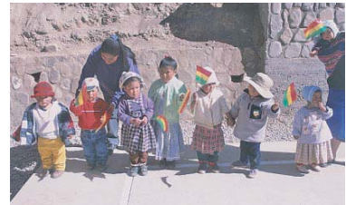
ボリビアの子供たち

ボリビア政府は、日本や国際機関や民間の団体などと協力して、すべての子どもたちが教育を受けられるように、さまざまな活動をしています。学費を出したり、学校で朝食や学用品を配るなどしたりしています。