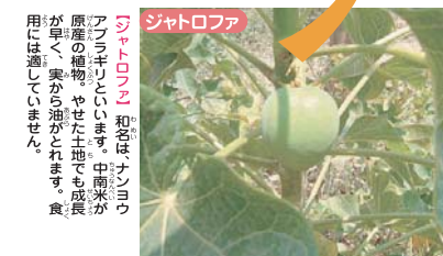
【ジャトロファ】 和名はナンヨウアブラギリといわれます。中南米が原産の植物。やせた土地でも成長が早く、実から油がとれます。食用には適していません。