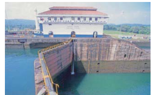
水門で水位を上げ下げして船を通します

パナマ運河が完成したのは、一九一四年。もうすぐ百年になります。運河がパンクするほど多くの船が通り、通れる船の大きさも長さ二百九十四メートル、幅三十二メートルとかぎりがあります。もっと大きな船も通れる「第三レーン」が二〇一四年に完成予定です。これからもパナマ運河は、たくさんの荷物を運んでくれるでしょう。