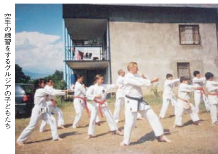
空手の練習をするグルジアの子どもたち

カスピ海と黒海に囲まれた地域は、「コーカサス」と呼ばれます。この地方は自然が豊か。グルジアでは、約八千年前からワインが作られており、ワイン発祥の地ではないかと考えられています。