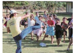
子どもたちもエアロビクスに挑戦

トンガの人の食生活は、最近急速に変わっています。かつては豊かな海産物やタロイモが主な食べ物でしたが、今では外国からの輸入品も多くあります。肉類やバター、砂糖などの消費が増え、肥満が社会問題になっています。ダイエットと健康のために運動を始める人が増えました。エアロビクスを教える日本人のボランティアもいます。