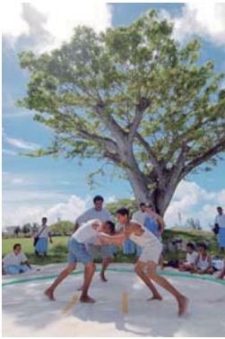
相撲をとる子どもたちも今月種別前撮り撮影