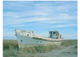
アラル海が干上がって、とりのこされた船

カザフスタンの面積は日本の約七倍。世界で九番目に大きい国で、カスピ海やアラル海に面しています。大相撲の世界では、カザフスタンの出身の力士もいますよ。しこ名は「風斧山」。「かざふざん」と読みます。