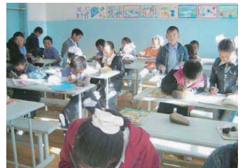
モンゴルの小学校

モンゴルは、教育をととても大切にしています。 大都市のゲルが集まる地区にも学校があります。ほとん どの学校では教室が不足しているために、全校児童が いっしょに授業を受けることができません。午前、 午後、夕方に児童を入れ替えて授業をするなどくふう をしています。中には、廊下でも授業をしている学校も あります。日本も新しい校舎を建てたり、飲み水を配る 施設を造ったりといろいろなお手伝いをしています。