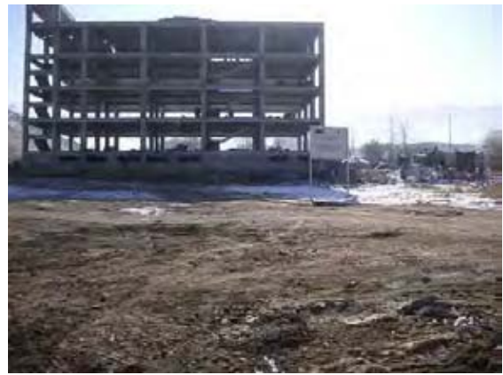
隣地に建築中の4F建ての事務所ビル。消防法による離隔距離を確保する必要がある