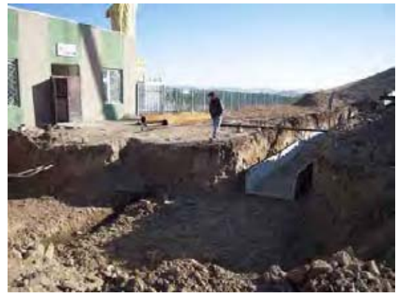
同左、温水暖房配管の工事状況。コンクリート製のカルバート内に設置する必要がある