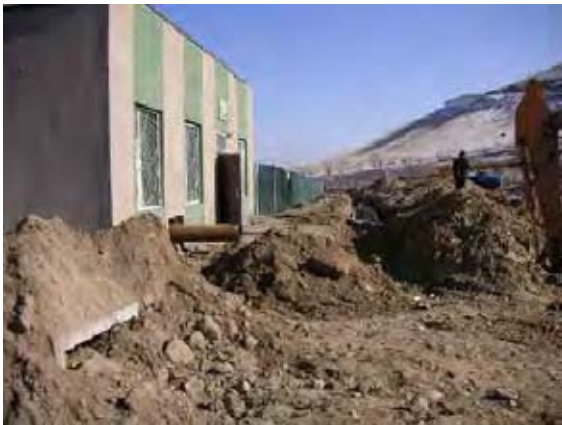
プロジェクトサイト北側にある温水暖房ポンプ小屋は民間の所有である。計画にあたっては、手前の道路からのアクセス路を確保する