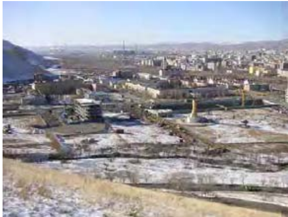
プロジェクトサイトは保護区に位置しており、景観への配慮が必要である