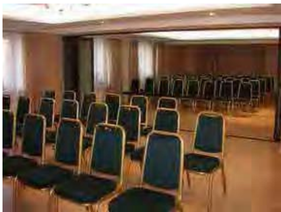
ウランバートル市内ホテルの研修室レンタル費は70人規模で$40/時間と高額である