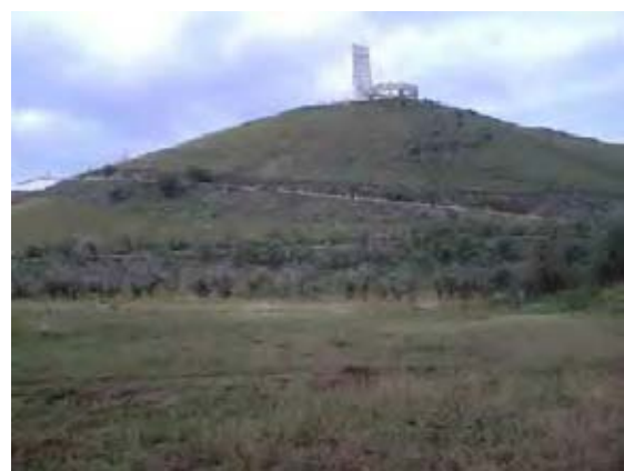
サイトから見たザイサン丘の眺望を考慮した施設設計方針とした