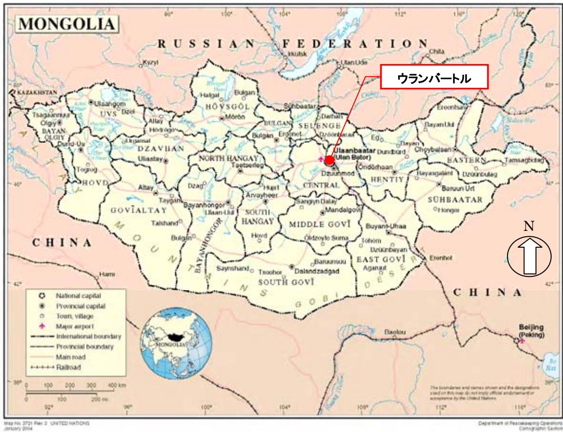
図 1-1 モンゴル全図