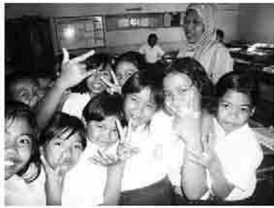
プレハブの校舎 体操服 制服とジルバブの写真を提示した。その他1枚