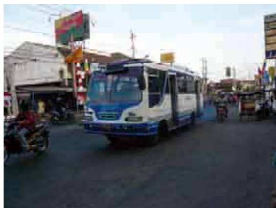
バス・ベチャ・渋滞の様子を提示した。