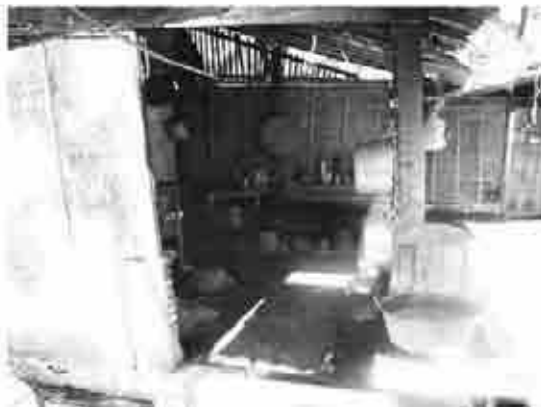
家の中は、リビングと台所に注目できるよう、提示した。その他2枚ずつ