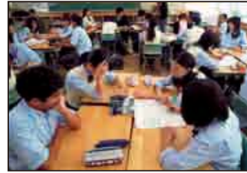
＜授業風景：班での話し合い＞