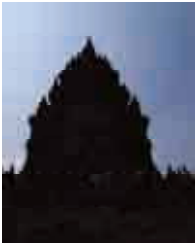
バティックの紹介