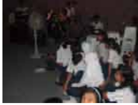
ビートルズの曲を合唱