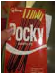
グリコのお菓子があり、日本とほぼ同じ価格

食品にある「ハラルマーク」の説明をする。 お菓子のどこについているか調べる。 日本の企業がインドネシアにも輸出し、インドネシア工場で生産している事を伝える。