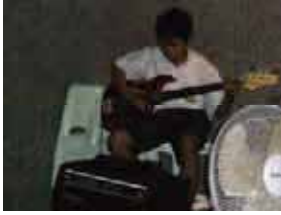
エレキギター練習