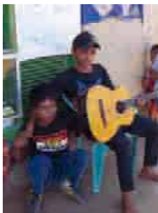
ギターを弾いて楽しむ青年