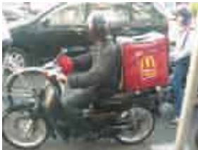
マクドナルドのバイク