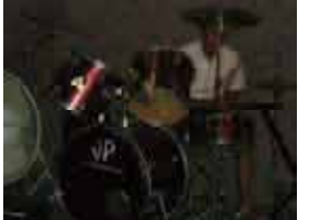
バンドを組んで演奏し、歌う音楽の授業 ドラムのセットを演奏する男子生徒の笑顔