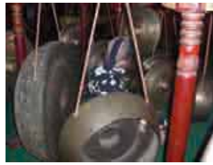
大きなドラの響く音に驚いた。 影絵のBGMにもガムラン音楽