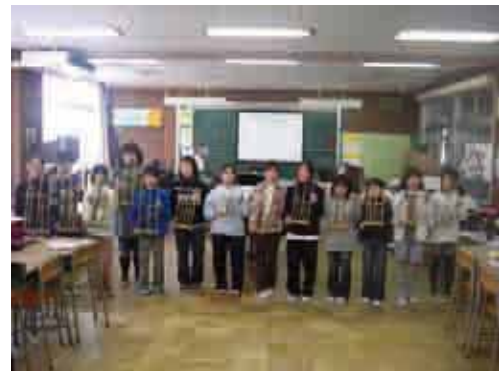
「音楽クラブ紹介」での演奏