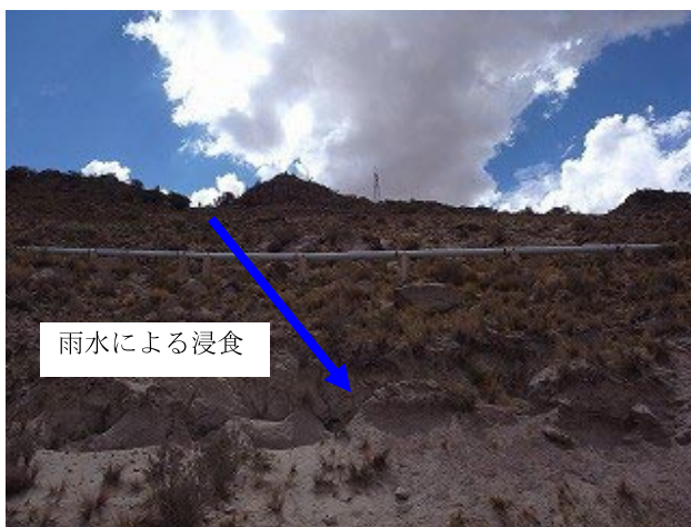
導水管の上部からの雨水によるガレーが出来つつあり、管の基礎を浸食する可能性が高い。本プロジェクトで排水路を設置し、浸食を防止する。