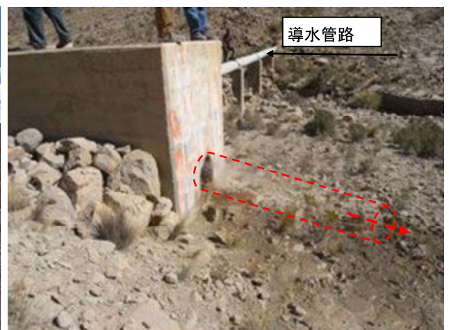
導水管路の排泥弁室に、排泥管が設定されていない。本プロジェクトで排泥管を設置する。