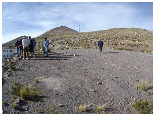
新設用地側から既設配水池を望む (上の写真の②)