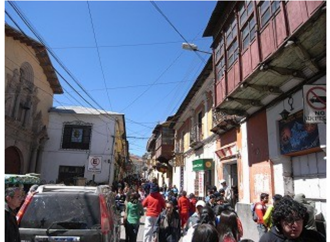
プロジェクトエリア内にある繁華街の様子。