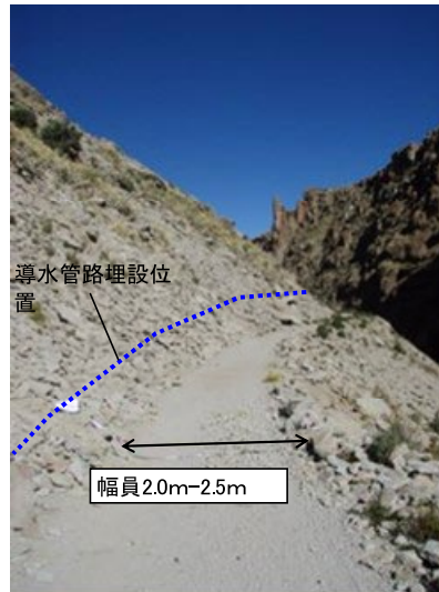
導水管の取水施設から+1.0km 付近の状況。導水管路敷設位置の上部の崖が非常に不安定で、落石・斜面崩壊の危険性がある。本プロジェクトで、上部の法面の保護を行う。