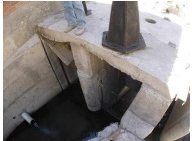
取水施設のゲートが劣化して開閉不可のため、本プロジェクトでゲートを交換する。