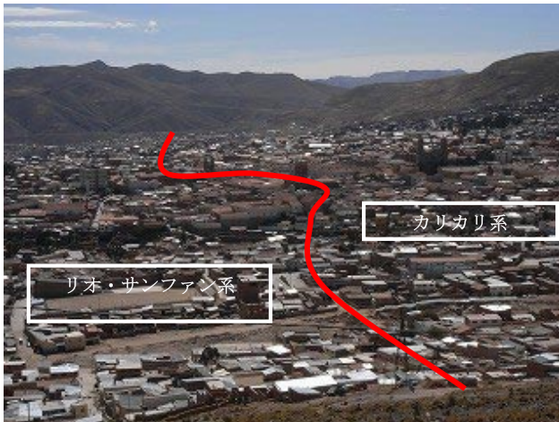
既設配水池からプロジェクトエリアを望む。