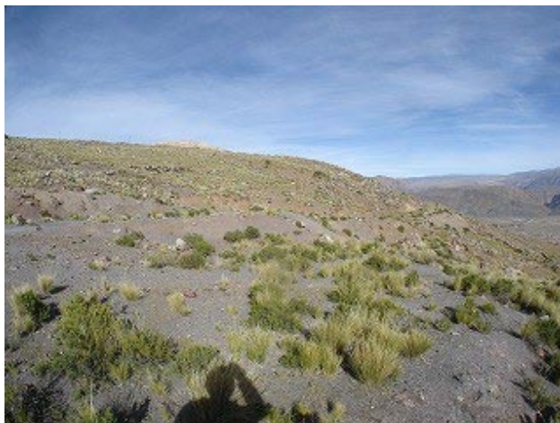
既設配水池側から新設用地を望む。(上の写真の①)