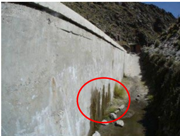
取水施設の調整池からの漏水。本プロジェクトで補修する。