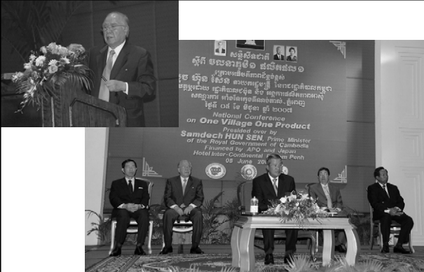
カンボジアで一村一品全国会議(2007年6月5日) プノンペン Cambodia National Conference on OVOP(June, 2007 at Phnom Penh)