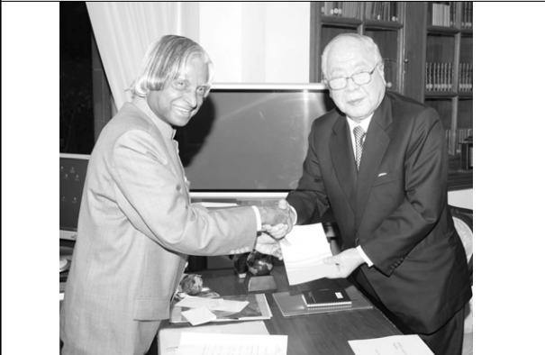
インド国アブドゥル カラム大統領と会見(2007年2月14日) Meeting with Dr. Abdul Kalam, President of India (2007, Feb.)