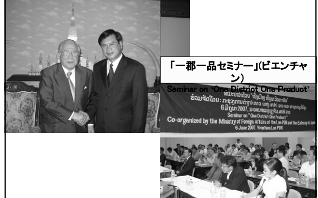
ラオス・ブアソン首相と会見(2007年6月6日ビエンチャン) Prime Minister Bouasone Bouphavanh of Laos (June, 2007 at Vientiane)