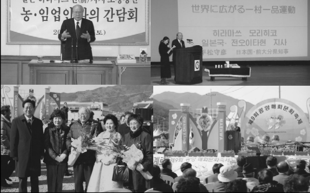
韓国光陽市との交流 (2005年3月) Visit Gwangyang City, Korea (March, 2005)