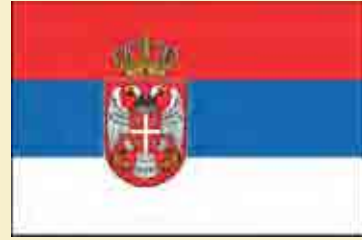
Republic of Serbia