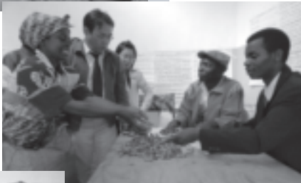
搾油前の品質チェック