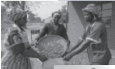
乾燥させたピーナツを選別して袋詰め