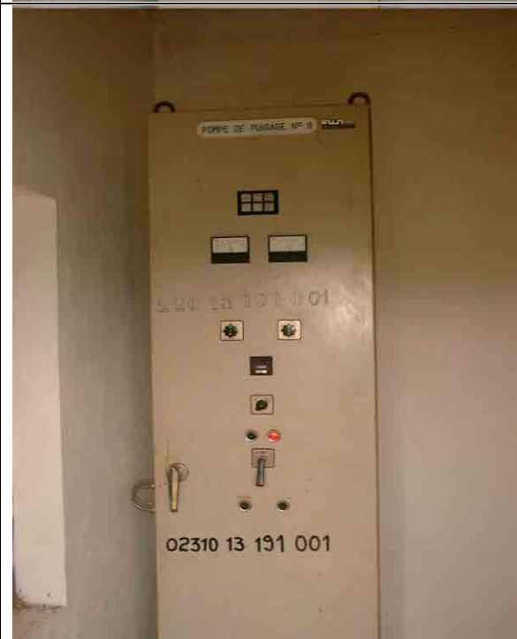
Well No.8: Operating Control panel