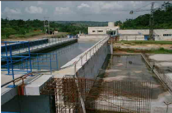
Sedimentation, Filtration and Operation Building