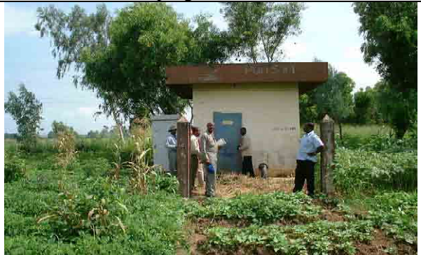
Well No.3: Collapsed in 2004