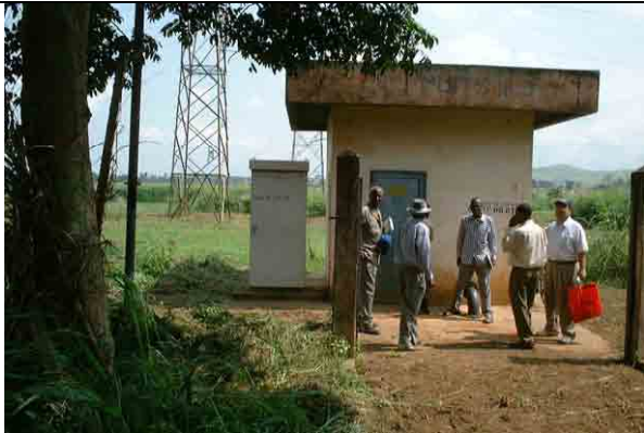
Well No.4: Dry up after 1 month