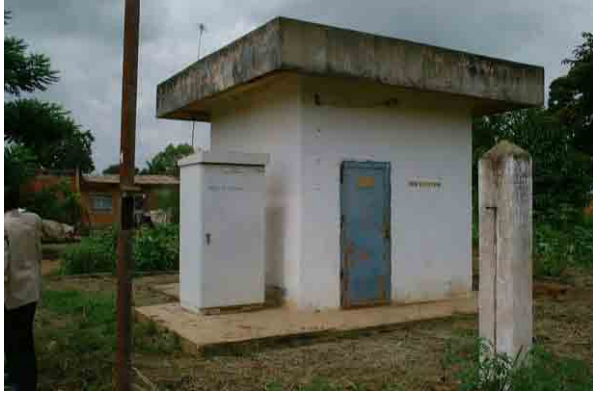
Well No.7: Dry up after 2 months