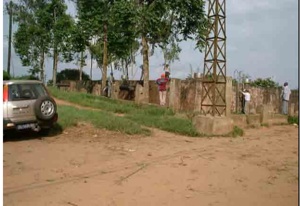
Main Reservoir (1,200 m 3 )