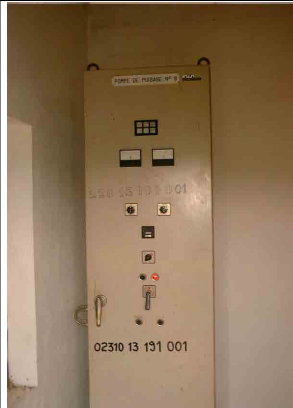
Well No.6: Operating Control panel