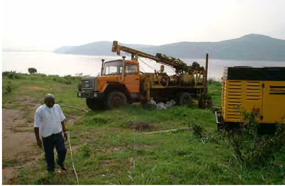
Track Mount with Percussion Type Drilling Machine