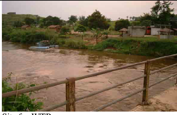
Site for WTP