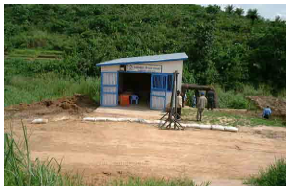
Temporary intake pump station