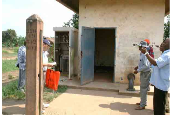
Well No.1: Dry up after 2 months Pumping test: 50m 3 /h