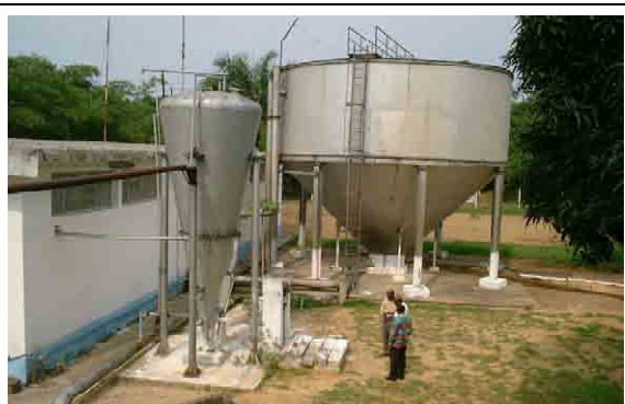
Compact Unit maid in DRC Coagulation and Sedimentation