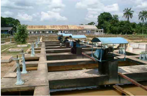
Overview Coagulation, Sedimentation and Filtration