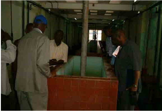
Mixing Tank for Coagulation