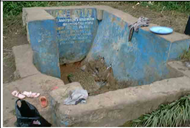
Communal Water Supply Pint at the Kusukusu River