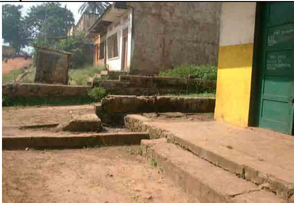
Tap Stand constructed by REGIDESO