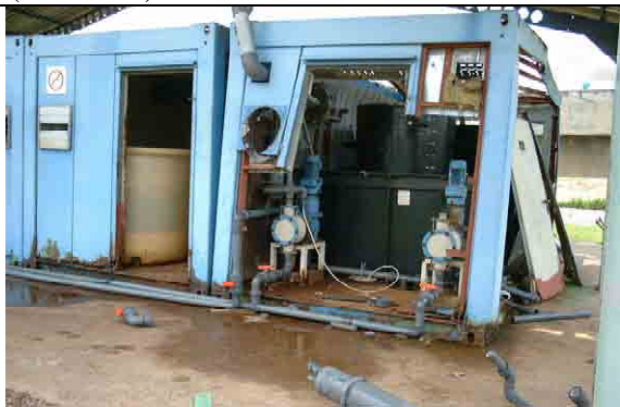
Chlorine Dosing Pump