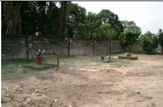
Two Boreholes Yield: 20 m 3 /h/borehole Only one borehole is operating