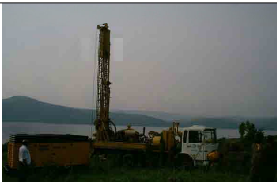
Track Mount of Reverse Type Drilling Machine