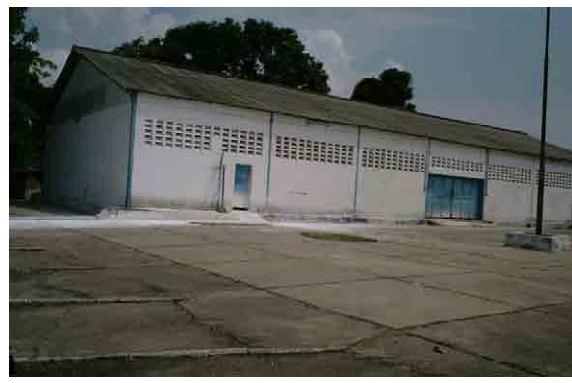
Storage Yard (Area for the expansion of WTP)