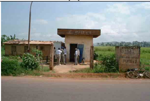
Well No.2: Dry up after 2 months Result of pumping test: 20m 3 /h Depth of drawdown: 67.8m