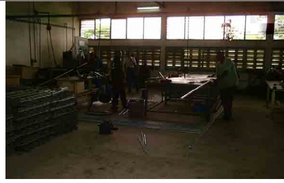
Workshop for assembly of water meter