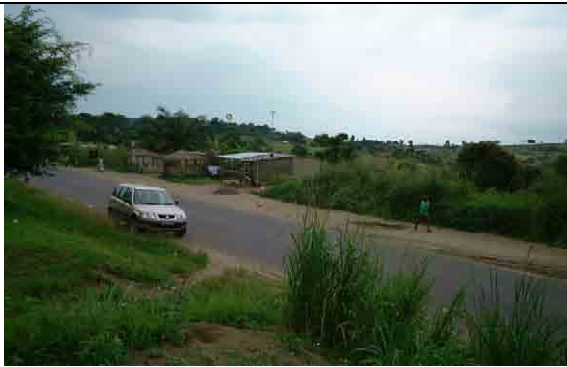
Expansion area in Mitendi