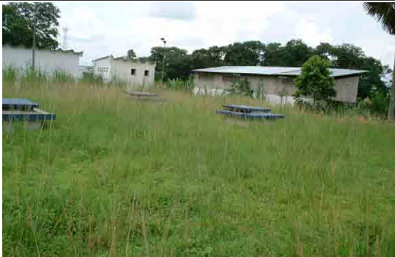
Reservoir and Pump Station