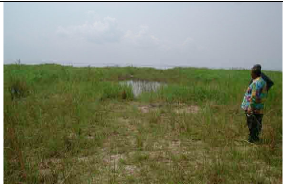
Area for construction of a new WTP on the Congo River