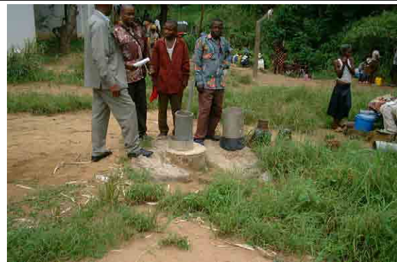
Dry well constructed by REGIDESO