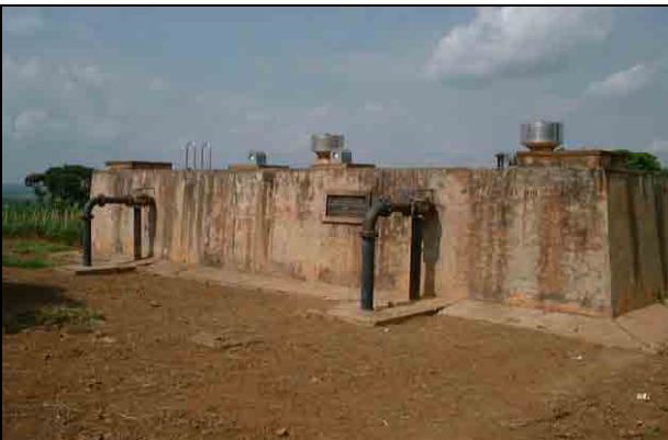
Reservoir (400m 3 )