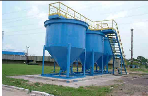
Mixing Tank for chemicals