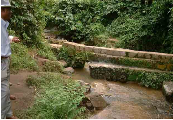
Kusukusu River and Vacant lot of the abounded WTP