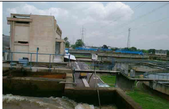
Existing facilities (Coagulation, Operation Building, Sedimentation) Under rehabilitation with the assistance of WB (Mod.1&2)