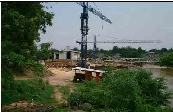
Intake facilities Under construction with the assistance of WB (Mod.3)