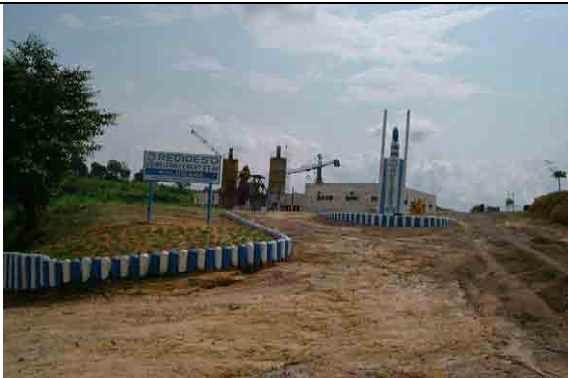
Overview Under construction by REGIDESO (Completed in 2008)