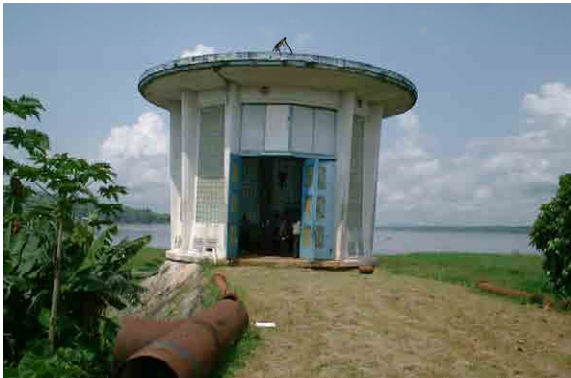
Intake Pump Station