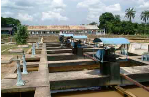
Overview Coagulation, Sedimentation and Filtration