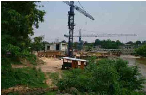
Intake facilities Under construction with the assistance of WB (Mod.3)