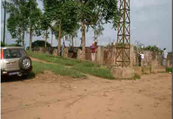
Main Reservoir (1,200 m 3 )