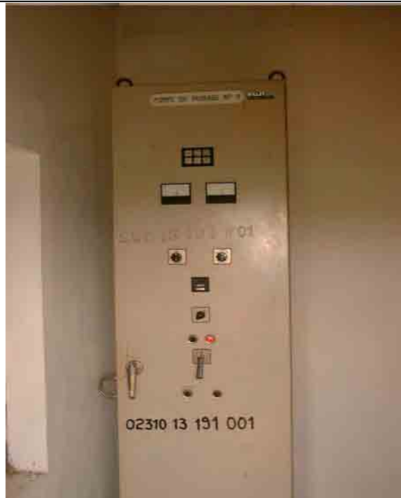
Well No.8: Operating Control panel