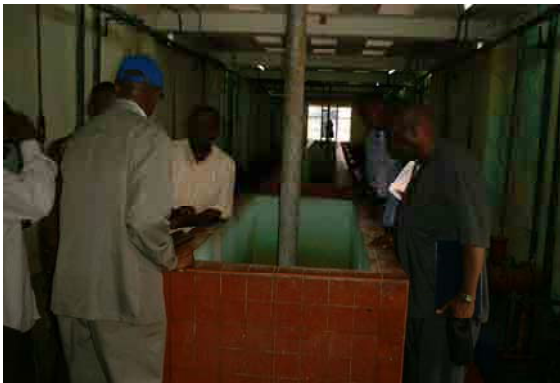
Mixing Tank for Coagulation