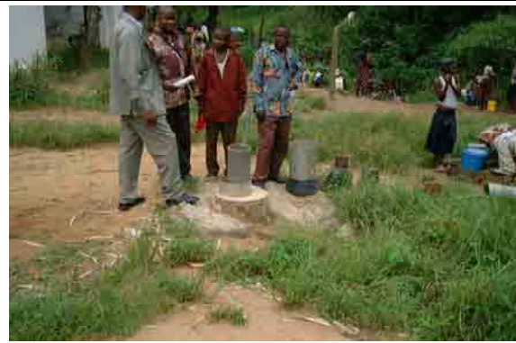
Dry well constructed by REGIDESO