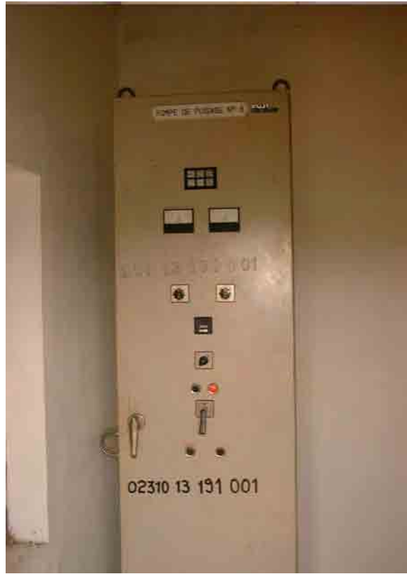
Well No.6: Operating Control panel