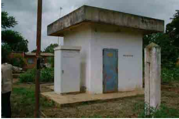
Well No.7: Dry up after 2 months