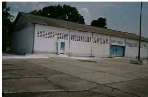
Storage Yard (Area for the expansion of WTP)