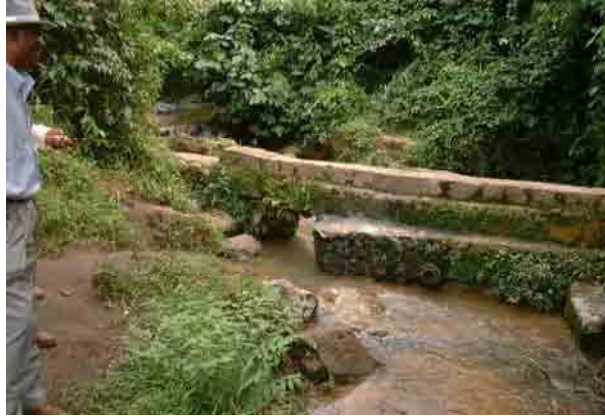
Kusukusu River and Vacant lot of the abounded WTP