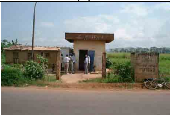
Well No.2: Dry up after 2 months Result of pumping test: 20m 3 /h Depth of drawdown: 67.8m