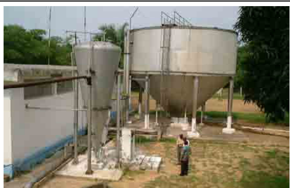
Compact Unit maid in DRC Coagulation and Sedimentation