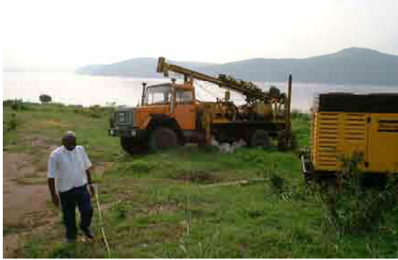
Track Mount with Percussion Type Drilling Machine