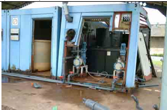
Chlorine Dosing Pump