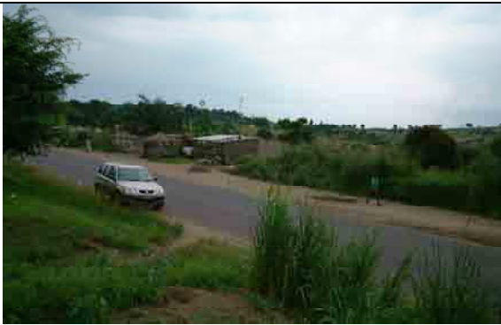
Expansion area in Mitendi