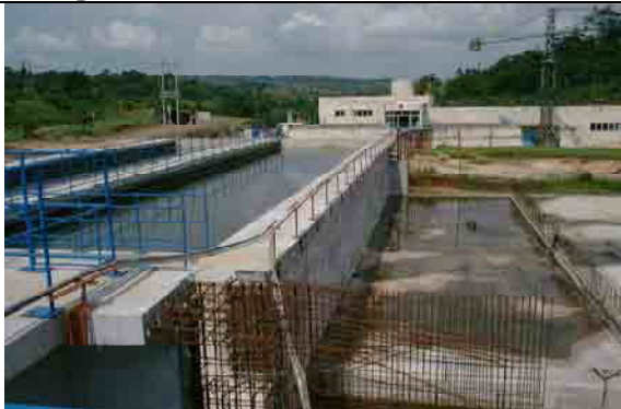
Sedimentation, Filtration and Operation Building