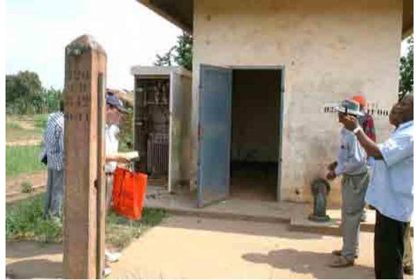
Well No.1: Dry up after 2 months Pumping test: 50m 3 /h