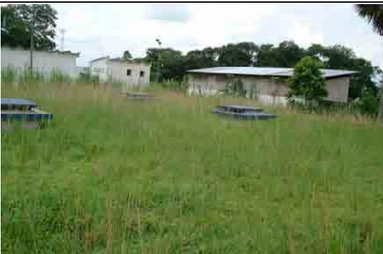
Reservoir and Pump Station