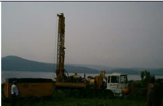
Track Mount of Reverse Type Drilling Machine