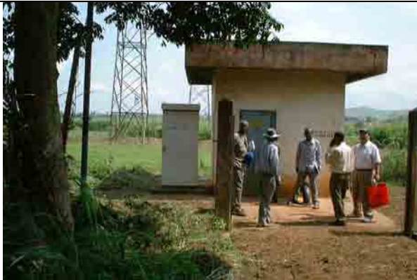
Well No.4: Dry up after 1 month