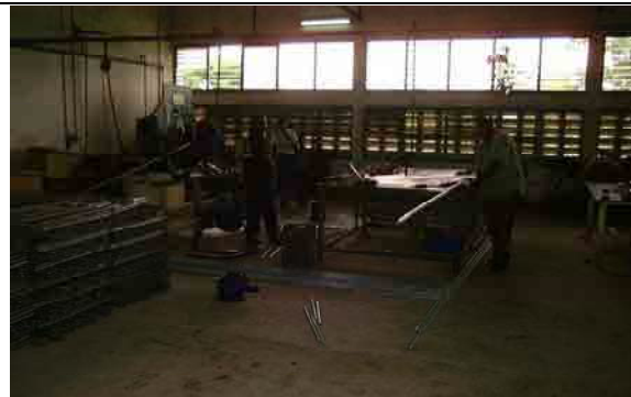
Workshop for assembly of water meter