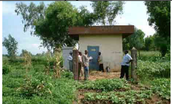
Well No.3: Collapsed in 2004