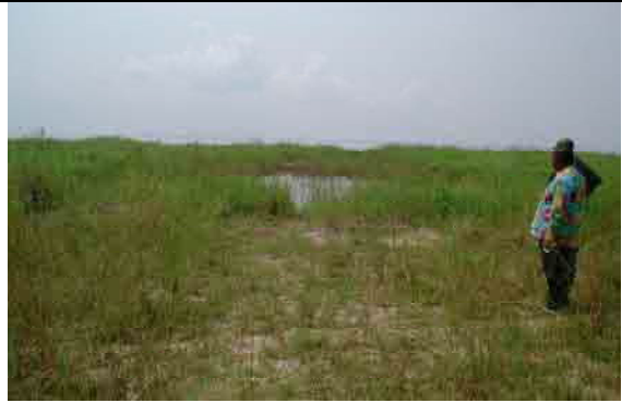
Area for construction of a new WTP on the Congo River