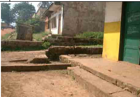
Tap Stand constructed by REGIDESO