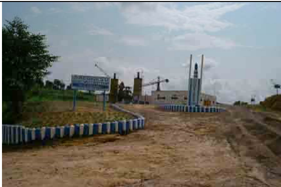
Overview Under construction by REGIDESO (Completed in 2008)