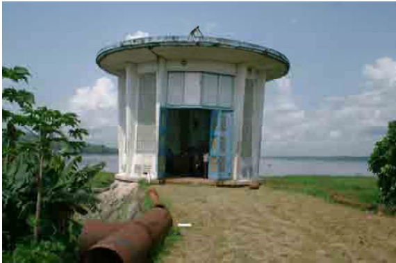
Intake Pump Station