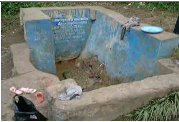
Communal Water Supply Pint at the Kusukusu River