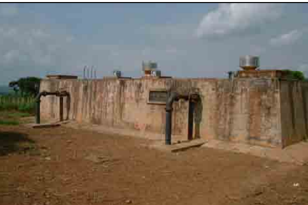
Reservoir (400m 3 )