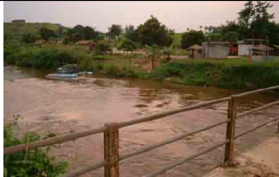
Site for WTP