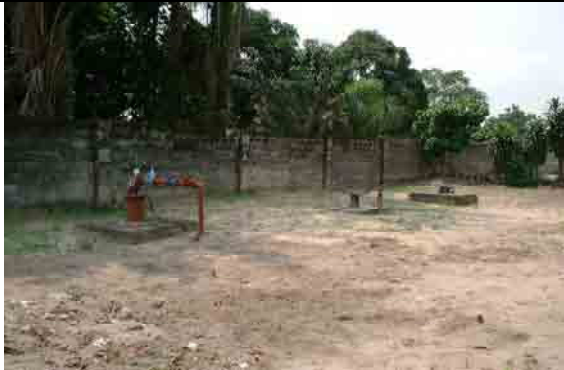
Two Boreholes Yield: 20 m 3 /h/borehole Only one borehole is operating