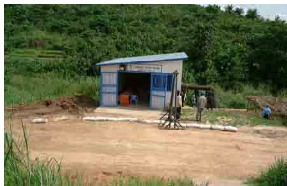
Temporary intake pump station