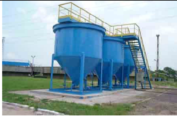
Mixing Tank for chemicals