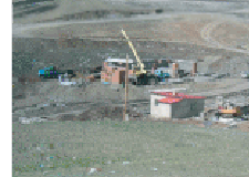
Фото зураг 2. Автогужийн хяналтын байр ба дулаан гараж (зурагны зүүн хэсэгт орох хаалга байна)