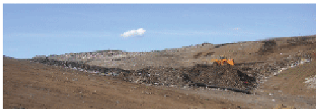
Фото зураг 1. Хамгаалах далангийн барилгын ажил

Хамгаалах далан байгуулсанаар хогийн цэгийн хил хязгарыг тодорхой болгож хотны мөвчинүүд эвдэж айлзлуу сууриндуулах жаалгаар хогийн цэг рүү нэвтрэх болсон.