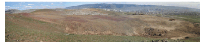
Өдөөгийн байдал (6 дугаар сарын эцэст) Фото зураг 3 ба 4. Хогийн цэгийг хөлд зүгээр харж байдал (зүүннэ ландфил)