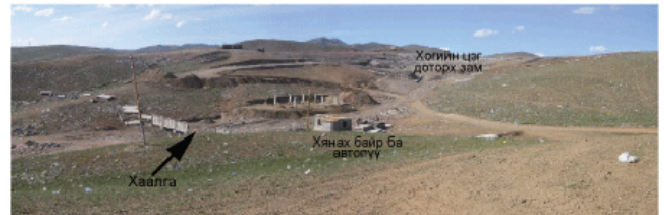
Өдөөгийн байдал (8 дугаар сарын эцэст) Фото зураг 5 ба 6. Хогийн цэгийг зүүн зүгээр харж байдал (хаалга ба хогийн цэг доторх зам)