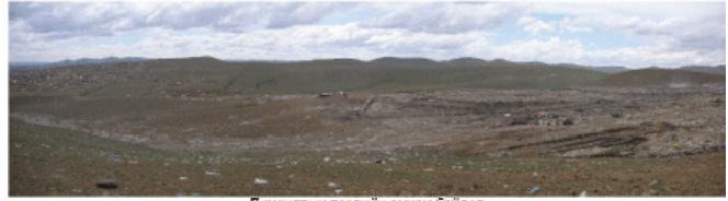
Туршилтын төслийн өмнөх байдал

Түүнчлэн хогийн цэг дээр хоёр ч уулзалт зохион байгуулж туршилтын төсөл батлан шинэ ландфилын төлөвлөгөө талаар хог түүтч нарт танилбар хийв.