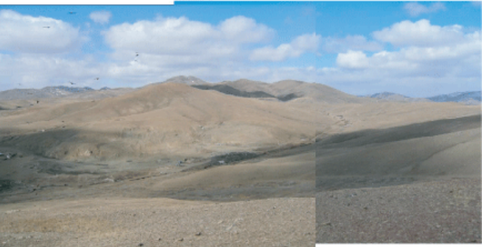
Фотс 5. Нарангийн энгэр