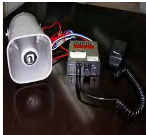
Дуудлагын тогтолцооны чанга яригч ба дуу өсгөгчийн систем