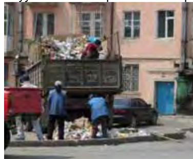
Хог ачих одоогийн нөхцөл байдал

Зураг 6-53: Хог хаях ил цэг болон төслийн хамрагдах хүрээнд хог ачиж байгаа нь Улаанбаатар хотод ЗР –ийг дэмжихийн тулд судалгааны баг төлөвлөгөөт бүсэд ангилан ялгах тогтолцоог хэрэгжүүлэхийг мастер төлөвлөгөөнд санал болгосон. Дээр дурьдсанчлан хог ачиж цуглуулах тогтолцооны хог ачих хуваарь нь тогтмол бус болон