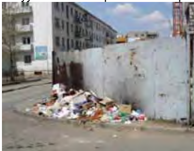
Оршин суугчдын шинээр бий болгосон шинэ хогийн ил цэг