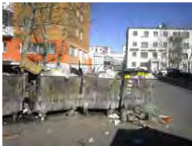
Өмнөх хог хаях цэг