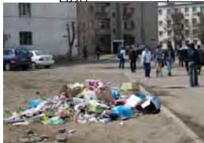
Хуучин контейнер байсан газар