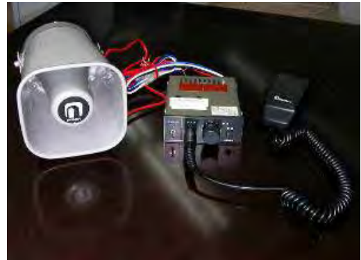
Дуудлагын тогтолцооны чанга яригч ба өсгөгч

Хог хаях журам нэвтрүүлэхийн тулд дараах арга хэмжээ авав.