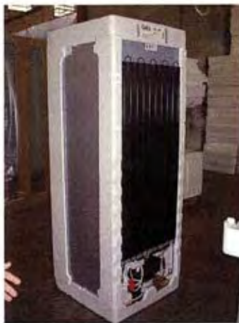
Mejoramiento del embalaje externo de una heladera Vista del embalaje mejorado, antes de su envoltura con film contraible