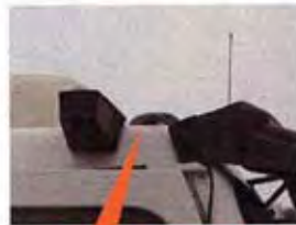
Instalación antena GPS

Vistas de detalle de la instalación de los equipos de medición (GPS y Data Logger)