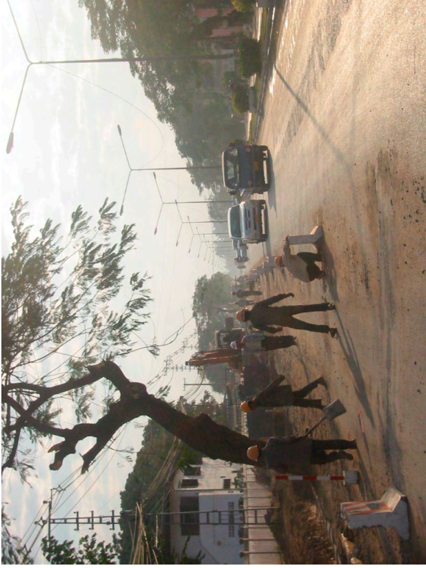
工事中のヴィエンチャン1号線(無償)