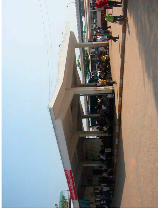
混雑するバスターミナル