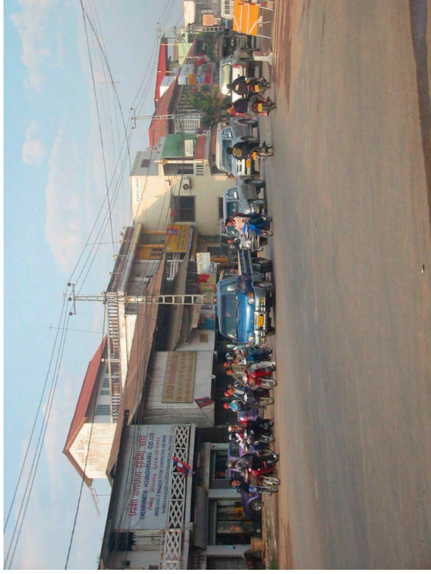
朝の通勤時間帯の交通状況