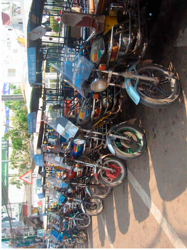
トゥクトゥク乗り場