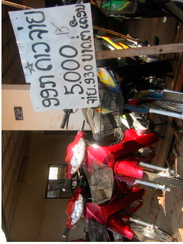
モーターバイクの販売店