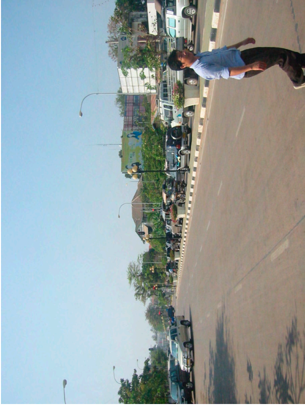
ランサーン通り 日中の交通状況