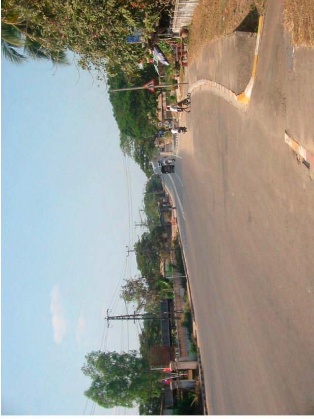
整備済みのヴィエンチャン1号線(無償)