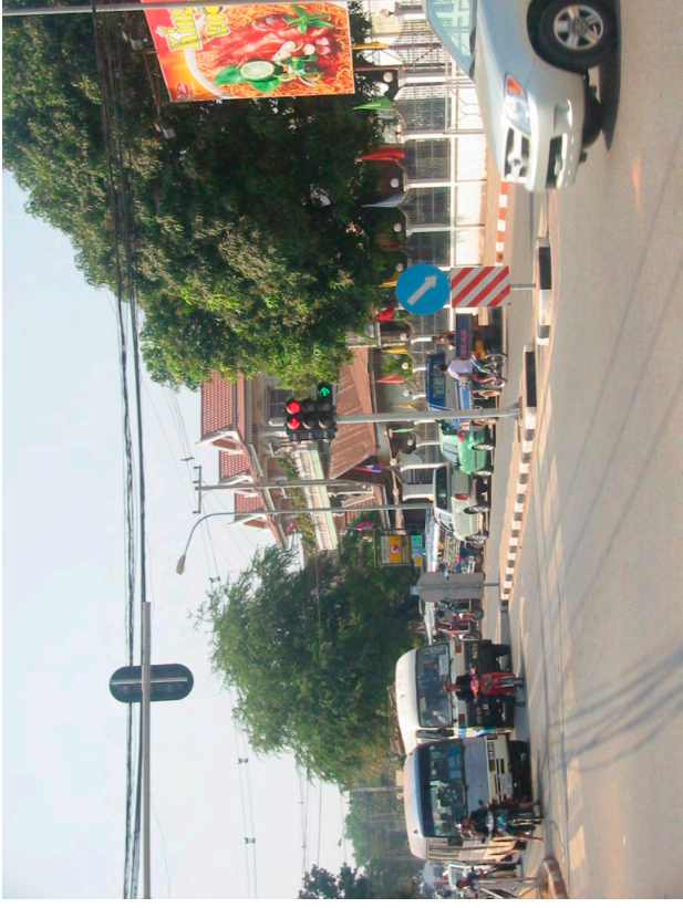
信号機（フランス供与）