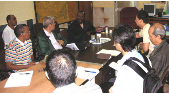
タジュラ州知事との協議