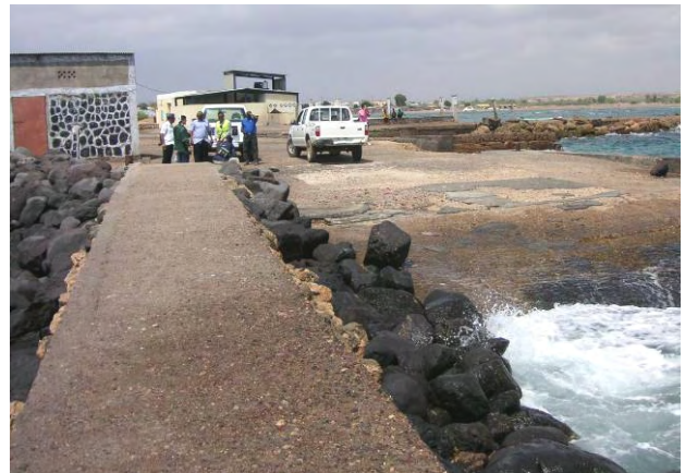
スリップウェイ及びアプローチ施設