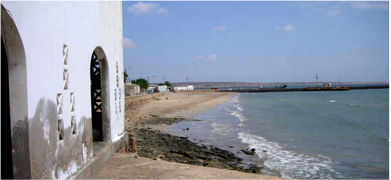
州庁舎からオボック港湾施設を望む