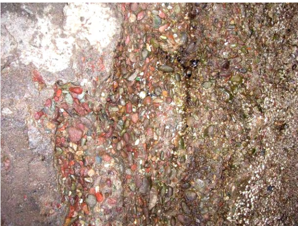
スリップウェイコンクリート劣化状況