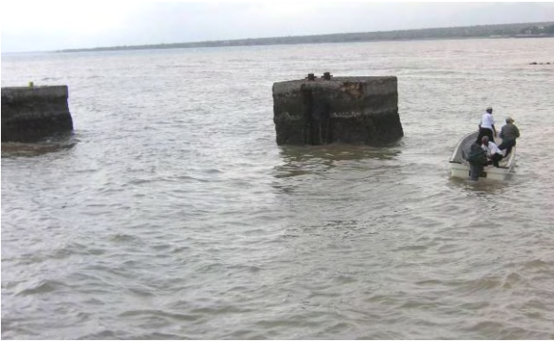
フェリーターミナル周辺の深度調査