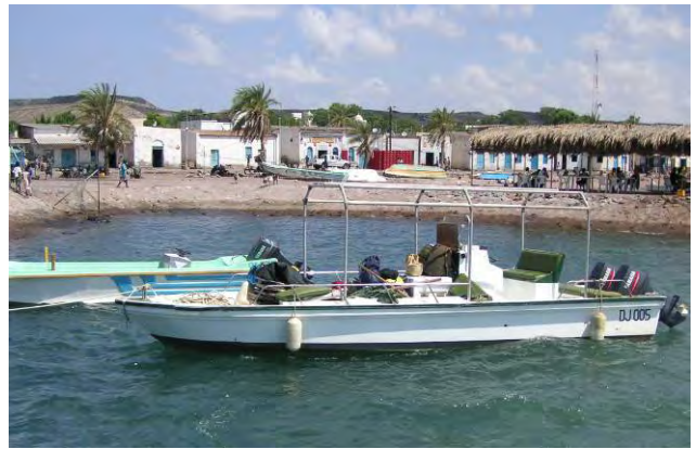
観光船と漁港施設の状況