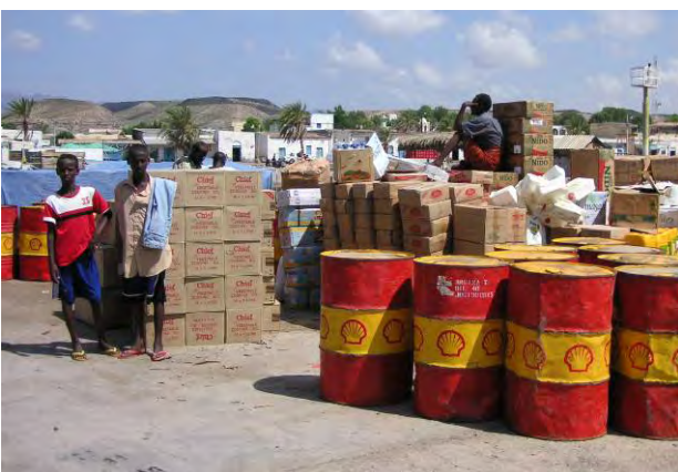
ダウ船から陸揚げされた貨物