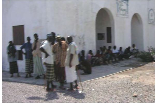
ステークホルダー協議参加者