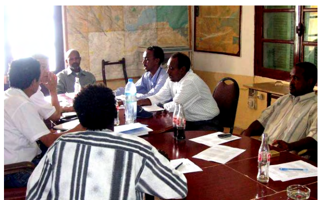
ステークホルダー協議