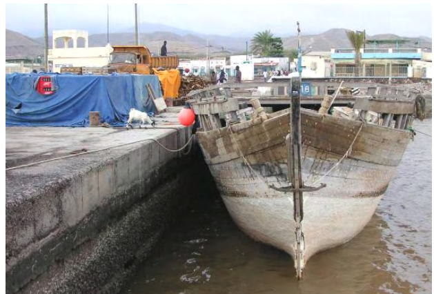
ダウ船の港湾利用状況