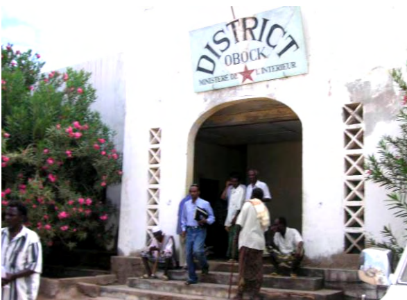
州庁舎とステークホルダー協議参加者