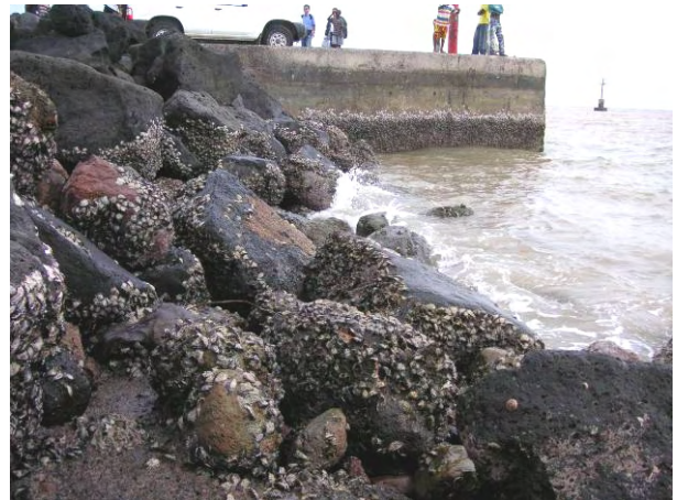
護岸と生物付着状況