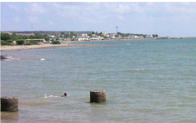
タジュラ港と市街を望む海岸