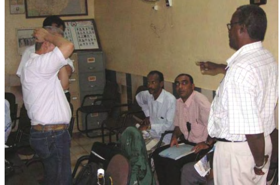
ステークホルダー協議打合せ