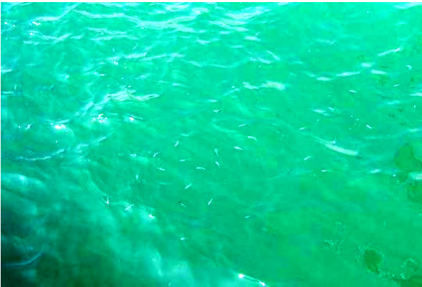
港湾岸壁に棲息する稚魚の群れ