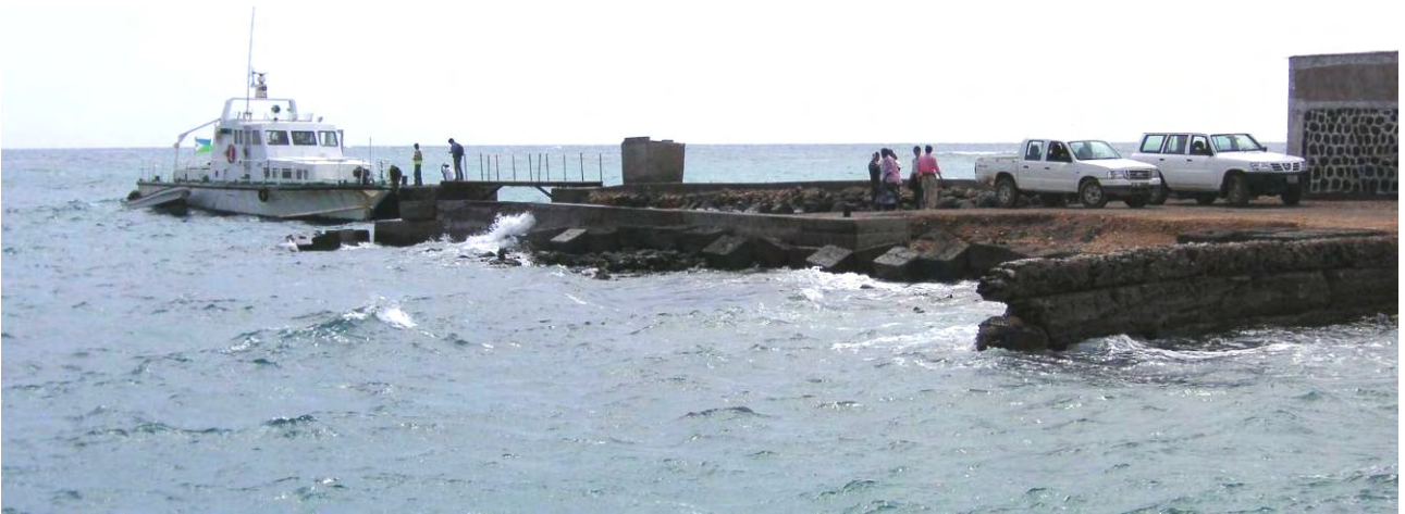
オボック港フェリーターミナル全景