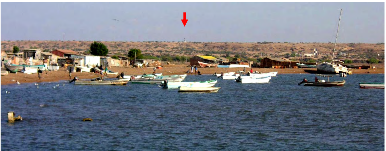
漁船と港湾に隣接する漁村(灯台→)