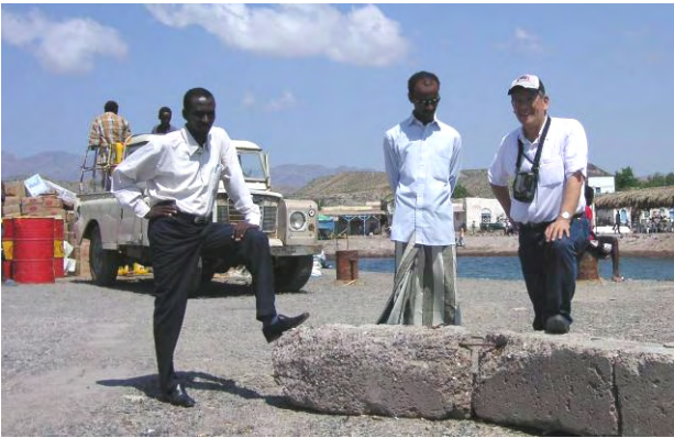
タジュラ州副知事との港湾環境調査