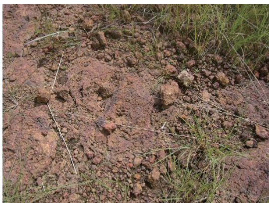
地盤 (ラテライト岩盤)