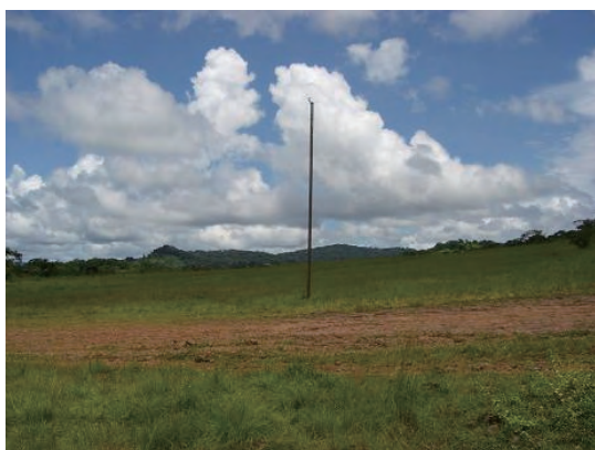
敷地 (敷地南側から北側を見る)