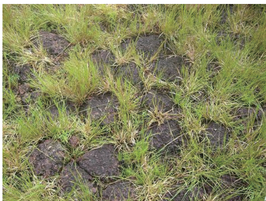
地盤 (ラテライト岩盤)