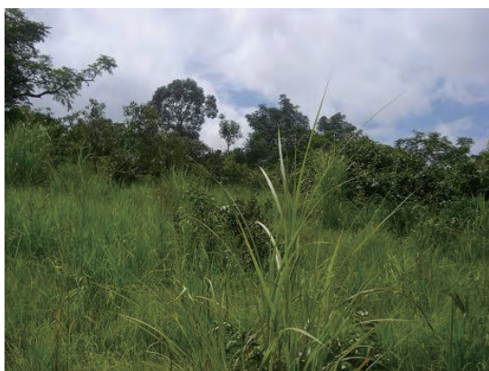
敷地 (敷地西側から東側を見る)