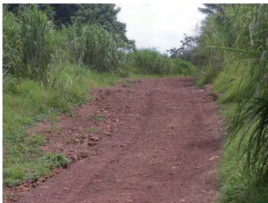
アクセス道路 (急な砂利道)