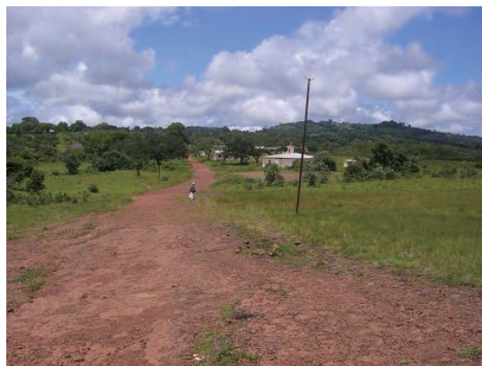
敷地前の全面道路 (ラテライトの岩盤道路)