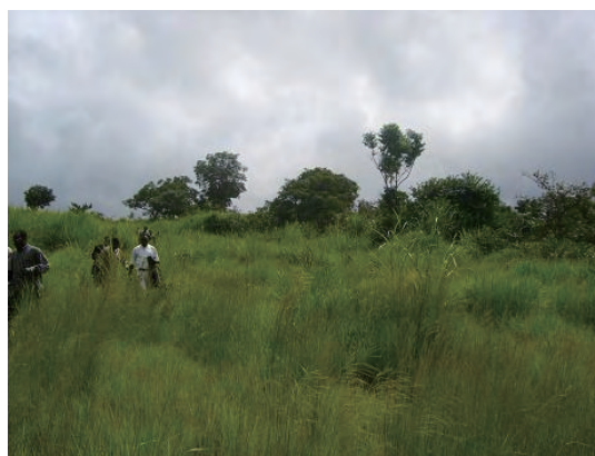
敷地 (敷地西側から北東を見る)