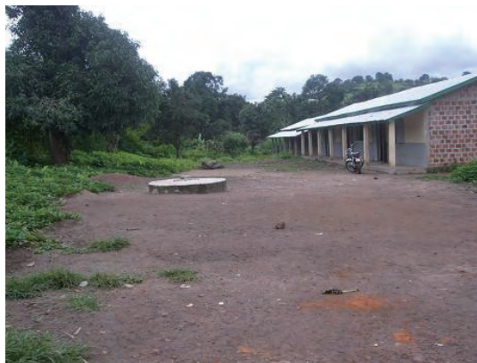
敷地近くにある民家の浅井戸