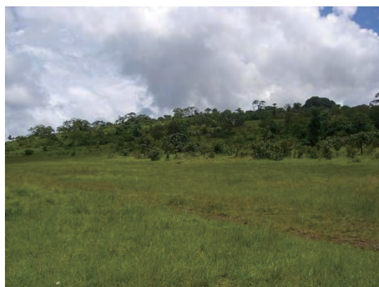
敷地 (敷地南側から北東を見る)