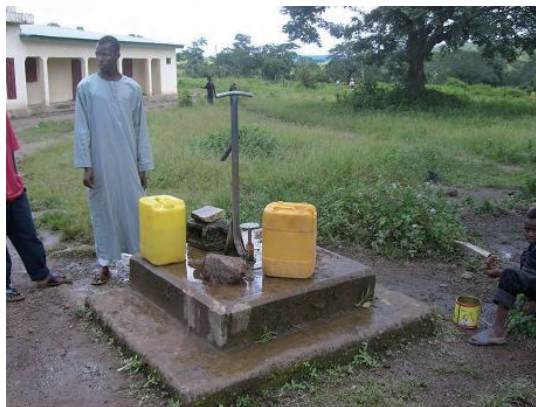
隣接地 (マムー工科大学) の 井戸