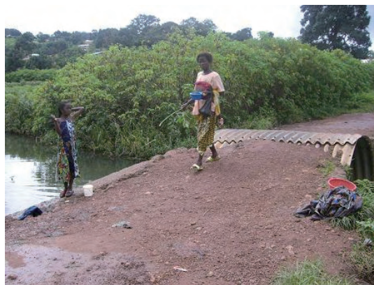
アクセス道路 (用水路の橋)