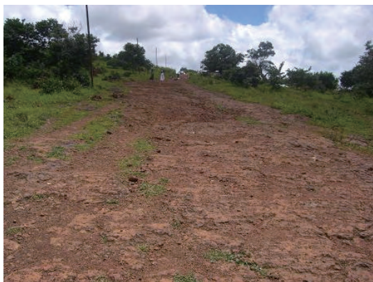
アクセス道路 (ラテライトの岩盤道路)