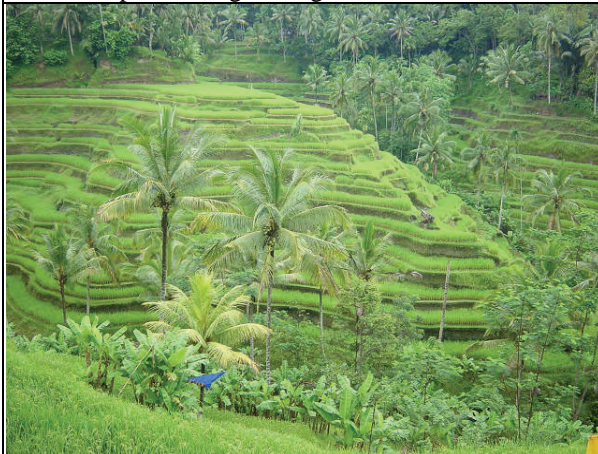
Persawahan di Desa Tegallalang

Mata air dengan debit melimpah berlokasi di Abang Kab. Karangasem. Mata air ini dikelilingi pura. Air dari mata air ini digunakan untuk irigasi.