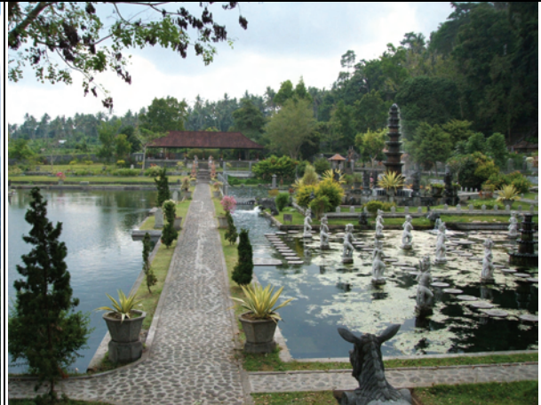
Mata Air Tirtaganga

Gunung Aktif yang terkenal, memiliki ketinggian 1.717m sama halnya dengan G. Agung yang memiliki ketinggian 2.567m. Berada di Kintamani yang memiliki pemandangan sangat indah di Bali.