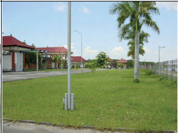
Instalasi Pengolah Air Muara

Bendung muara ini berada di mulut Sungai Badung, Air yang tertampung digunakan untuk IPA muara. Volume tampungannya ekuivalen dengan operasi setengah bulan dari instalasi.