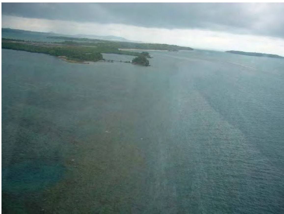
ギマラス島南西端沖に確認された浮流油