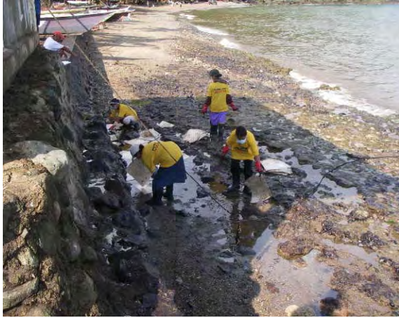
ギマラス島における油回収活動状況