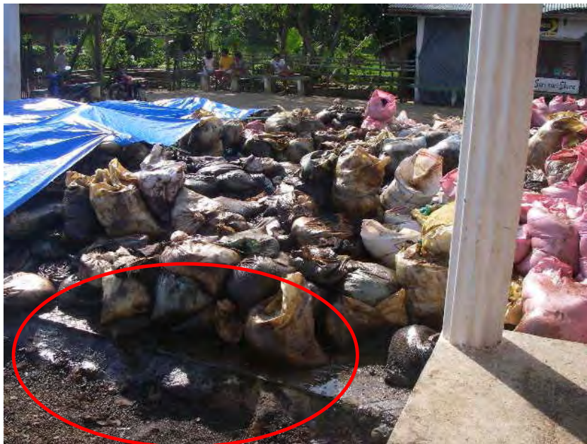
漏れ出している油