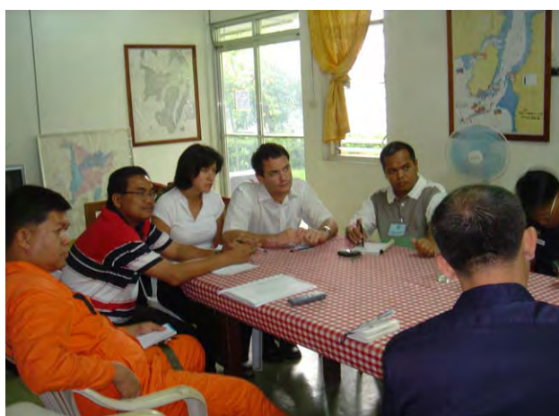
I TO PF