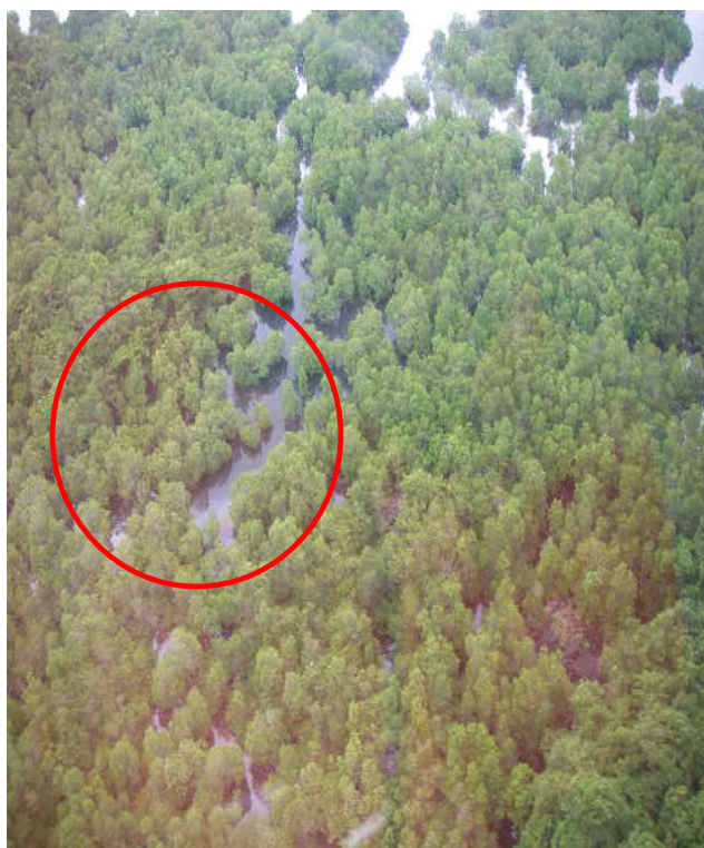
マングローブの奥にも油が確認