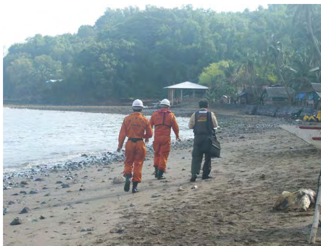
ギマラス島における現地調査活動