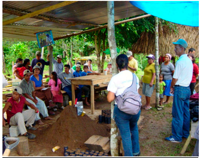
住民参加型ワークショップの様子 (サイト NEGRITA2)