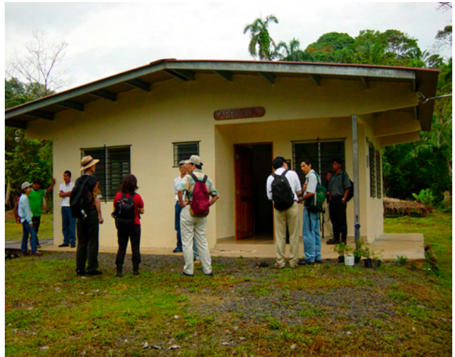
APRODECA (農民生産者協会) 事務所