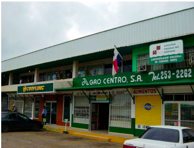
プロジェクト・オフィス (ラ・チョレラ)