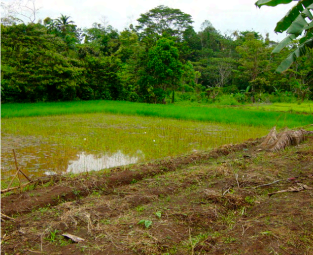
農民研修活動事例5 (NEGRITA 2 地区・水田稲作)