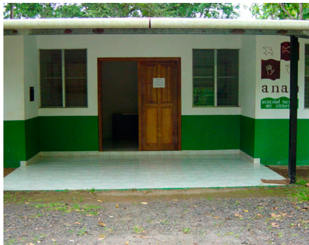
サブセンター (エル・カカオ)