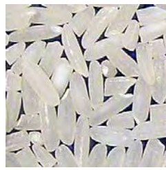
セネガル産 TCS10 (FCFA300/kg)