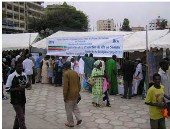
ダカール独立広場で開催された SENRIZ キャンペーン