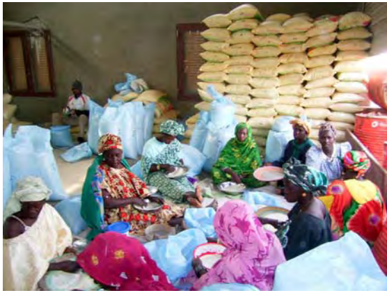
女性による夾雑物・着色粒の選別除去作業