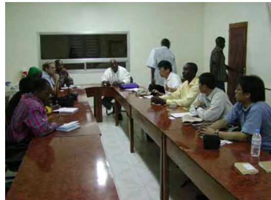
西アフリカ米開発協会（WARDA）との意見交換