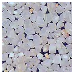
セネガル産 TCS10 (FCFA185/kg)