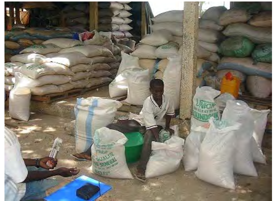
サンルイ市の精米取引所