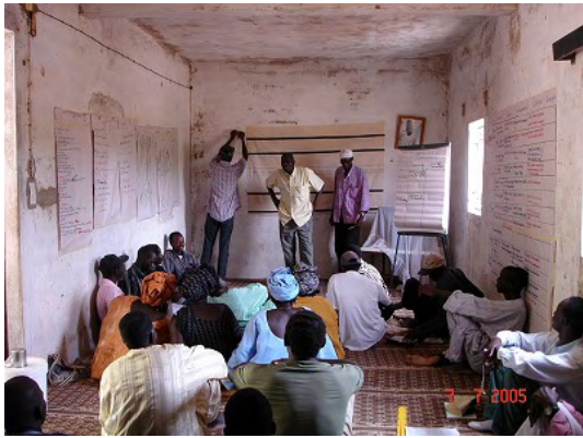
稲作技術改善に向けたワークショップ