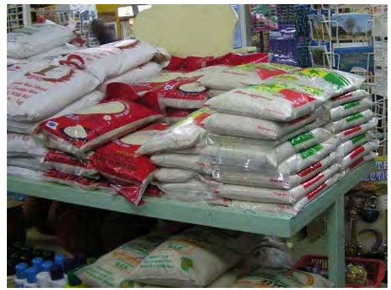
小売店に輸入米と共に陳列された SENRIZ