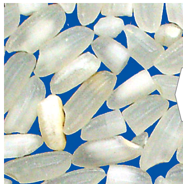
精米加工後の白米 碎米・着色粒が混在する