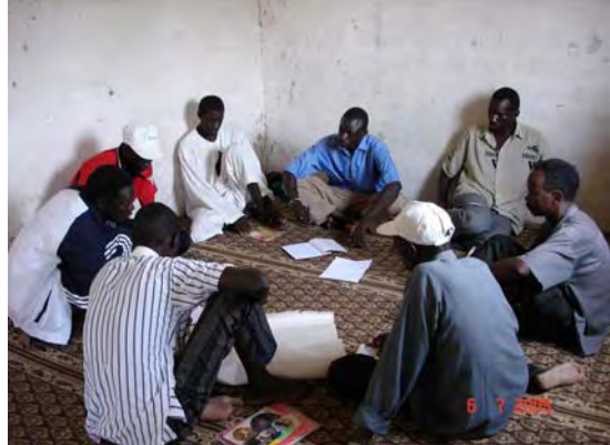
技術移転プログラム参加農民による問題分析