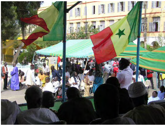
サンルイ市で開催された「国際コメ年」イベント