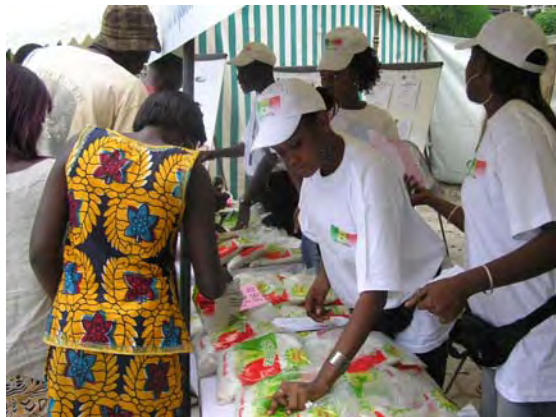
SENRIZ 完全米を品定めする消費者