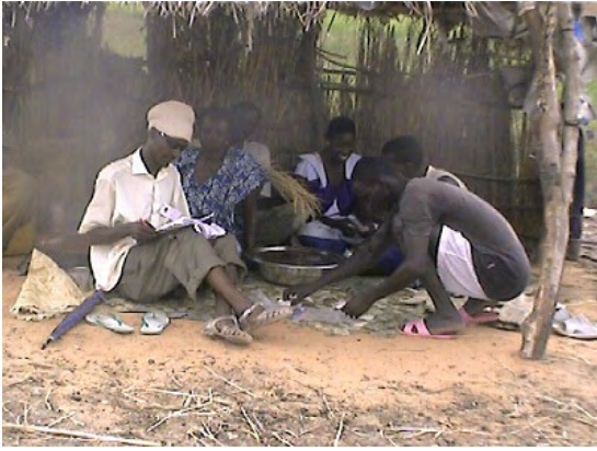
セネガル川流域農村におけるマーケティング調査