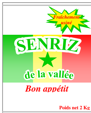
2kg に袋詰めされた SENRIZ ブランド米