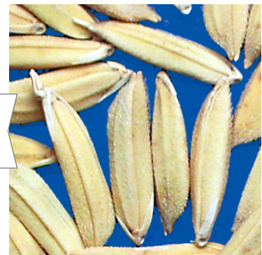
健全な籾 (品種: SAHEL202)