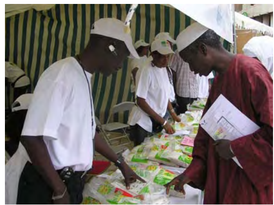
SENRI の品質について質問する消費者