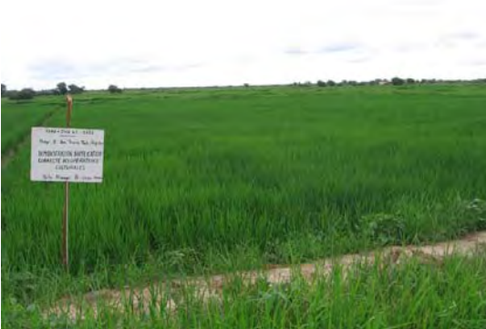
灌漑稲作技術改善のための展示圃場