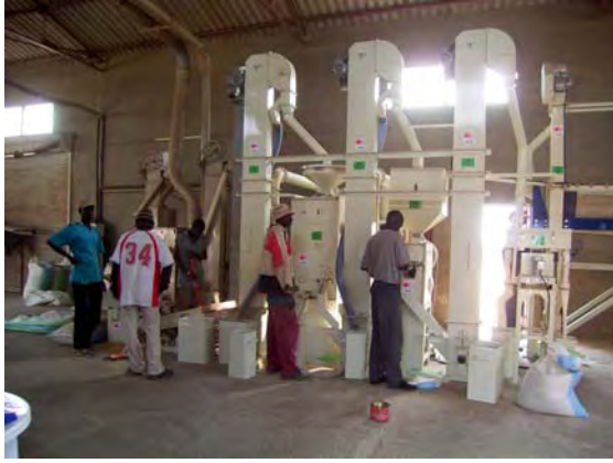
米品質向上の検証を目的に導入された精米機