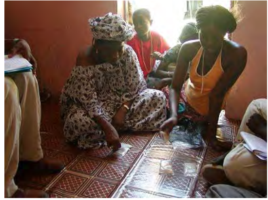
ダカール市内におけるマーケティング調査