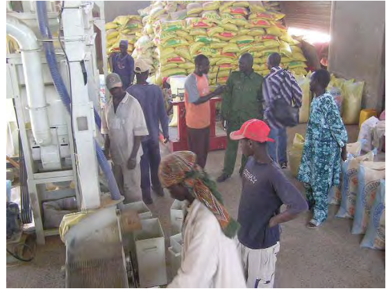
精米機の運転維持管理に係る技術指導