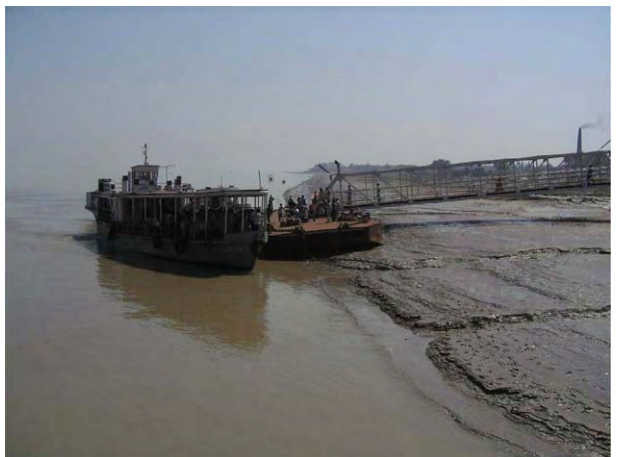
ハルディア側渡し舟乗り場