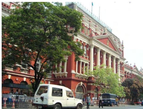
コルカタ 西ベンガル政府庁舎