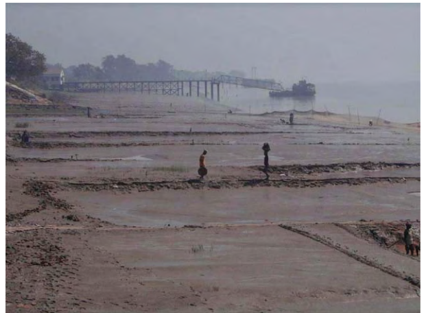
ライチャック側 渡し舟棧橋