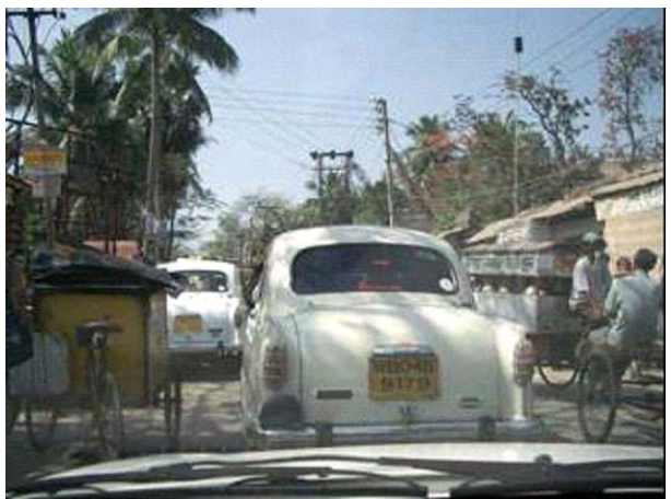
国道117号線が通過する集落部