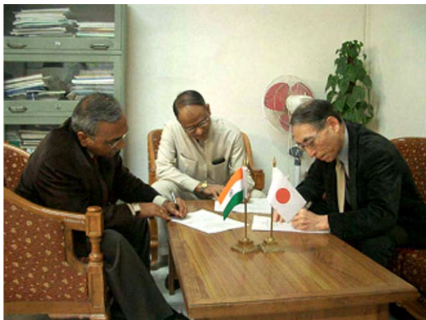
S/W、M/M 署名(於 港湾道路交通省)