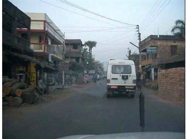
ククラハティ地点へのアクセス道(集落部)