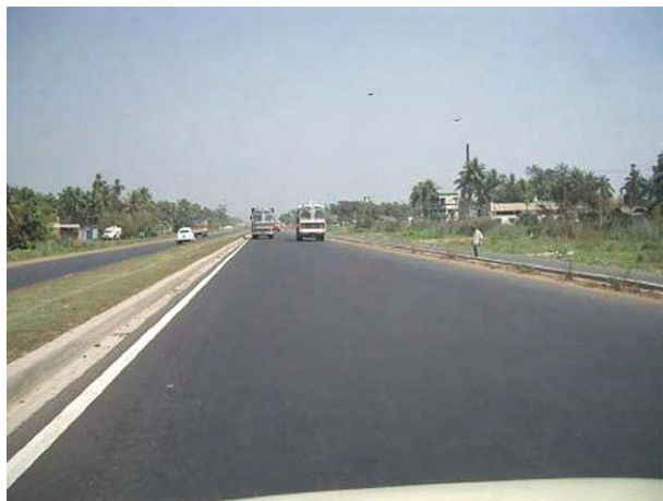
国道6号線(橋梁部や一部区間を残し4車線化)