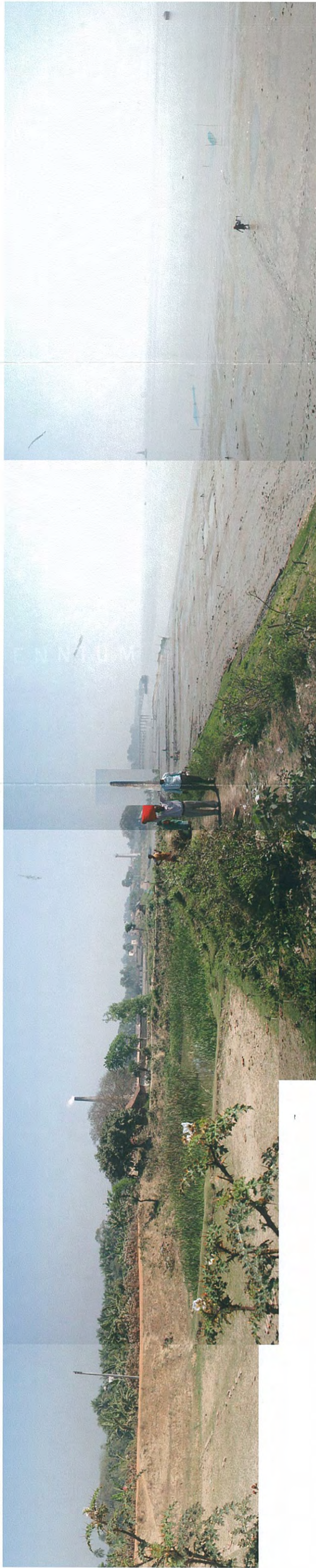
←東 南 西→ (河下)