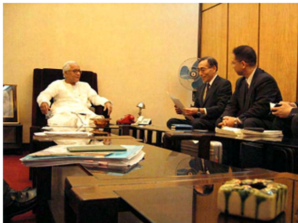
西ベンガル州首相表敬