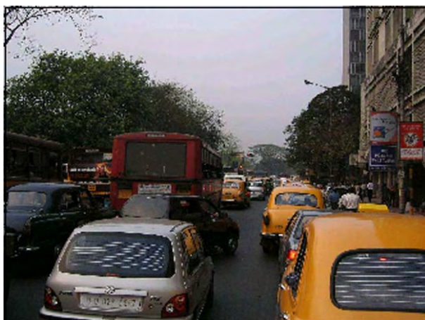
コルカタ市外の交通状況