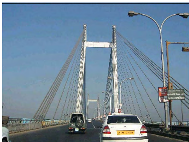
第2フーグリー橋(斜張橋)