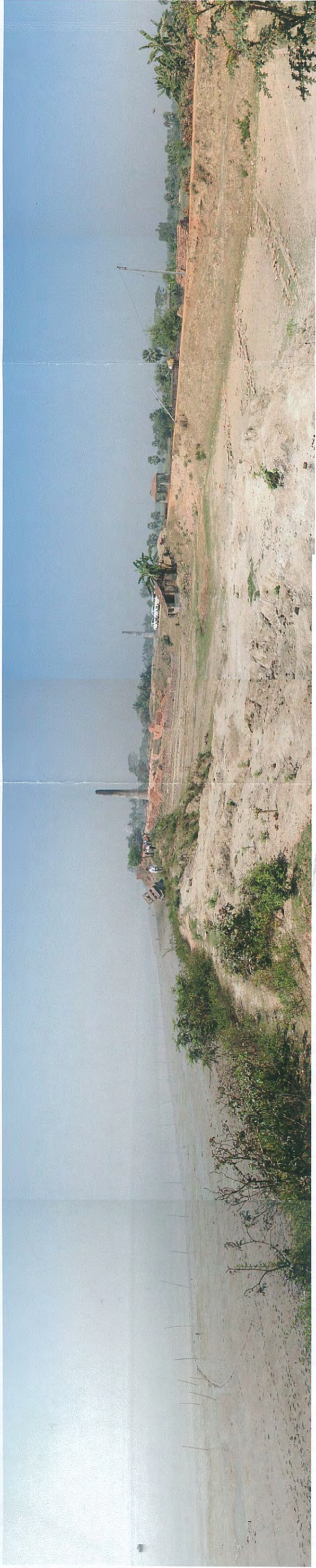
←西 北 東→ (河上)