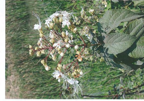
建設予定地の植生