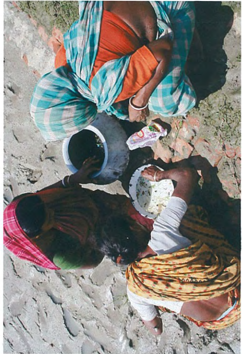
稚エビを採集する女性達