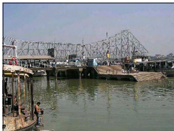
ハウラー橋(主支間 457m、1943 年竣工)