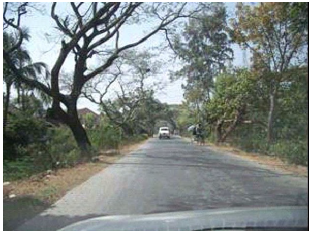
国道117号線(ダイヤモンドハーバー道路) 現状では2車線道路