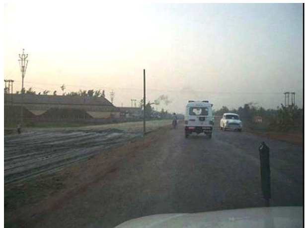
国道41号線 (全面4車線化工事中)