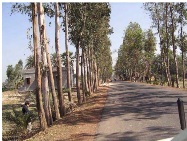
ククラハティ地点へのアクセス道