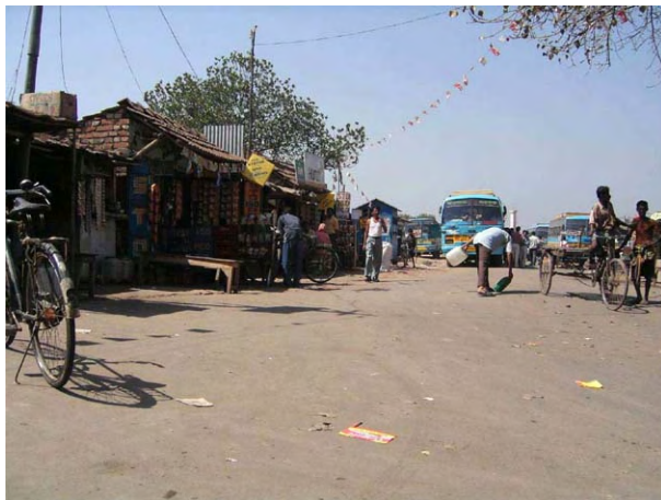
ライチャック側 渡し舟乗り場付近