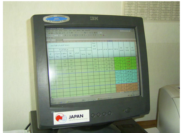
GDCB 農業農地改革書から提供された データの入力画面