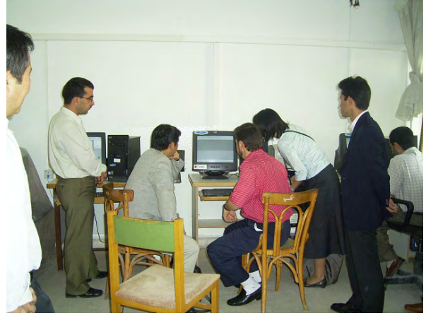
GDCB 整理・収集部での活動について 説明を受ける調査団