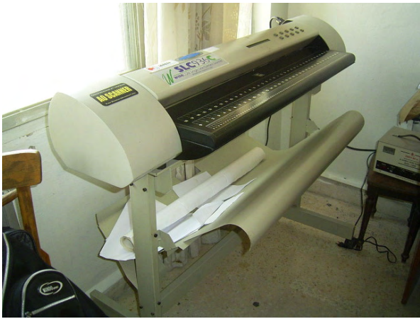
GDCB プロジェクト供与のスキナー