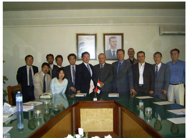
終了時評価ミニッツ署名後の集合写真