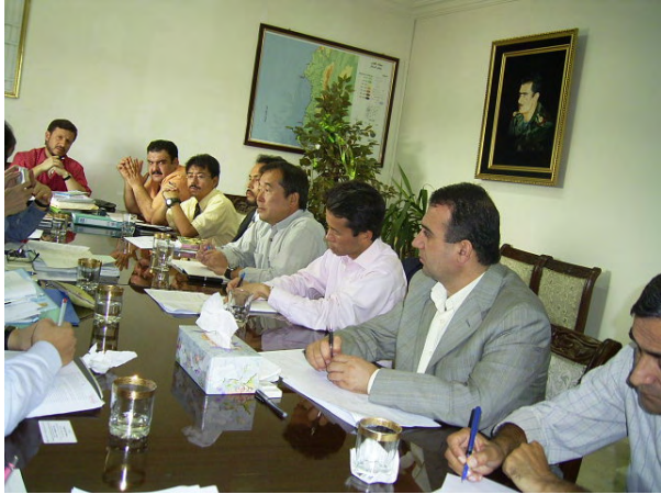
GDCBでの評価結果に関する協議風景