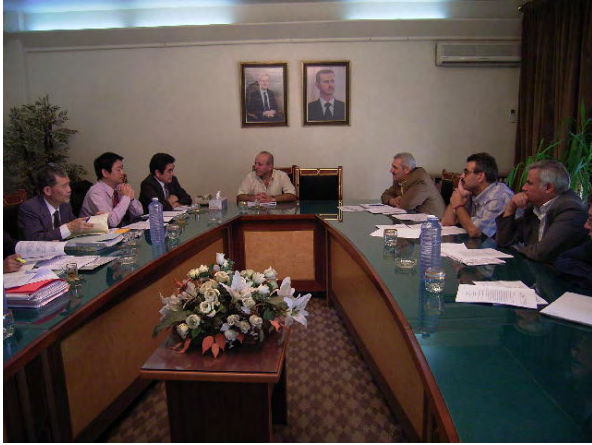
10/17終了時評価ミニッツの協議風景