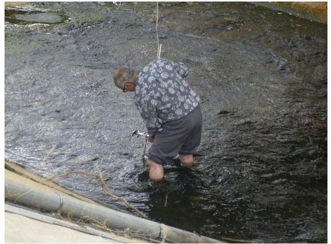
GDBAB カウンターパートによる表流水の観測デモンストレーション (Attakia)