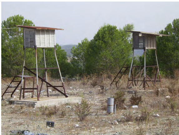
GDCB 気象観測所 No. CW1 (16 Teshreem Dam付近)