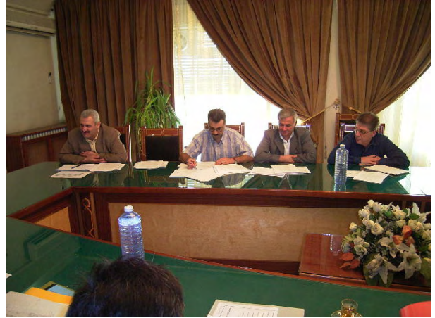
終了時評価ミニッツの協議シリア側参加者