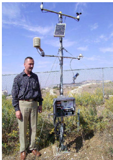
GDCB 気象観測所 (BITANA)