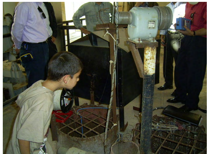
GDCB 自動観測 (水位) (16 Teshreem Dam付近)