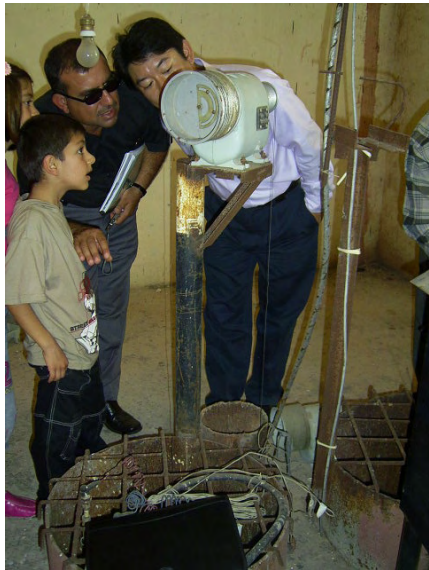
10/16 GDCB 自動観測 (水位) (16 Teshreem Dam付近)