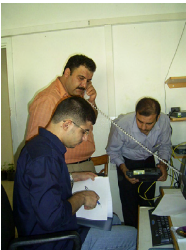
GDCB システムメンテナンス外注 企業によるメンテナンス作業