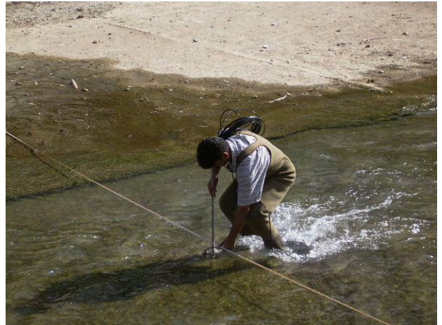
10/14 GDCB カウンターパートによる表流水観測の実演 (MARKIA)