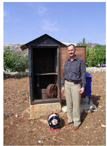
GDCB 地下水位観測 (JOYBAT)