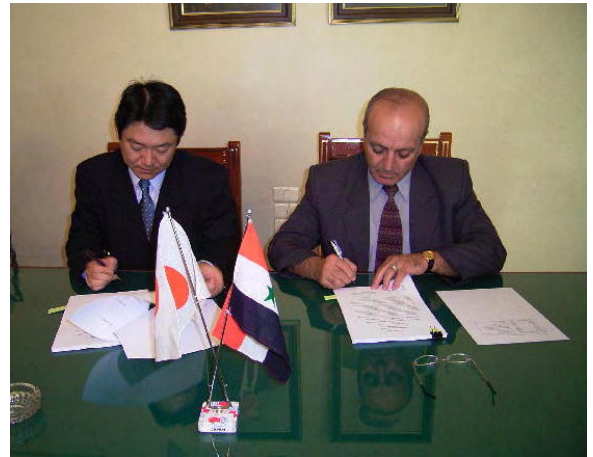
10/19 終了時評価調査ミニッツへの署名