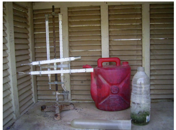
GDCB 気象観測所の百葉箱