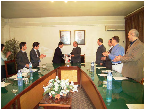
終了時評価ミニッツ署名後の握手