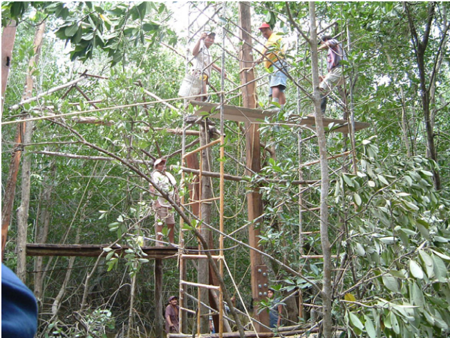
マングローブの木道に建設中の展望台