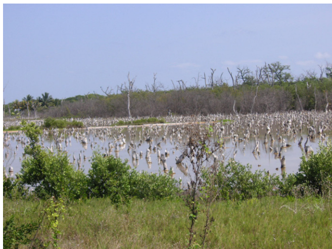
枯死したマングローブ