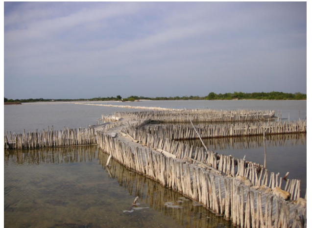
マヤ時代から同じ製法を保つ塩田