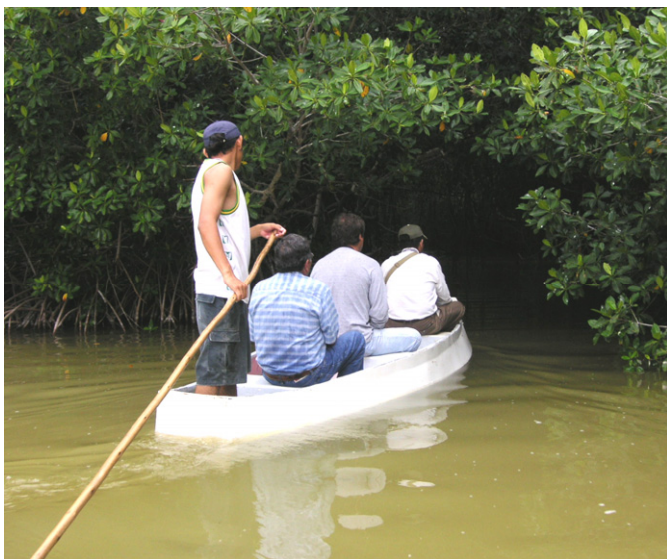
カヌーでのエコツアー