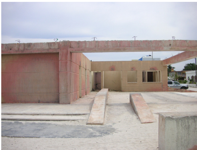
野外ステーション建設予定地