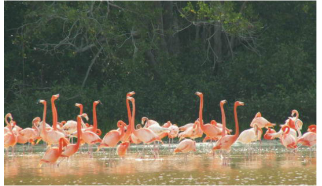
モーターボートによるフラミンゴツアー