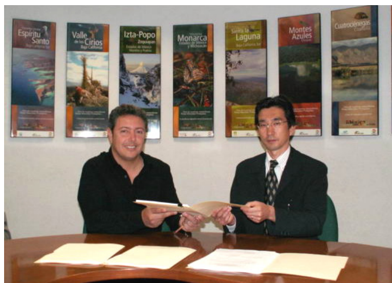
CONANPにてミニッツ署名