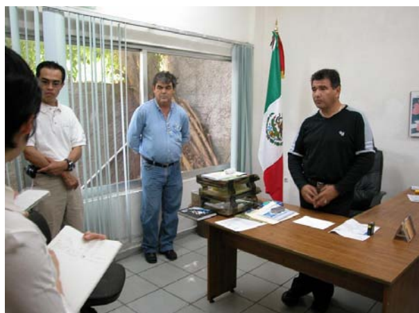
セレストウン市長との面談