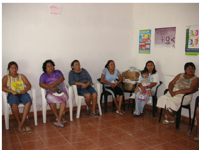
ヘルスセンターにおける研修