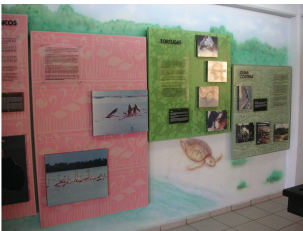
ボート乗り場にあるビジターセンターの展示