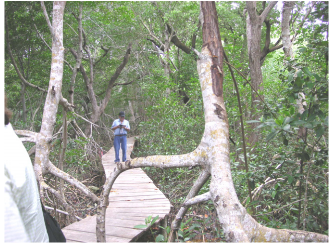
マングローブの木道