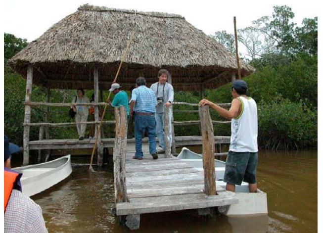
カヌーのツアールートにある休憩所