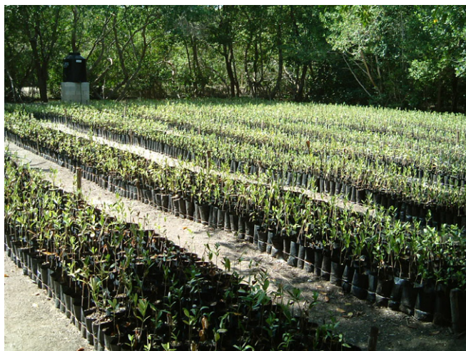
マングローブの苗