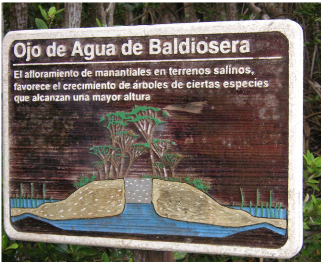
保護区にある湧水の説明標識