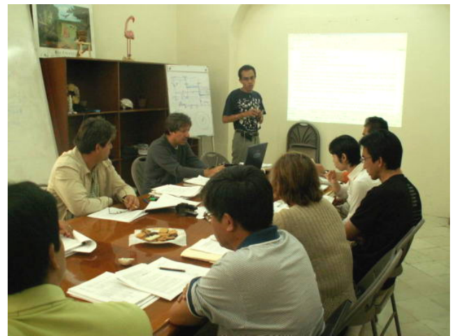
評価報告書検討会