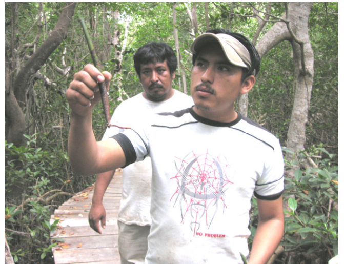
エコツアーのガイドをする漁民