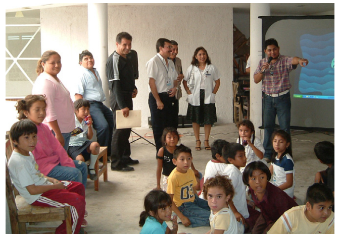
環境教育のイベント