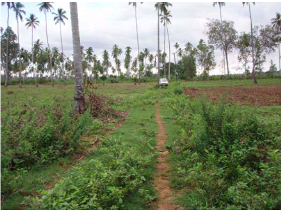
11ヶ所計画されている井戸予定地の 1つ。建設に支障となるものは ない。