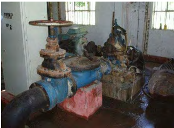
サテニ・ステーション—送水ポンプ 4台のうち3台が故障している。