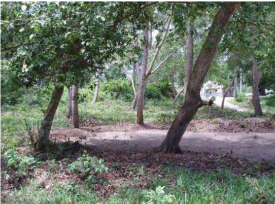
ウェレゾ配水池建設予定地 建設に支障となるものはない。