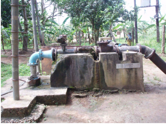
既存井の状況 順調に稼働している。