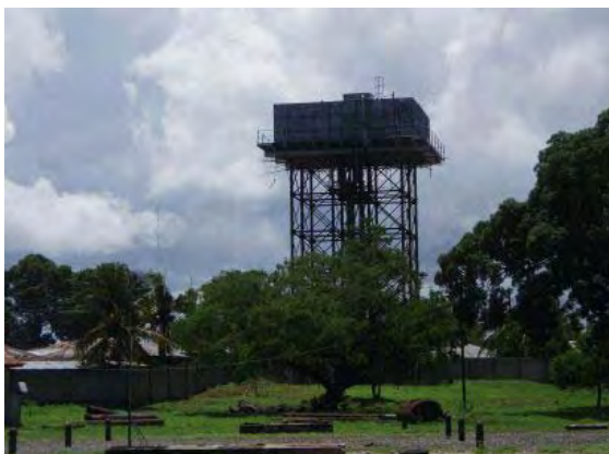
サテニ・ステーション—高架式配水池 DWDにより補修が実施された。