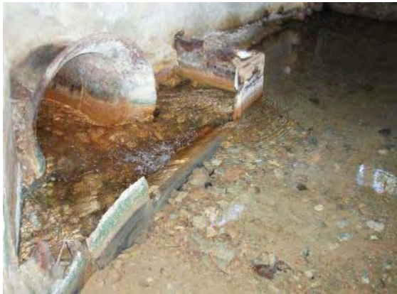
湧水水源—BUBUBUの洞窟内部。清澄な水が取水されている。