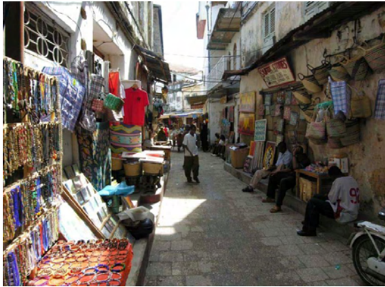
ザンジバルタウン市街地—オールドストーンタウンは世界遺産に登録されている。