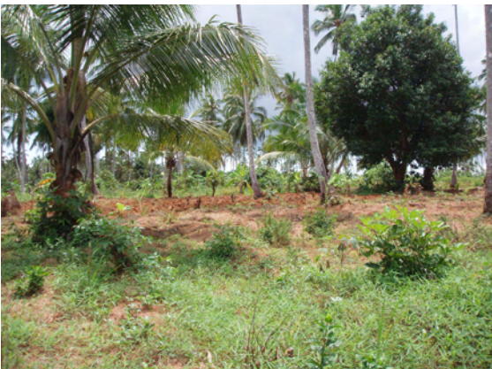
キヌニ配水池建設予定地 丘陵地に新設される。特に建設に 支障となるものはない。