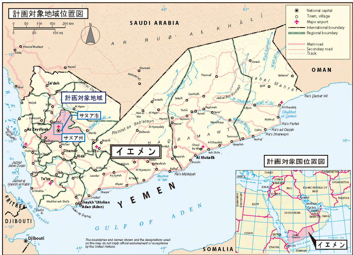
計画対象国及び地域位置図