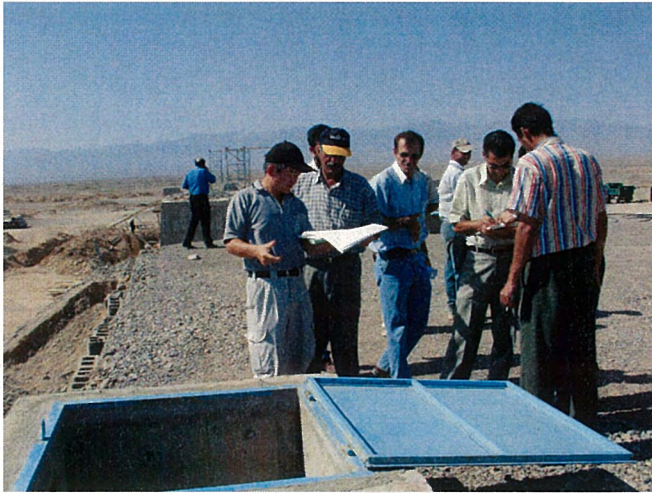
配水池の開口部での検査の様子