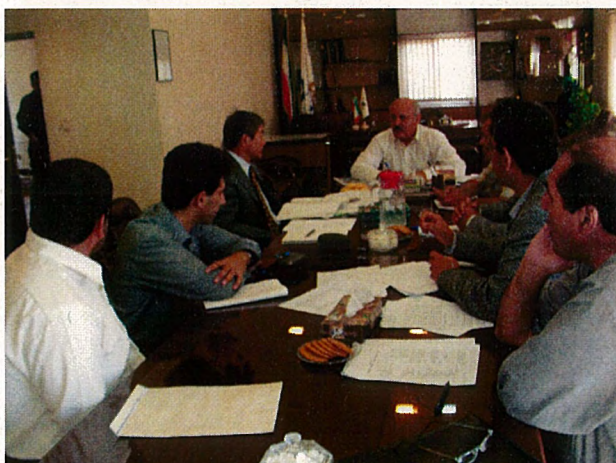
M/M 締結前の協議の様子