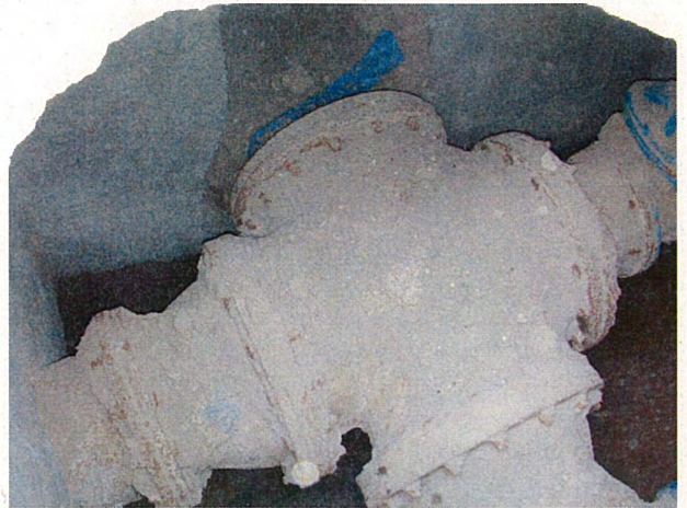
マンホール内部の様子