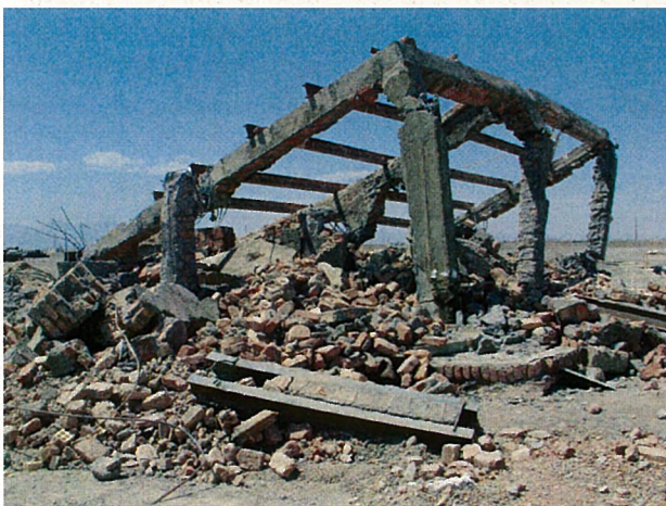
ガス滅菌装置用建物の様子