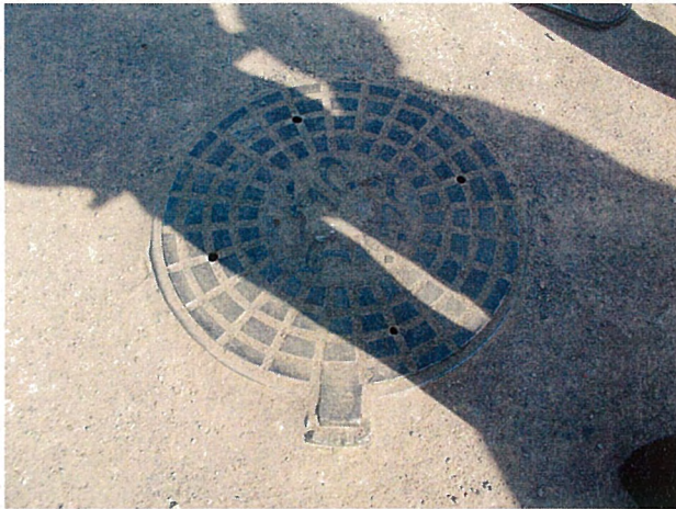
配水管敷設時に作ったマンホール