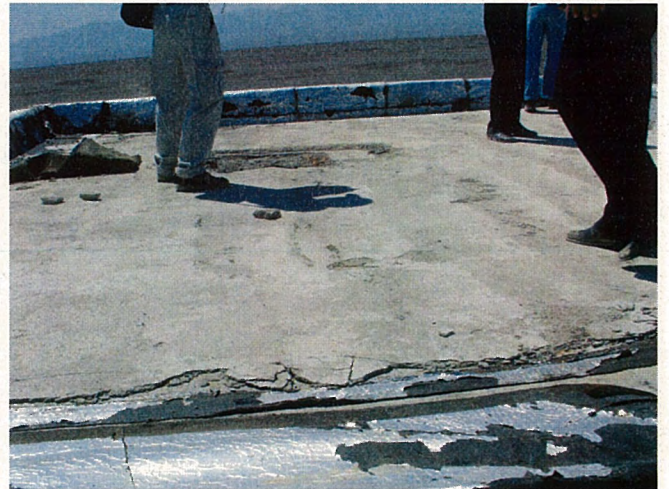
ポンプ室屋根の防水シートがまかれていた