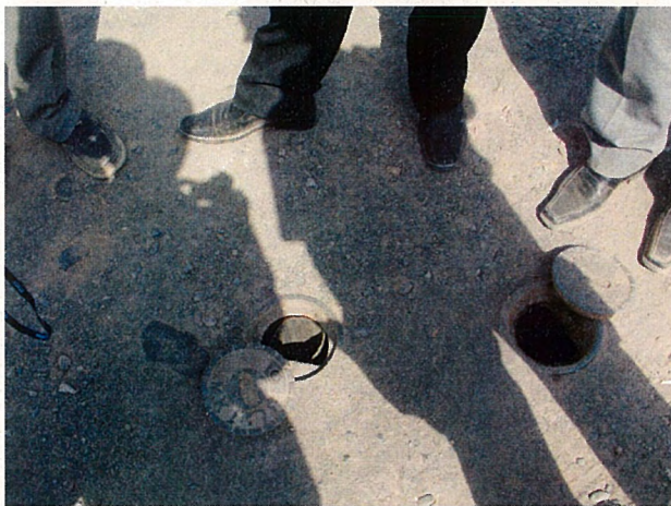
配水管敷設時に設置した止水弁