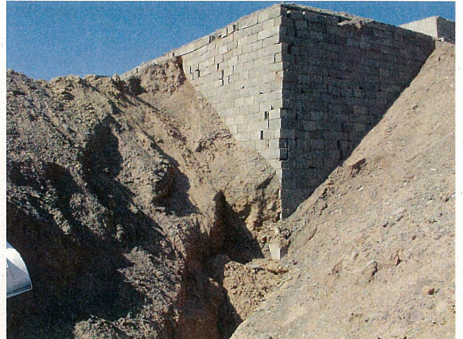
排水パイプが設置され完成されていない