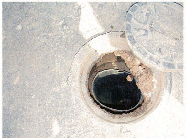
止水弁内部の様子