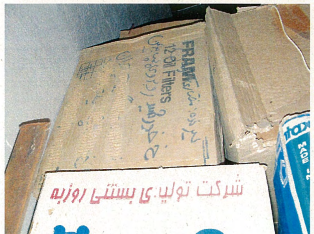
ガス滅菌装置の保管状況