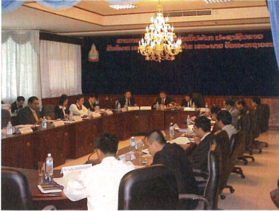
合同調整委員会 (Joint Coordination Committee : JCC) ミーティング