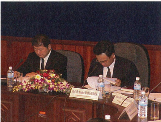
ミニッツ署名式 (2005年2月22日)