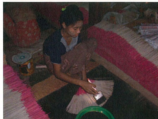
蚊取り線香の製作