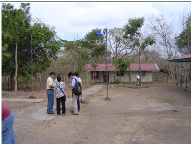
Rivas 県 Belen 市 La Cantimplora 地区小学校① 既に教育文化スポーツ省が FISE の援助を受けて民間業者に発注して井戸を施工していた。