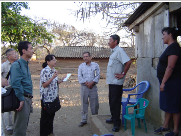
Carazo 県 Santa Teresa 市 El Sol 地区① 同地区内には 16 本の井戸があり、うち 13 本は NGO の支援によって整備されている。