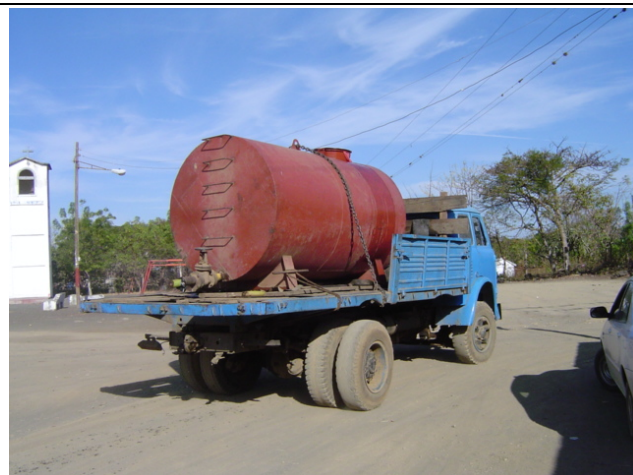
Masaya 県 La Concepción 市 La Sabanita 地区② 乾季には民間業者が 25 コルドバ(約 160 円)/55 ガロン程度で売水に来る。