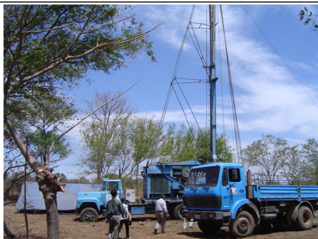
ENACAL 工事現場 El Caplin 地区① ケーブルツール・パーカッション式の井戸掘削機で掘削してい た。