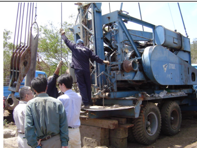
ENACAL 工事現場 El Caplin 地区② 口径 14 インチで予定掘削深度 200m に対して、90m までの掘 削が完了した状態であった。