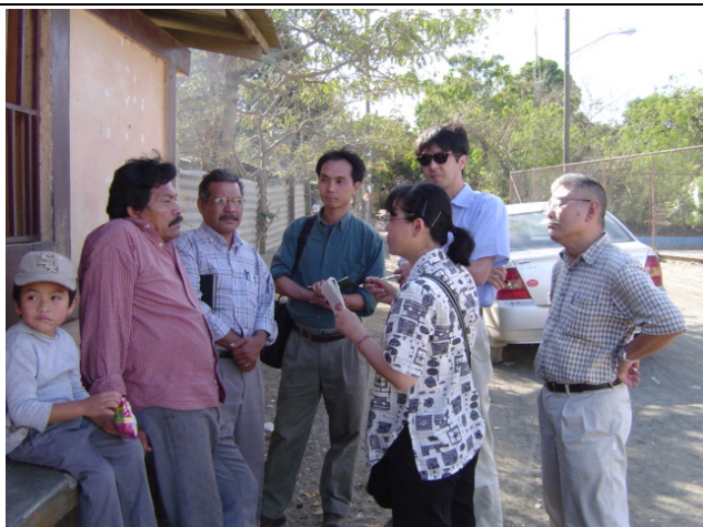
Masaya 県 La Concepción 市 La Sabanita 地区① 別地区より水供給を受けており、約 80%の世帯に配管接続されているが、乾季には断水することが多い。