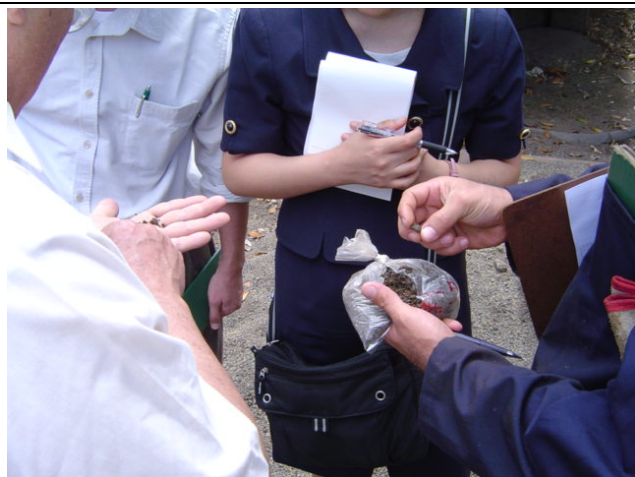
ENACAL 工事現場 Los Alpes 地区③ 掘削深度 1m 毎に土質サンプルを採取して、ケーシング・プロ グラム作成に役立っている。