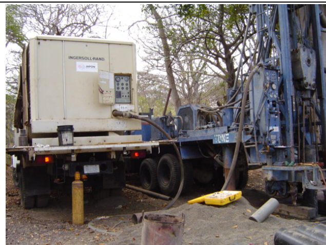
ENACAL 工事現場 Los Alpes 地区② エア・ハンマー掘削工法で約 500m を掘削し終え、井戸ケー シングを挿入する準備をしていた。