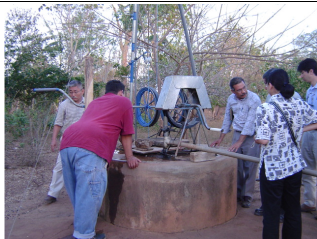
Carazo 県 Santa Teresa 市 El Sol 地区② メカテ・ポンプ(Bonba de Mecate)と呼ばれる手回しポンプによって給水している。