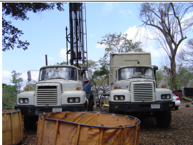
ENACAL 工事現場 Los Alpes 地区① 無償資金協力の「カラソ台地地下水開発計画」にて供与された 井戸掘削機(左)とエア・コンプレッサー車を使用していた。