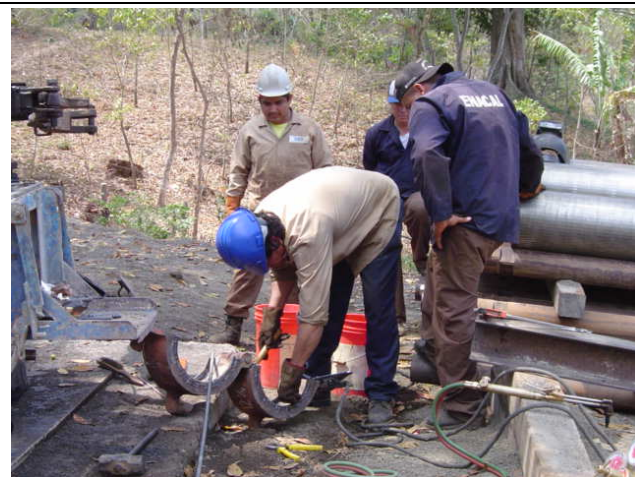
ENACAL 工事現場 Los Alpes 地区④ 現場作業員は掘削機オペレーターの指導の下、非常に活発に 行動していた。