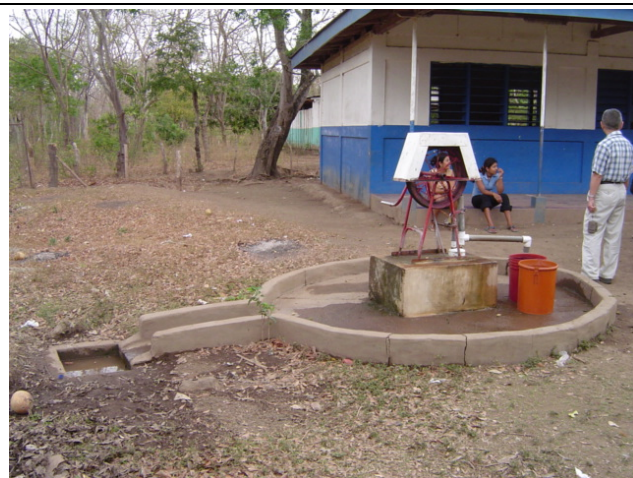
Rivas 県 Belen 市 La Cantimplora 地区小学校② 同地区で唯一の水源であり、近隣住民は自由に井戸を使用することができる。