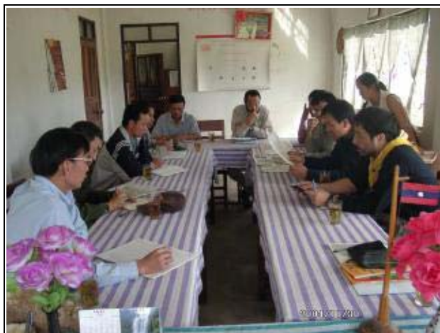
Photo-7 (November 30, 2004) Project data hearing at Nam Choung Project in Muang Meung District, Bokeo Province