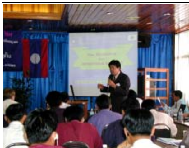
Photo-7 (March 04, 2004) Workshop Presentation by Study Team