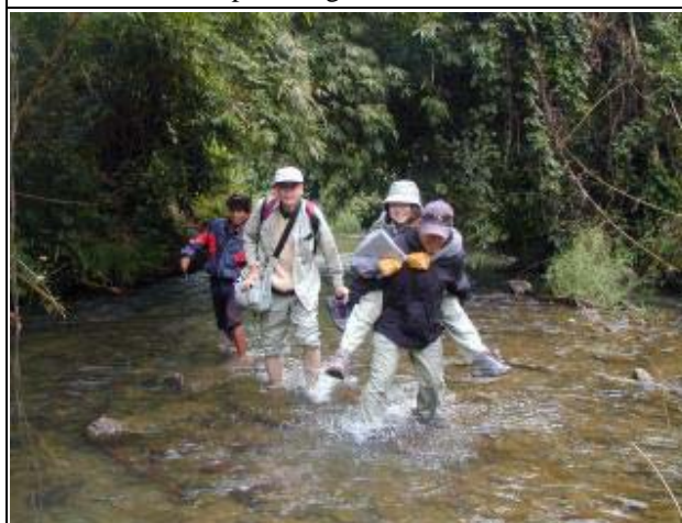
Photo-5 (November 23, 2004) Site Reconnaissance in river at Houay Khouan Project Site in Luangprabang Province