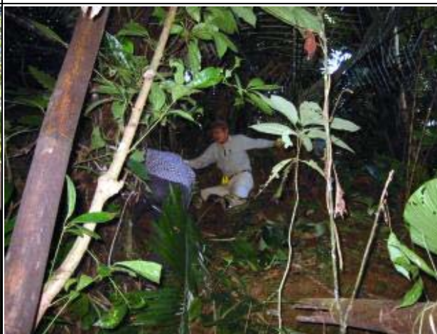
Photo-10 (November 28, 2004) Site Reconnaissance in bush at Nam Hat Project Site, Bokeo Province