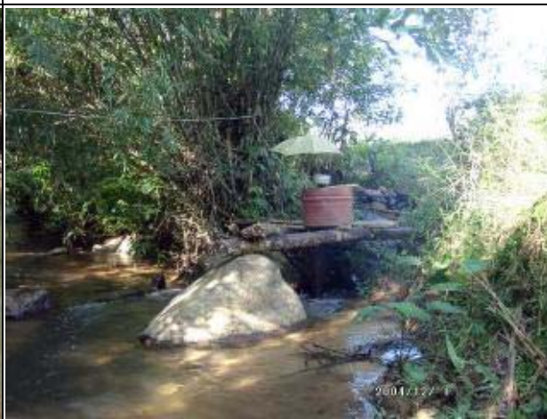
Photo-12 (December 01, 2004) Pico-hydropower at Muang Meuang for Nam Choung Project, Bokeo Province