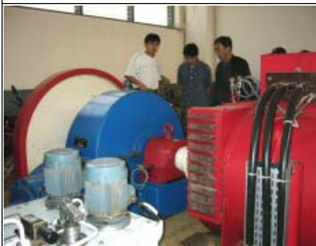
Photo-5 (February 21, 2004) Nam Dong Hydropower Visit