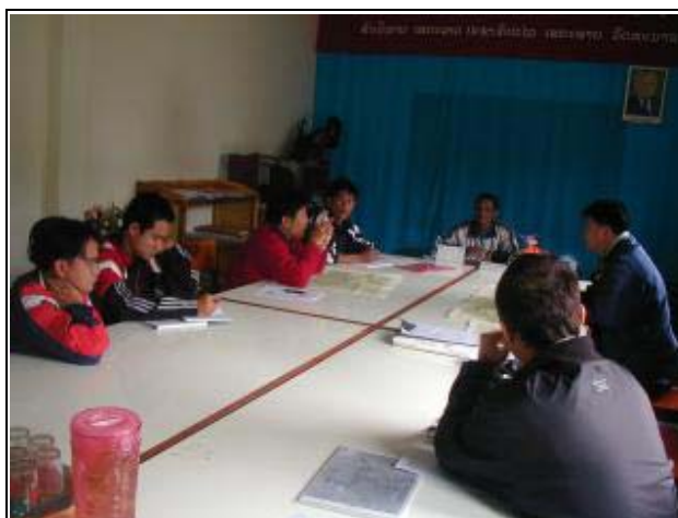
Photo-1 (November 24, 2004) Project data hearing for Houay Khouan Project at Viengkham District Office, Luangprabang Province