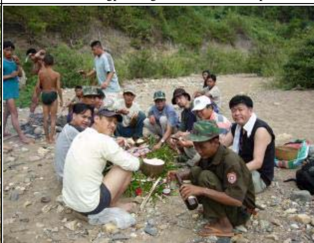
Photo-6 (November 25, 2004) Welcome Lunch Party at Nam Xen River in Luangprabang Province