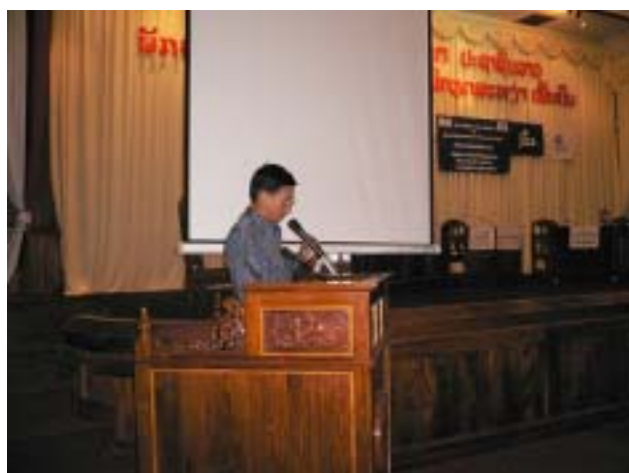
Photo-5 Declaration of Rural Electrification Promotion by MIH Vice Minister Dr. Nam (03 Nov. 2005)