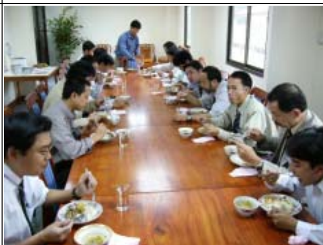
Photo-10 (March 05, 2004) Workshop, Lunch Time