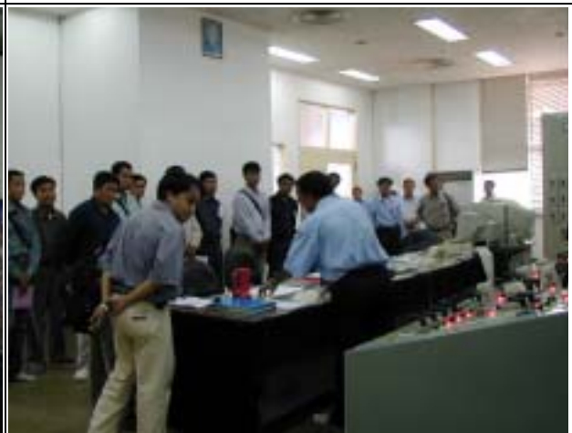
Photo-10 (July 21, 2004) Visit of Nam Ngum Power Station and having a lecture of O&M in the site