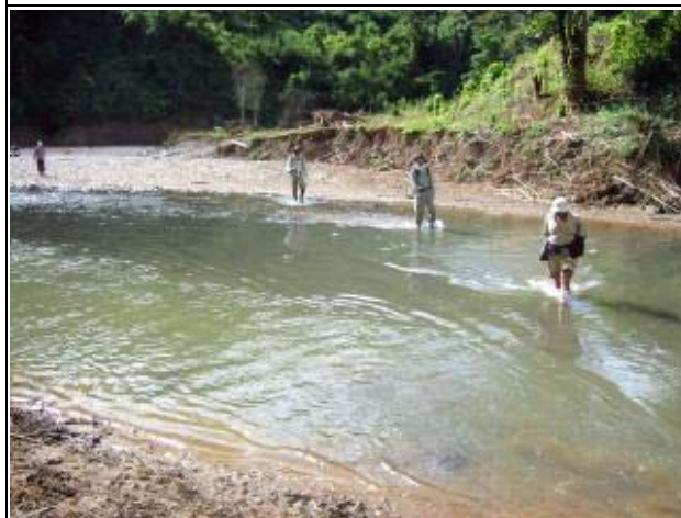
Photo-11 (November 28, 2004) Site Reconnaissance in river at Nam Hat Project Site, Bokeo Province