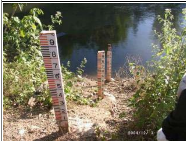
Photo-9 (December 03, 2004) Water Level Gauge Staff installed at Nam Gnone Project in Bokeo Province, in late April 2004