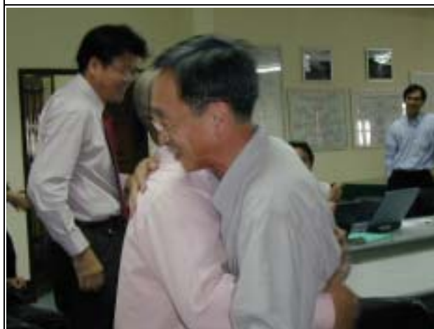
Photo-17 (July 23, 2004) Training planner and DOE staff after awarding