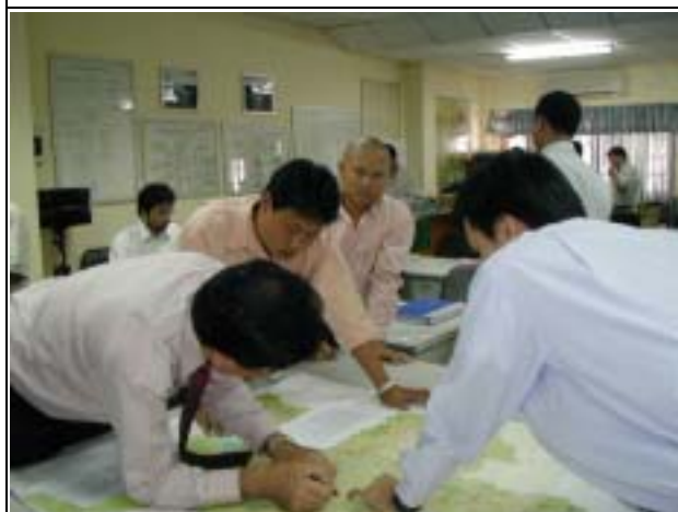
Photo-15 (July 23, 2004) Map study and discussion about site reconnaissance