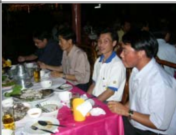
Photo-18 (July 23, 2004) Farewell party