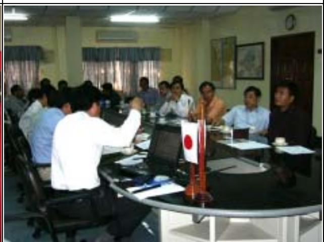
Photo-6 (March 03, 2004) Coordination Meeting