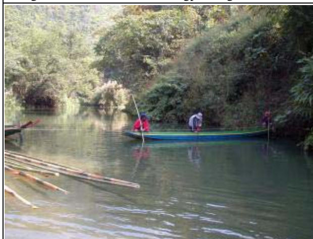
Photo-3 (November 23, 2004) River Discharge Measurement at Nam Mi Project Site in Viengkham of Luanpurabang Province