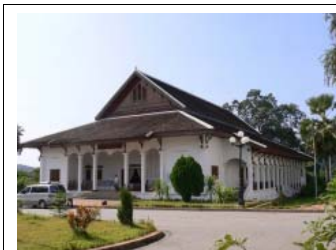
Photo-1 The Luangphrabang Provincial Hall, Place of Workshop (02 Nov. 2005)