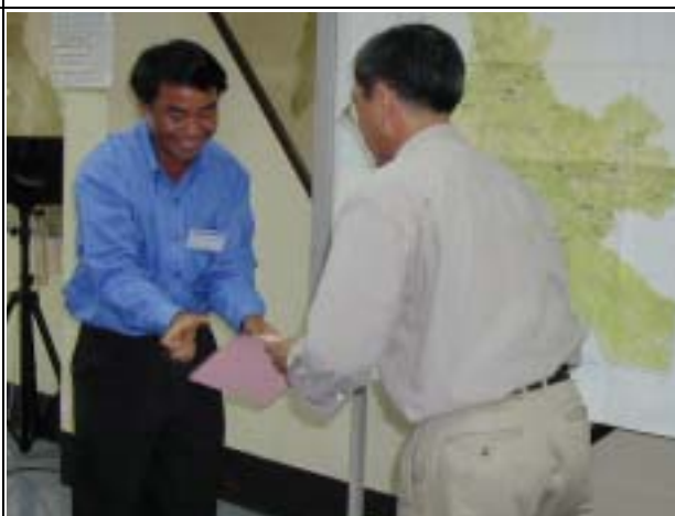
Photo-16 (July 23, 2004) Awarding of the certificate