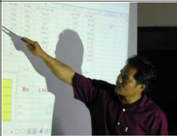
Photo-4 (July 06, 2004) Lao Interpretation and supplementary explanation by DOE member