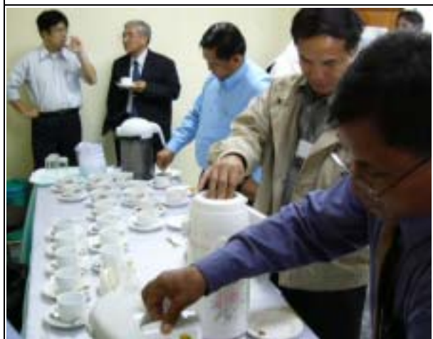
Photo-9 (March 04, 2004) Workshop, Tea Break