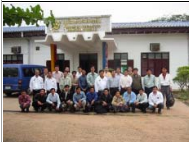
Photo-5 (March 05, 2005) EDL Training Center