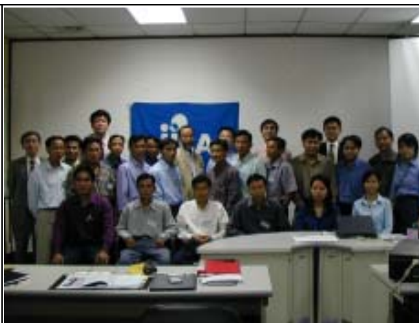
Photo-2 (July 05, 2004) Trainee, DOE member, JICA Study Team, and staffs of the Lecture