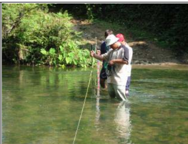
Photo-8 (November 26, 2004) River Discharge Measurement Works at Nam Pha Project, Luangnamtha Province