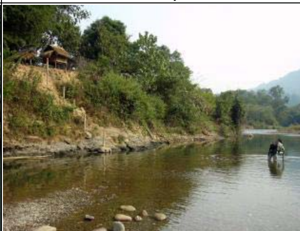
Photo-4 (November 25, 2004) Water Level Gauge Staff installed at Nam Xen Project in B.Pak Um of Luangprabang Province in late April 2004