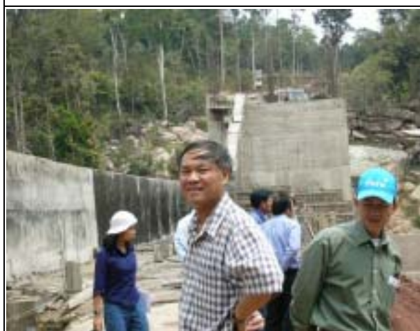
Photo-11 (March 05, 2004) Nam Mang 3 Hydropower Construction Site Visit