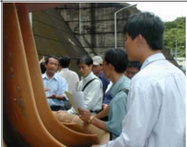
Photo-12 (July 21, 2004) Having explanations of Francis turbine maintenance of Nam Ngum PS