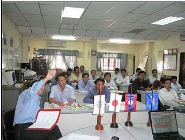
Photo-3 (July 18, 2005) 4th Lecture (Economics)