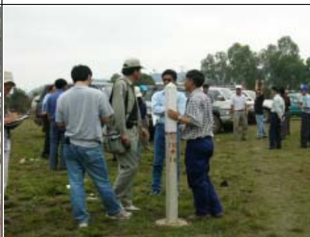
Photo-12 (March 05, 2004) Nam Mang 3 Hydropower Impounded Area Visit