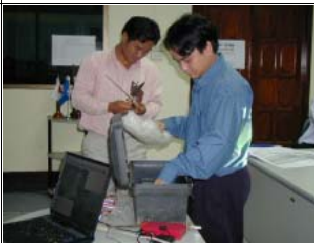
Photo-6 (July 06, 2004) Teaching how to use current meter for discharge measurement by DOE staff