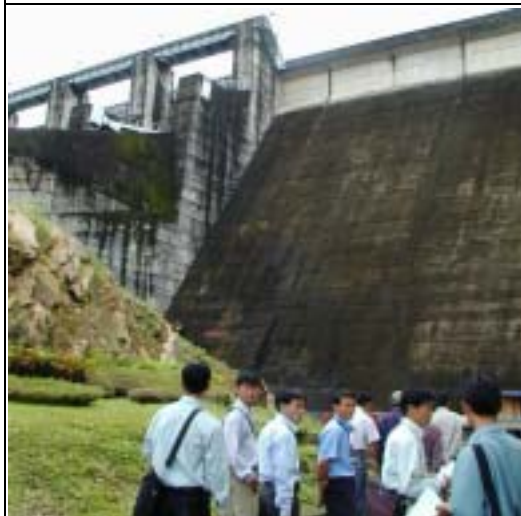
Photo-11 (July 21, 2004) Visit the dam site of Nam Ngum Power Station