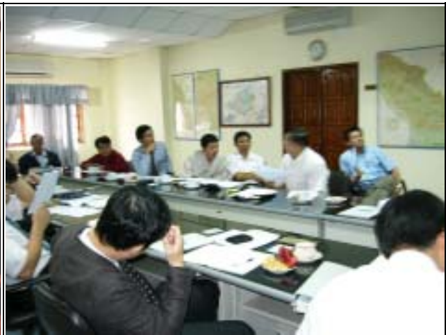
Photo-2 (February 17, 2004) Inception Discussion