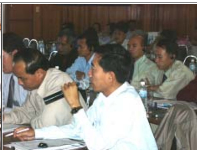
Photo-8 (March 17, 2004) Workshop Presentation by PDIH