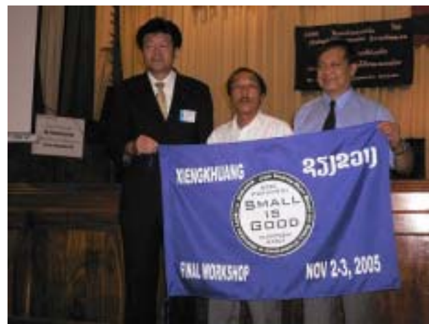
Photo-6 Handing Over of Symbol Flags to 8-PDIH, DOE and JICA Laos Office (03 Nov. 2005)