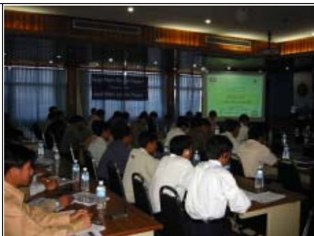
Photo-2 (March 07, 2005) 2nd Workshop Presentation