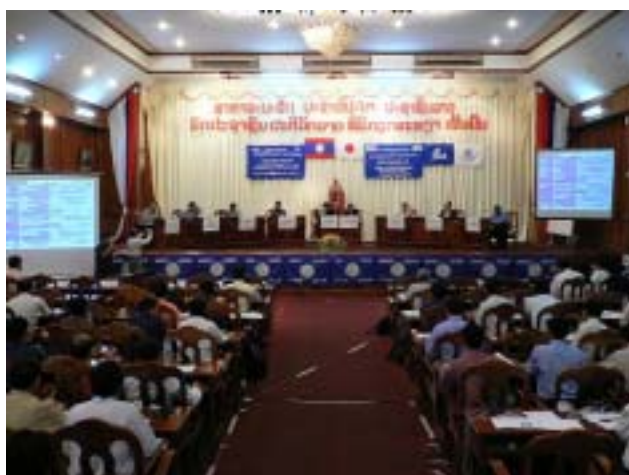
Photo-3 Panel Discussion with 7-Panelist on Off-grid Small-Hydro, Main Event of Workshop (03 Nov. 2005)