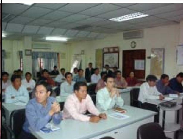
Photo-4 (March 01, 2005) Lecture in 3rd PDIH Training