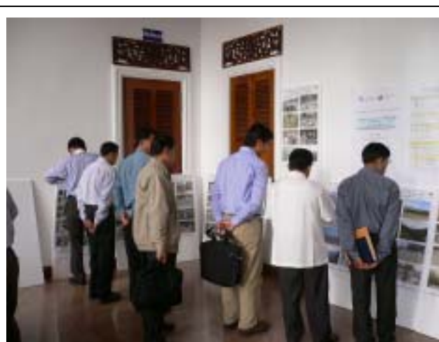
Photo-2 Exhibition of Photographs of Capacity Building & GIS Maps in the Master Plan Study (02 Nov. 2005)